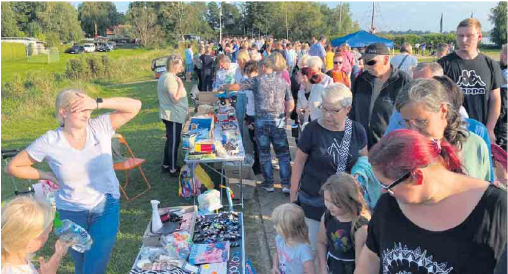
Bücher, Geschirr, alte Schallplatten, ausrangierte Kleidung, Spielzeug und vieles mehr suchte und fand oftmals neue Besitzer.

Rekordverdächtige Besucherzahlen beim Abendflohmarkt