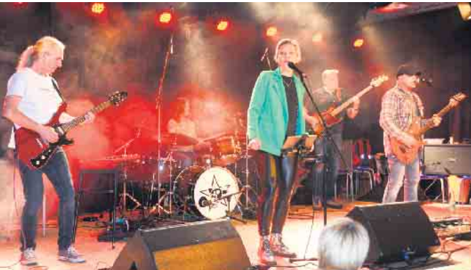
„The Parsley Experience“ werden beim 18. Stemweder Biker Treffen für den musikalischen Rahmen sorgen.

Für Informationen steht das Life House (Tel.: 05773/991401) zur Verfügung.