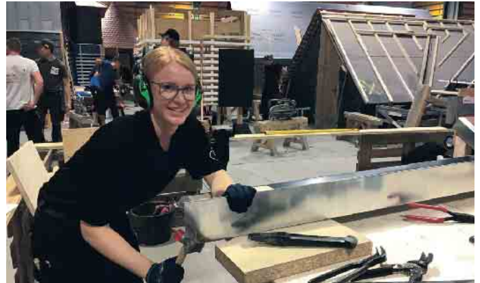
Im Dachdeckerhandwerk ist nicht mehr nur reine Muskelkraft gefragt. Dafür aber vielseitige Fähigkeiten, die den Beruf zunehmend für Frauen interessant machen.

Traditionelle Männerberufe werden zunehmend auch für Frauen interessant. Denn mittlerweile ist nicht mehr reine Muskelkraft gefragt. Zum Beispiel im Dachdeckerhandwerk: Dachziegel werden nicht mehr nach oben geschleppt,