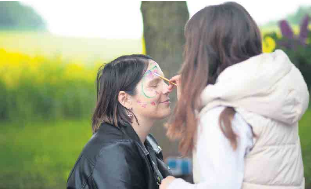
Im Kinderhaus in Sundern wird am 21. September ein bunter und informativer Nachmittag geboten, der ganz unter dem Motto „Märchenwald“ steht (Symbolfoto).

Aktionstag unter dem Motto „Märchenwald“ - Besucher dürfen sich von buntem Programm verzaubern lassen