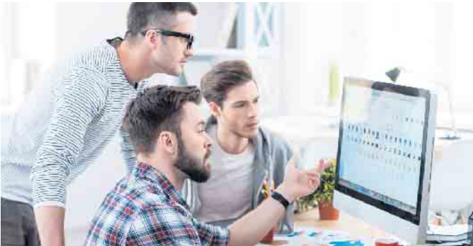
Fachkräfte werden in der IT-Branche händeringend gesucht. Für Quereinsteiger und Arbeitssuchende eröffnen sich mit einer Weiterbildung gute Berufschancen.

Quereinsteiger können mit Weiterbildungen in der IT-Branche durchstarten