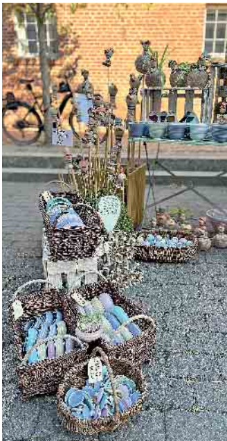
Impressionen Töpfermarkt: Eva Maria Deutschländer

ten eine breite Auswahl an klassischen und trendaktuellen Herbstwaren. Wer zwischendurch eine Erholungspause braucht, kann sich in den geöffneten Cafés, Gaststätten und Restaurants stärken. Vielfältige Imbissstände sorgen mit Currywurst, Burger & Co. für das leibliche Wohl.