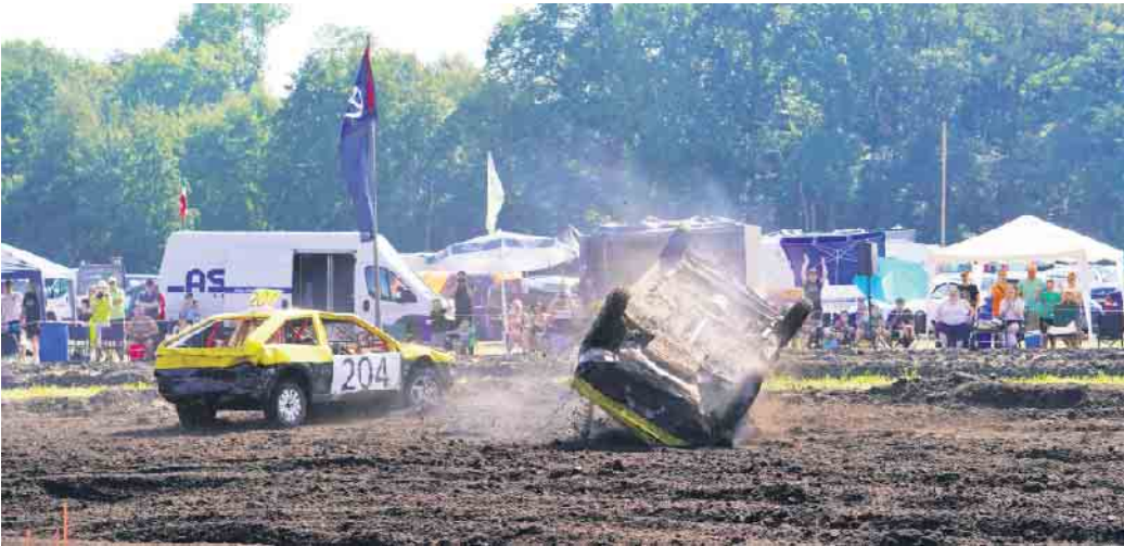
Schlammsschlacht mit viel PS: Beim Stock Car Rennen in Destel sind Crashes und Zusammenstöße ausdrücklich erlaubt.

Destel. Die Motoren an der L770 in Destel heulen zum zweiten IGNN Lauf auf: Am Samstag, 31. August, ab 14 Uhr und am Sonntag, 1. September, ab 9.30 Uhr ist es wieder soweit.