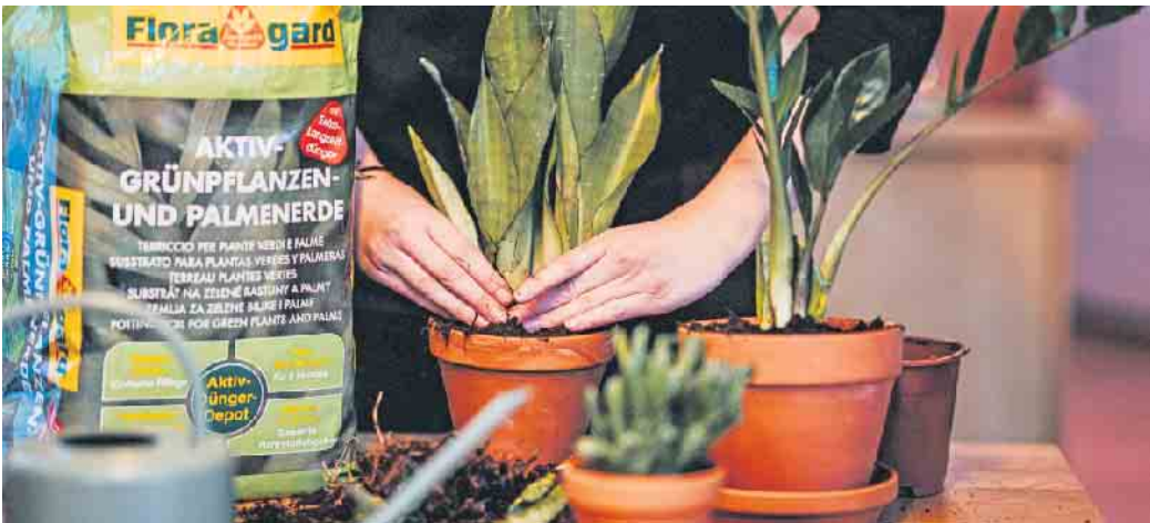
Praktisch sind Erden mit Langzeitdünger, sodass für bis zu drei Monate nicht nachgedüngt werden muss.

Richtig anpflanzen oder umtopfen Allerdings ist nicht jede Zimmerpflanze so anspruchslos wie die genannten pflegeleichten Arten. So benötigen Kakteen beispielsweise eine sehr durchlässige Erde mit einem hohen Anteil an Sand. Zimmerorchideen wiederum wünschen sich ein lockeres, nährstoffarmes Substrat mit grober Pinienrinde und Kokos für eine ausreichende Luftversorgung der empfindlichen Wurzeln. In diesem Fall sollten Freizeitgärtner zu Spezialerden greifen, unter www.floragard.de gibt es dazu mehr Informationen und viele nützliche Pflegehinweise. Tipp: Das Ende der Wachstumsruhe im Frühjahr ist ein guter Zeitpunkt zum Umtopfen. Zimmer- und Kübelpflanzen sollte man je nach Pflanzenart und Wuchs etwa alle ein bis drei Jahre umtopfen - oder spätestens dann, wenn der Topf zu klein wird. Auch dabei empfiehlt es sich, eine hochwertige, frische Pflanzenerde zu verwenden. Die Blütezeit hingegen sollte man für ein Umtopfen vermeiden, da die Pflanzen dann die volle Kraft für ihr Wachstum benötigen. (DJD)