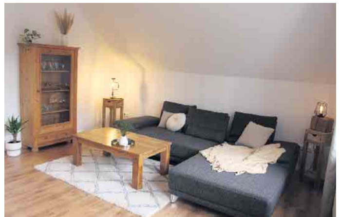
Gemütlich und mit liebevollen Details ausgestattet ist das Wohnzimmer.