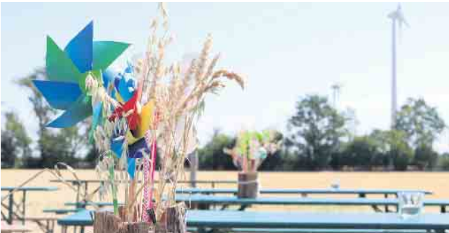
Zur Inbetriebnahme soll gemeinsam mit den Menschen vor Ort im neuen Windpark Tiefenriede gefeiert werden.

Drohne. Der neue Windpark in der Tiefenriede ist errichtet: Insgesamt zehn Windenergieanlagen tragen mit 45 Megawatt Leistung einen wichtigen Teil zur lokalen Energie- wende in Stewwede bei. Der Windparkprojektierer und - betreiber enercity Erneuerbare möchte diesen wichtigen Meilenstein gemeinsam mit den Bürgern der Gemeinde feiern und lädt für Sonntag, den 1. September, von 12 bis 17 Uhr in die Drohner Straße zum Feiern ein. Ein leckeres BBQ, erfrischende Getränke und ein buntes sowie informatives Rahmenprogramm laden zum Verweilen ein und binden auch die jüngsten Besucher unterhaltsam mit ein. Bei Fragen rund um den Windpark und Beteiligungsmöglichkeiten können Bürger direkt mit Experten der enercity Erneuerbare an eingerichteten Informationsständen in den Austausch treten.