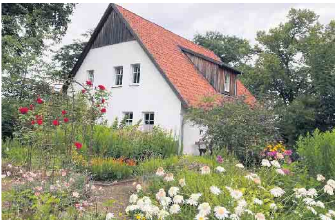
In dem renovierten Heuerlingshaus befindet sich die geräumige Ferienwohnung.

„Unser Verein hat sämtliche Handwerksarbeiten, wie Fußboden verlegen, tapezieren und streichen in Eigenregie durchgeführt“, verdeutlicht Huntemann. So sei man für die Renovierung mit einem Kapital von rund 10.000 Euro hingekommen. Jetzt steht die 85 Quadratmeter große Ferienwohnung mit High Speed Internet auf dem Leverner Mühlengelände Urlaubern zur Verfügung.