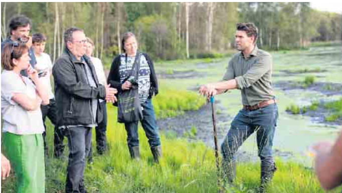
NRW-Umweltminister Oliver Krischer (l.) und Sönke Tielbürger (Untere Naturschutzbehörde, r.) hatten reichlich Gesprächsstoff.

stark bedrohter Lebensräume. Eingebettet in landwirtschaftliche Flächen hat das Weiße Moor eine wichtige Bedeutung als Lebensraum für gefährdete Arten und Trittsteinbiotop für andere Mooregebiete wie das Große Torfmoor oder das Oppenweher Moor. An den zentralen Moorkernen mit randlichen Moorbirkenwäldern schließt sich ein Grünlandgürtel mit Heideflächen und Borstgrasrasen, Kleingewässern und Kleingehölzen an. Zur Verbesserung der Lebensräume und des Wasserhaushaltes werden verschiedene