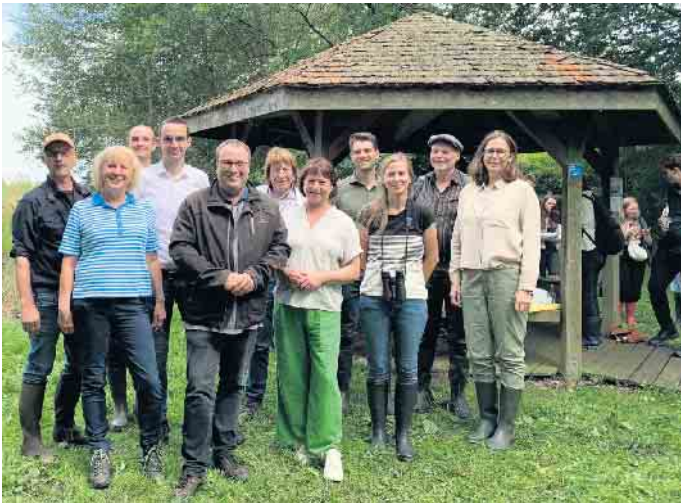
NRW-Umweltminister Oliver Krischer (4.v.l.) vor der Schutzhütte im Oppenweher Moor mit Naturschutz-Experten und Kollegen aus der Politik.