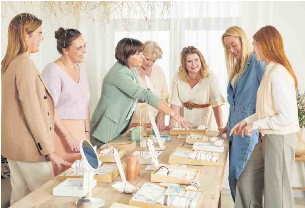
Gemeinsam mit Bekannten Schmuck auszuwählen und alles genau zu begutachten, macht Spaß und kann einen guten Verdienst einbringen.

Bei dieser Tätigkeit hat man die Aufgabe, Schmuckstücke der aktuellen Kollektion eines Herstellers im Rahmen von privaten Partys an Freunde, Bekannte oder Verwandte zu verkaufen.