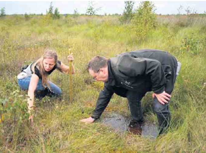
Moore spielen im Klimaschutz eine wichtige Rolle. Zudem sind Moore bedeutsame Wasserspeicher.