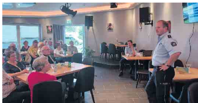
Volles Haus im Kulturtreff „Q“ im Wehdeimer Life House: Rund 70 Teilnehmer verfolgten interessiert die fachkundigen Ausführungen der Polizei.

Alle Anwesenden dankten der Verkehrsprävention gern mit Applaus für die hilfreichen und teilweise speziellen Ausführungen.