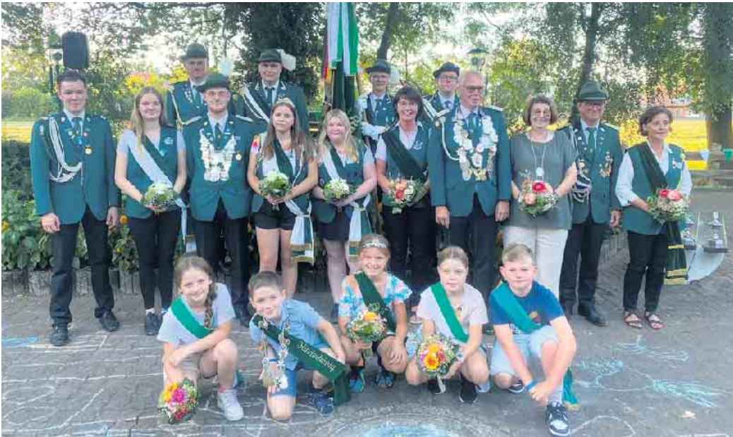
Die Haldemer Majestäten mit ihrem Hofstaat und Verantwortlichen des Vereins.

Gefeiert wurde der Samstagabend mit den Gastvereinen aus Reiningen, Arrenkamp, Rahden, Levern und den Jungschützen Wehden sowie den Radlern aus Dronhe. Für Stimmung sorgte das „Musik Team“ auch am Sonntag, als die Haldemer mit den Gastverein Oppendorf die neuen Majestäten im Festzelt feierten.