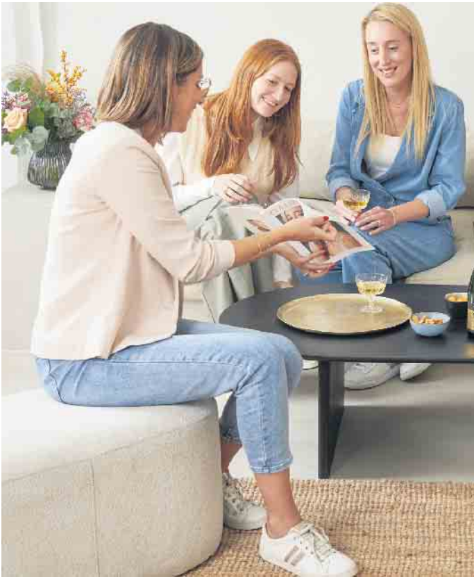
Die Aufgabe einer Schmuckstylistin ist es, eine aktuelle Kollektion vorzuführen und ihre Kundinnen gut zu beraten.