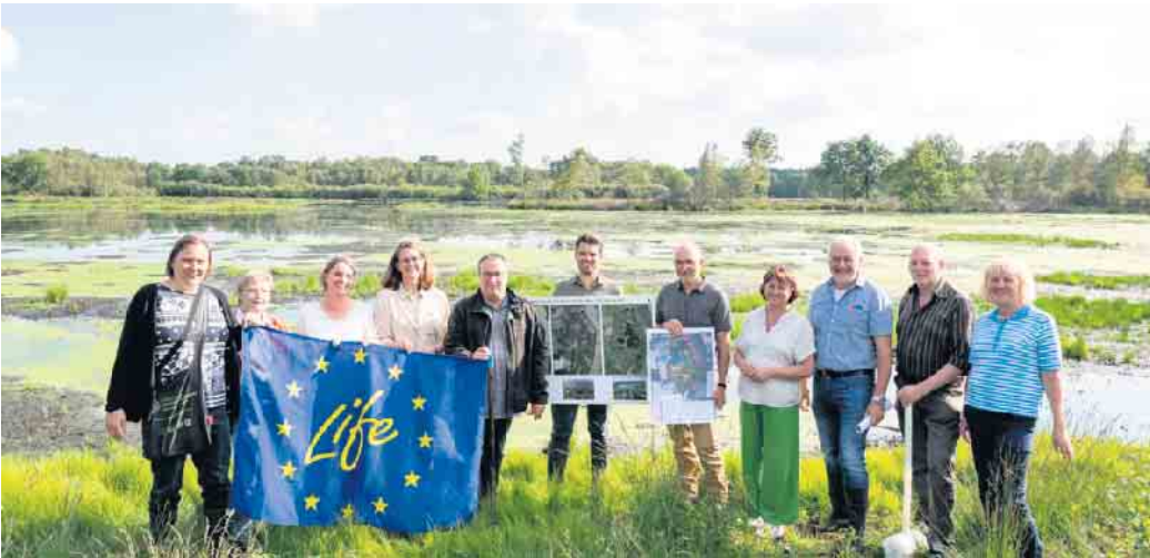
Die Beteiligten mit NRW-Umweltminister Oliver Krischer (5.v.l.): Die Fördermittel vom EU-Programm „Life“ werden unter anderem im „Weißen Moor“ in Rahden für die Schutzmaßnahmen angelegt.

Oppenwehe/Rahden (mama). Um sich über Möglichkeiten und Herausforderungen bei umgesetzten und geplanten Moor-Renaturierungen auszutauschen, hat Umweltminister Oliver Krischer im Rahmen seiner Thementour 2024 drei Mooregebiete besucht. Dazu zählten unter anderem das „Oppenweher Moor“ und das „Weiße Moor“ in Rahden. Übergangs- und Schwingrasenmooren mit Moorgewässern prägen das Naturschutz- und FFH-Gebiet „Oppenweher Moor“, das zu den bedeutendsten Moorbildungen Nordwest-Deutschlands gehört und bis über die Landesgrenze nach Niedersachsen reicht. In Nordrhein-Westfalen stehen rund 471 Hektar des Gebietes unter Schutz, wovon Moore rund 215 Hektar einnehmen. Die intakten Bereiche des Moorkörpers haben einen guten Erhaltungszustand und sollen als Ausgangspunkt für weitere Verbesserungen der Lebensraumqualität angrenzender Bereiche genutzt werden. Hierzu werden die Flächen entbuscht, um die Verdunstung zu verringern, beweidet und wiedervernässt. Das Naturschutzgebiet „Weißes Moor“ in Rahden vereint auf kleinem Raum eine Vielzahl ehemals landschaftstypischer und heute