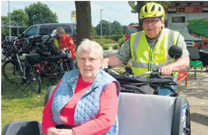
Rikschas für Stewede