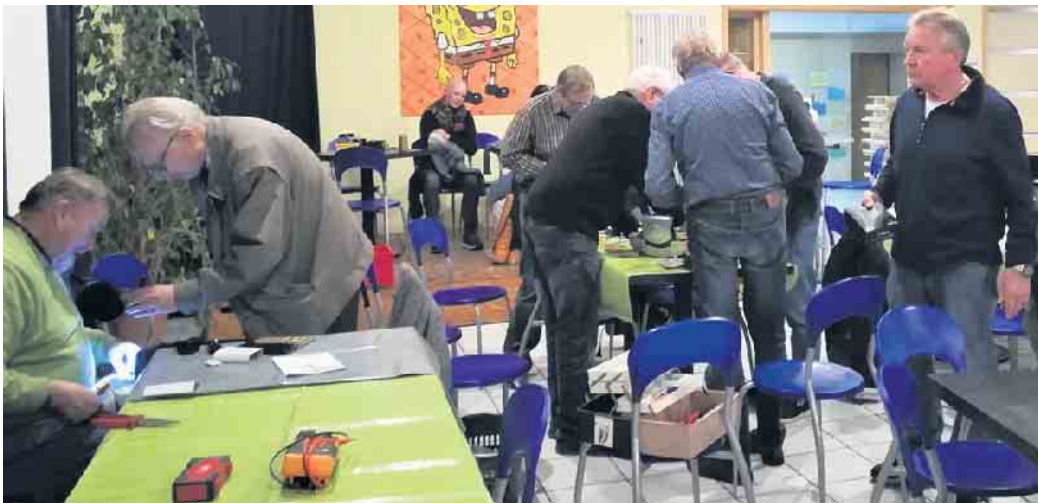
Reparatur Café Stewede