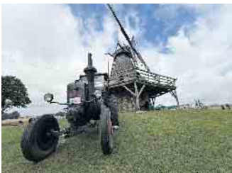
Alte Technik trifft Tradition: Ein historischer Lanz-Bulldog vor der Leverner Windmühle.