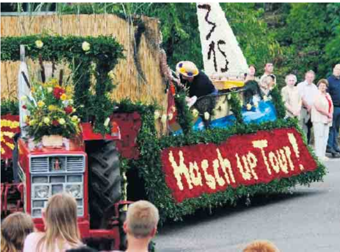
Masch up Tour!