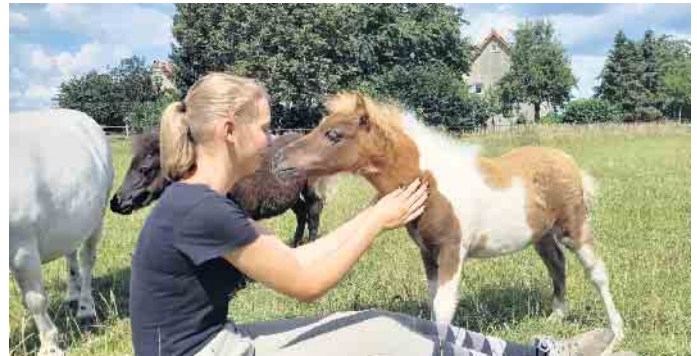
Mini-Pferde erfreuen die Kinder

Für die Planung der nächsten Ausflugsziele steht der Schäferkarren mit vielen Informationsmaterialien zur Verfügung. Abgerundet wird das Programm durch einige Verkaufsstände, die ihre selbstgemachte Deko, Kinderbekleidung oder andere schöne Dinge verkaufen.