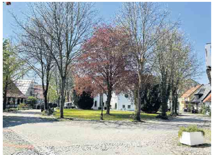
Der Kirchplatz in Dielingen wird zur Baustelle. Die geplante Sanierung zur Verbesserung der Aufenthaltsqualität und der Parksituation beginnt.

Das Land NRW fördert das Projekt mit rund 170.000 Euro. Ziel ist es, nicht nur die Parksituation rund um den Kirchplatz erheblich zu verbessern, sondern vor allem auch die Aufenthaltsqualität deutlich zu steigern.