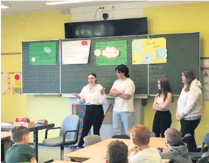
Die älteren Schüler...

An der Stemweder-Berg-Schule werden seit 2017 Medienscouts ausgebildet. Sie sind Experten im Bereich Mediennutzung, Datenschutz, Cy-