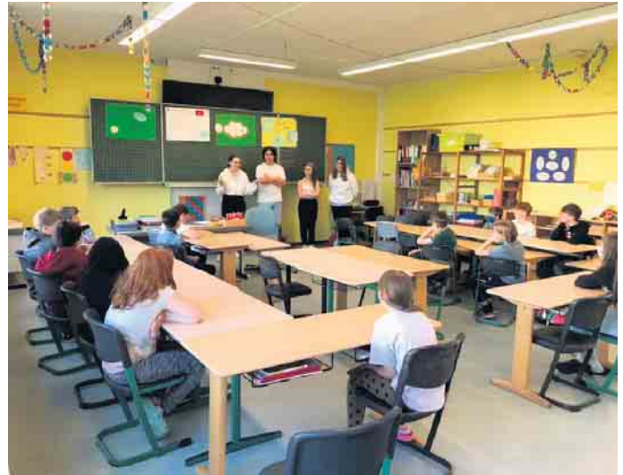
... trafen auf die Viertklässler

bermobbing und vielen rechtlichen Fragen. Mit ihrem Wissen sind sie Ansprechpartner für die Schüler und Schülerinnen ihrer Schule und informieren die Klassen über