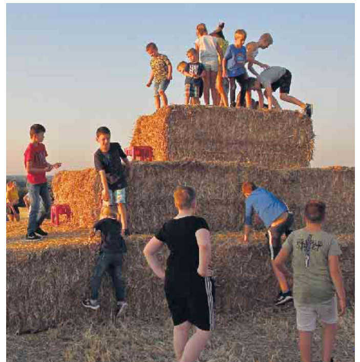
Auch in diesem Jahr gibt es wieder eine Strohpyramide