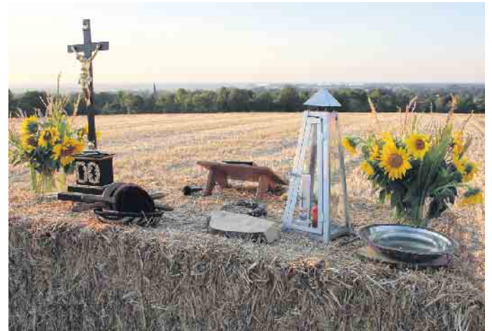
Das Kleifest ist für die Besucher gewappnet

Dielinger Straße 45 32351 Stemwede www.lillis-salon.de