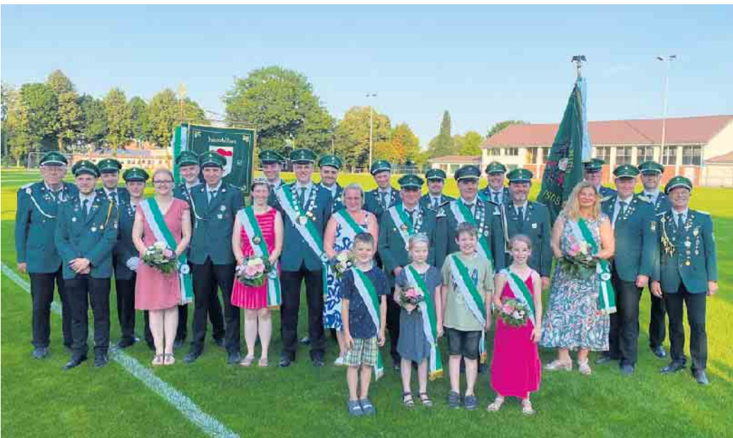
Die neuen Majestäten des Wehdemer Schützenvereins und deren Hofstaat mit Verantwortlichen präsentieren sich dem Schützenvolk.