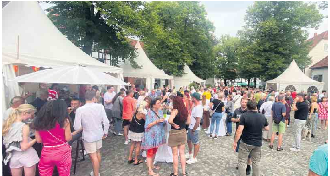
Der historische Kirchplatz in Bad Essen fühlte sich zusehends am ersten Abend der Culinaria.

Für Aperol Spritz, Gin Basil Smash oder Melonenbowle mussten die Fans schon mal Schlange stehen.