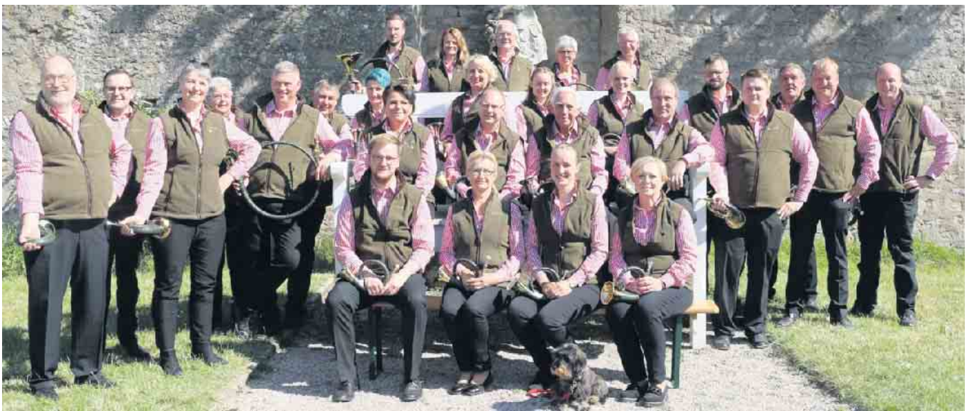
Die Bläsergruppe Stemweder Berg war erfolgreich beim Landeswettbewerb in Springe.

Stemweder Berg zum zweiten Mal nach 2023 für den Bundeswettbewerb 2025 im Barockschloss Fasenerie in Eichenzell bei Fulda qualifiziert. Die Bläser freuen sich nun auf eine ruhigere Zeit in den kommenden Monaten, bevor im Januar die Vorbereitung auf die Deutsche Meisterschaft startet. Mit ihrem herausragenden Engagement sind sie bestens gerüstet für den nächsten großen Auftritt.