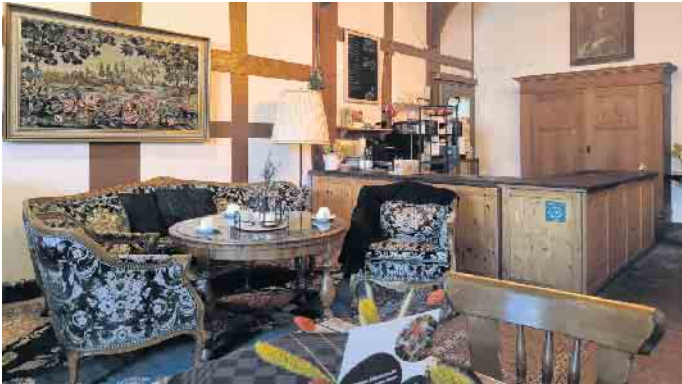
Historisches Kleinod: Das Dielencaf  in einem alten Fachwerkgeb ude bietet nicht nur Schutz bei schlechtem Wetter, sondern auch viele spannende Details aus l ngst vergangenen Tagen zu entdecken.

Reise in die b uerliche Vergangenheit. Die originalgetreue Einrichtung verspr ht rustikalen Charme und in fast jeder Ecke l sst sich ein weiteres spannendes Detail entdecken. Ein historisches Kleinod, das f r interessierte Besucher auch ohne Fr hst cks- oder Kuchenhunger absolut sehenswert ist. Die  ffnungszeiten lauten: dienstags bis freitags 12 bis 17 Uhr f r Kaffee und Kuchen, mittwochs von 10 bis 17 Uhr f r Fr hst ck   la carte und am Wochenende von 9 bis 13 Uhr f hr Fr hst cksbuffet sowie von 13 bis 17 Uhr f r Kaffee und Kuchen.