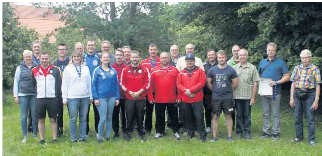
Teilnehmer des Vergleichsschießen

Der Durchmesser der Zehn beträgt hier 60 mm, der weitere Ringabstand 17 mm. Die Schei-