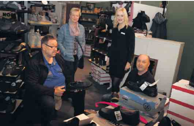
Mit von der Partie ist auch das Leverner Schuhhaus Culemann.

der Markt eine tolle Gelegenheit, lokale Gewerbetreibende kennen zu lernen und mit ihnen ins Gespräch zu kommen. Neben dem Markttreiben erwartet die Gäste ein buntes Rahmenprogramm. Das startet am Samstagabend mit einem Abendprogramm. Der Sonntag startet mit einem Zeltgottesdienst und dem Familientag mit Hüpfburg, Spielmobil, Rundfahrten durch den Ort und vieles mehr. Seit kurzem gibt es bei Instagram regelmäßig neue Infos zum Leverner Markt.