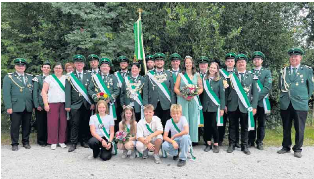
Am Wochenende standen in Varlheide alle Zeichen auf grün-weiß: die neuen Majestäten präsentierten sich dem Schützenvolk.

Für Musik und Tanz sorgten an den drei Schützenfesttagen die Spielmannszüge Varlheide und der Schützengilde Varl sowie das Jugendblasorchester Rothenuffeln. Für einen bebenden Tanzboden im Festzelt war DJ Jan Brosius verantwortlich.