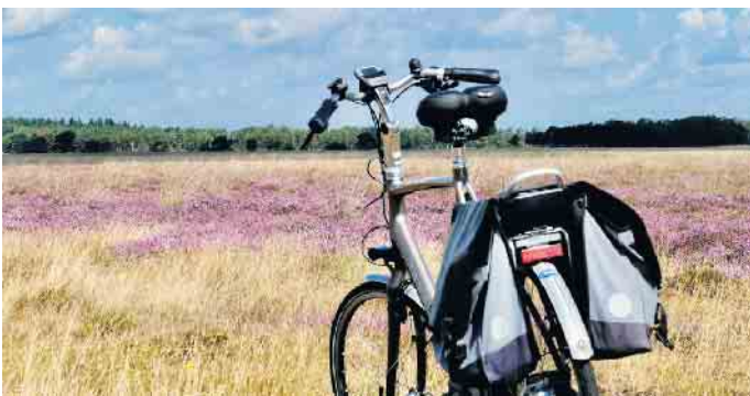
Das Fahrrad bleibt im Mühlenkreis ein beliebtes Fortbewegungsmittel (Symbolbild).

Der Kreis Minden-Lübbecke belegt derzeit mit 4,52 Kilometern pro Kopf Rang 32 in Deutschland und Platz 11 in Nordrhein-Westfalen in der Kategorie 100.000 bis 500.000 Einwohner. Zum Vergleich: Im Vorjahr lag der Wert im Mühlenkreis noch bei 3,92 Kilometern pro Kopf. Insgesamt nehmen im Jahr 2025 mehr als 3.000 Landkreise, Städte und Gemeinden aus ganz Deutschland an der weltweit größten Fahrradkampagne teil. Ein besonderes Highlight in diesem Jahr war die erstmalige STADTRADELN-Rallye: An 30 spannenden Orten im Kreisgebiet konnten Radelnde Stempel sammeln - ganz nebenbei lernten sie so neue Ecken des Mühlenkreises kennen. Für jeweils fünf eingereichte Stempel gab es ein Los für die Verlosung am Ende der Aktion.