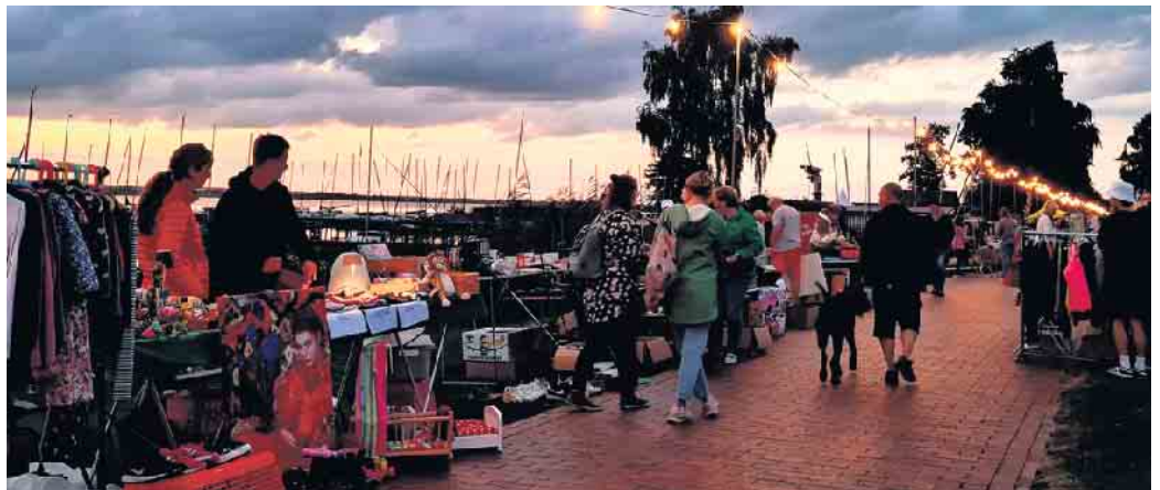
Der beleuchtete Dümmer Deich in Hude verwandelt sich am Samstag, 16. August, von 18 bis 22:30 Uhr in ein Paradies für Schnäppchenjäger und Trödelfans.

Hude. Der beleuchtete Dümmer Deich in Hude verwandelt sich am Samstag, 16. August, von 18 bis 22:30 Uhr in ein Paradies für Schnäppchenjäger und Trödelfans. Traditionell eine Woche vor dem beliebten Event „Der Dümmer brennt“ lädt der Abend-Flohmarkt zum Stöbern und Handeln ein. In gemütlicher Abendstimmung, im Schein der Lichterketten, bieten ausschließlich private Verkäufer eine bunte Vielfalt an Produkten an. Von Spielzeug über Haushaltswaren bis hin zu Kleidung, Wassersportausrüstung, Büchern usw. - hier ist für jeden etwas dabei. Unser Tipp: Bringen Sie eine Taschenlampe mit, um auch die verstecktesten Schätze zu entdecken. Die Teilnahmegebühr für private Stände beträgt fünf Euro. Gewerbliche Händler sind von der Teilnahme ausgeschlossen. Interessierte Verkäufer können sich noch anmelden. Bitte beachten Sie, dass die Standplätze nicht mit dem PKW angefahren werden können, sodass die Ware entsprechend transportiert werden muss. Für Standanmeldungen und weitere Informationen wenden Sie