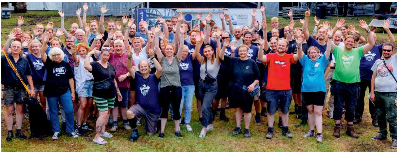
Ein Teil der 350 ehrenamtlichen Helfer

Steweder Open Air Festival wird von mehr als 350 ehrenamtlichen Helfern getragen