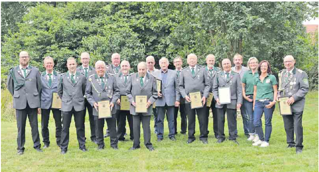
Langjährige Vereinsmitglieder erhielten Anstecknadeln und Urkunden.