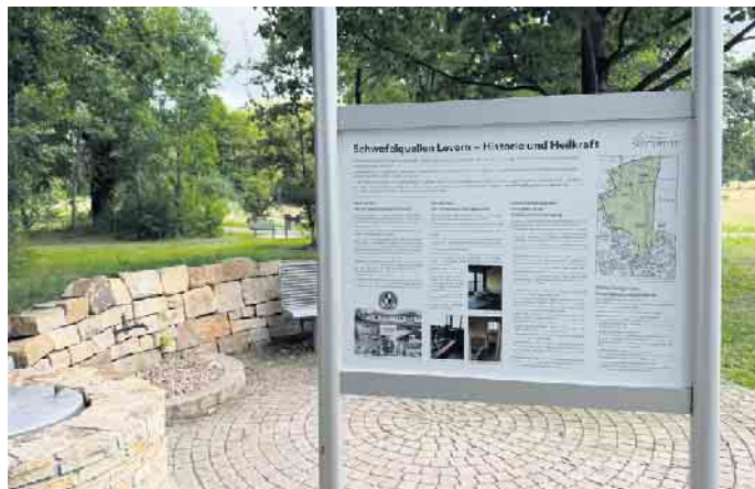
Info-Stelen informieren im Kurpark über Leverns Schwefelquellen.

Ehrenamt unterfüttert, die Anerkennung zum Luftkurort gelingen kann“, sagte Bölling. Es sei der Kurpark mit seiner imposanten Badeallee, im zurückliegenden Jahr neu eröffnet, es sei die Luftqualität und das Bio-Klima, vom Deutschen Wetterdienst bescheinigt, die ärztliche Versorgung und mit „Rila erleben“ habe man ein touristisches Highlight vor Ort. Aber auch das historische Ortsbild mit seinem Fachwerkensemble und der Stiftskirche habe dazu beigetragen, dass Levern die