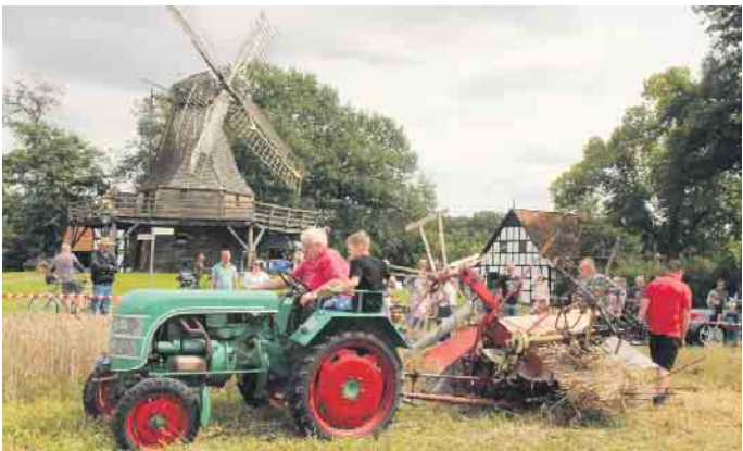
Das malerische Mühlengelände in Lavern sorgt mit vielen Aktionen für Kurzweil im Luftkurort.