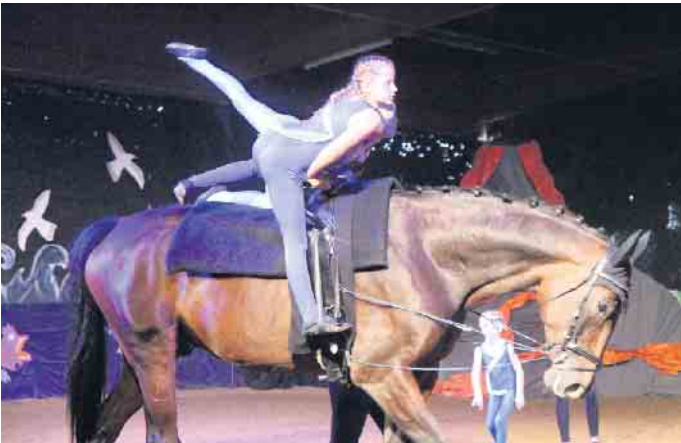
Im halsbrecherischen Tempo zeigten die Akteure akrobatische Turnübungen auf dem Pferderücken.

Ferienworkshop beim Reit- und Fahrverein Wehdem-Oppendorf