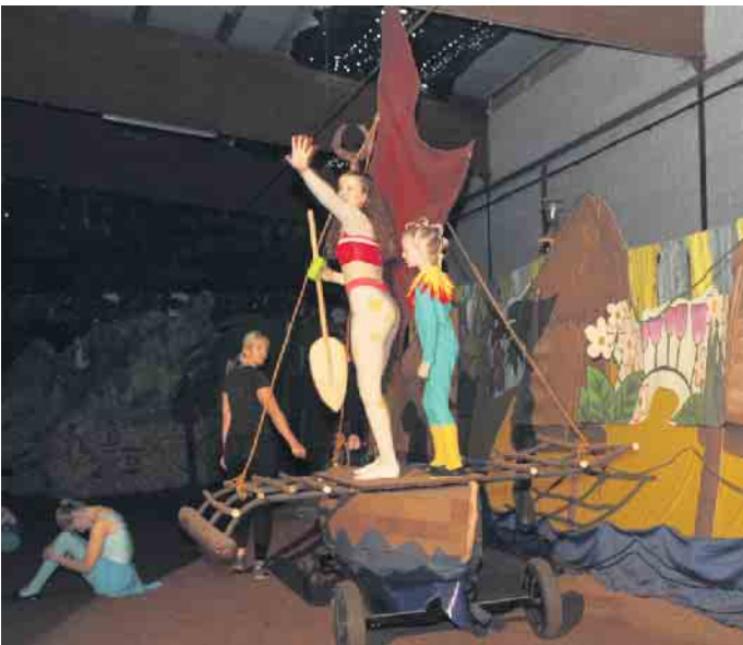
Vaiana schippert auf das weite Meer hinaus.

Pferderücken ihre Turnübungen zeigten. Entsprechend frenetisch war der Applaus am Ende. „Alle Akteure haben die ganze Woche toll mitgearbeitet“, sagt die Trainerin stolz. „Nicht vergessen werden dürfen die vielen helfenden Hände im Hintergrund zum Auf- und Abbau, für den Getränkeverkauf und vieles mehr“, so Antje Döhnert. „Ohne die ist ein derartiges Projekt nicht möglich.“