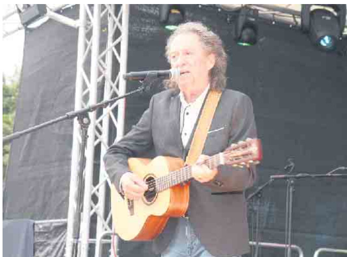
Chris Andrews, ein Weltstar, war auch nach Levern gekommen, um dort für gute Laune zu sorgen.

Von Anfang an herrschte ausgelassene Stimmung als die Bühne von den Klängen der unvergesslichen Schlagerhits der zurückliegenden Jahre erfüllt wurde. Das Publikum sang und tanzte begeistert zu den bekannten Melodien und die Stars auf der Bühne ließen es auf dem Gelände des E-Centers Levern so richtig krachen