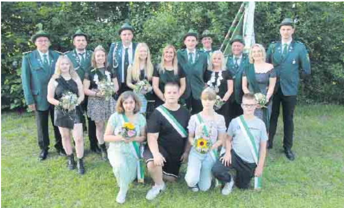
Die neuen Majestäten im Drohner Schützenverein und Verantwortliche präsentierten sich dem jubelnden Schützenvolk.