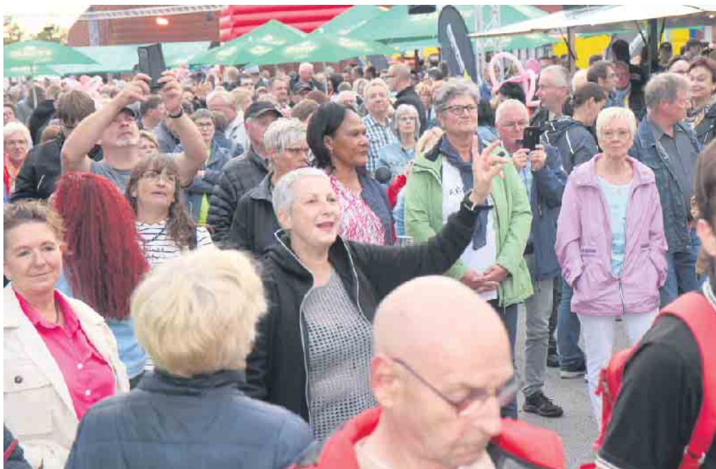
Rund 1.500 Gäste feierten ausgelassen bei der Schlagerparty am E-Center in Levern.