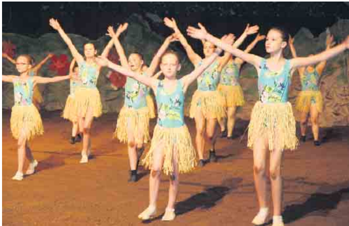
Mit viel Einfallsreichtum wurde den Zuschauern eine abwechslungsreiche Show geboten.