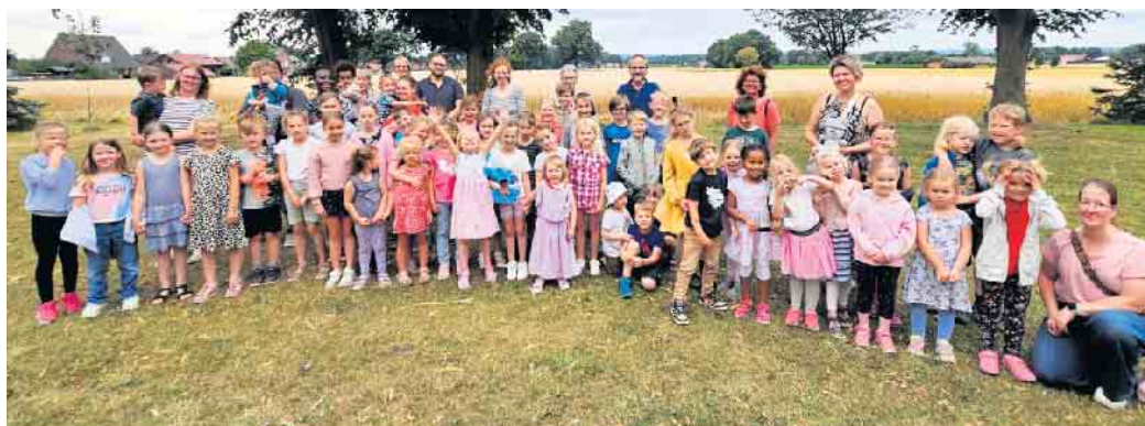
Die große Besucherschar

noch ordentlich getobt, und die Kinder versprochen, dass sie bei der nächsten Kinderkirche sicher wieder dabei sein werden. Diese findet statt als großes