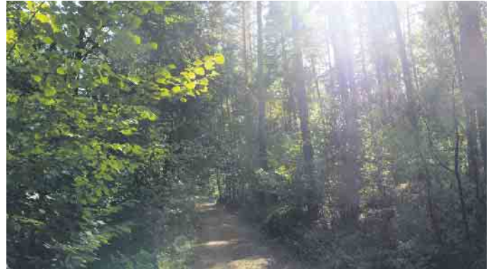
Ein Wanderweg im Stemweder Berg (Symbolbild).

Die Teilnahme ist kostenfrei erfolgt auf eigene Gefahr! Eine Anmeldung ist bis zum 24. Juli beim Ambulanten Hospizdienst Lemförde, 05443/997093 oder info@hospiz-lemfoerde.de , erforderlich.