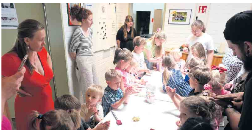
Richtig Andrang bei der Goldtaler-Produktion