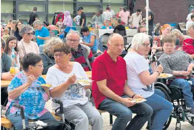
Das Vielfaltsfest am Wehdemer Life House brachte Menschen aller Generationen und Kulturen zusammen.

Vielfaltsfest am Life House lockt mit bunter Unterhaltung für alle Generationen