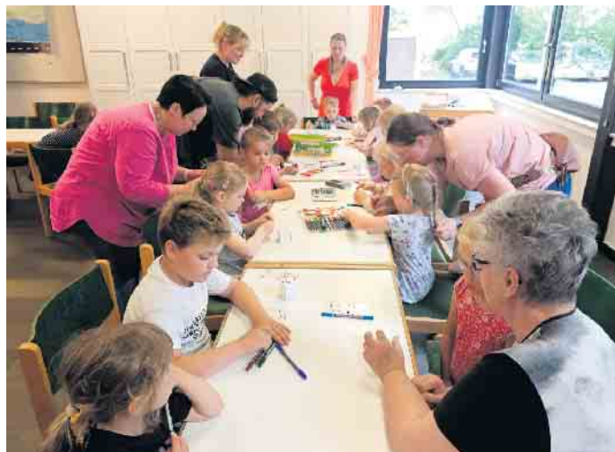
Volle Konzentration beim Basteln

Zum Abschluss wurde auf dem Außen- gelände des Gemeindezentrums