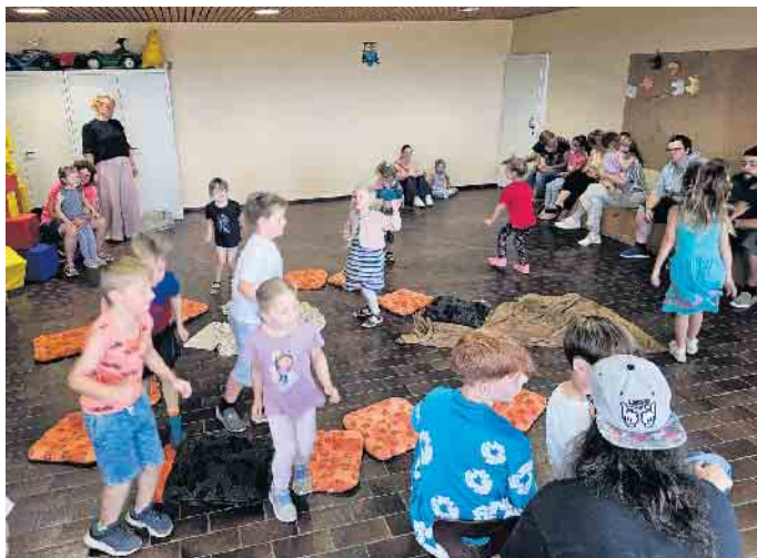
Im Keller ist richtig was los