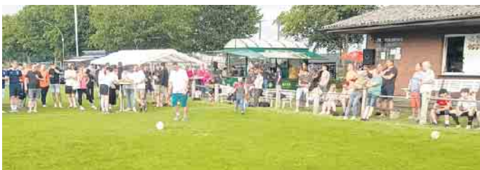
Schnappschuss vom TSV-Dorfabend