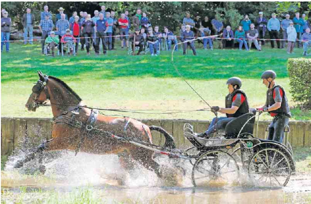
Das Fahrturnier-Event in Drohne, das auch als Qualifikationsrunde für das Bundeschampionat der Fahrpferde dient, verspricht ein Wochenende voller Rasananz und Präzision.

Drohne. Drei Tage im Rausch der Pferdestärken: das Fahrturnier in Stemwede-Drohne. Vom 12. bis 14. Juli verwandelt sich Stemwede-Drohne in das Herzstück des Fahrsports, wenn die besten Ein- und Zweispännerfahrer aus ganz Deutschland zur Westfälischen Meisterschaft zusammenkommen. Dieses prestigeträchtige Event, das auch als Qualifikationsrunde für das Bundeschampionat der Fahrpferde dient, verspricht ein Wochenende voller Rasananz und Präzision. Nachdem die letzten acht Jahre eher kleinere Veranstaltungen den Kalender bestimmten, hat sich der Fahrclub Zwölf Eichen in diesem Jahr entschlossen, ein Großereignis zu organisieren. Ein besonderer Fokus liegt auf den anspruchsvollen Geländeprüfungen am Sonntag. Diese Disziplin, bei der fünf feste Hindernisse in rasantem Tempo gemeistert werden müssen, gilt als Höhepunkt des Turniers und verspricht, zahlreiche Zuschauer in ihren Bann zu ziehen. Die Teilnahme von 107 Gespannen, eine Rekordzahl für Fahrturniere, unterstreicht die Bedeutung der Veranstaltung. Unter den Teilnehmern befinden sich nicht nur aktuelle Weltmeister und Bundeschampions, sondern auch viele erfahrene Landesmeister und Mitglieder des Bundeskaders.