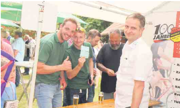
Viele fleißige ehrenamtliche Helfer waren im Einsatz, um wie hier, die unzähligen Preise zu überreichen.