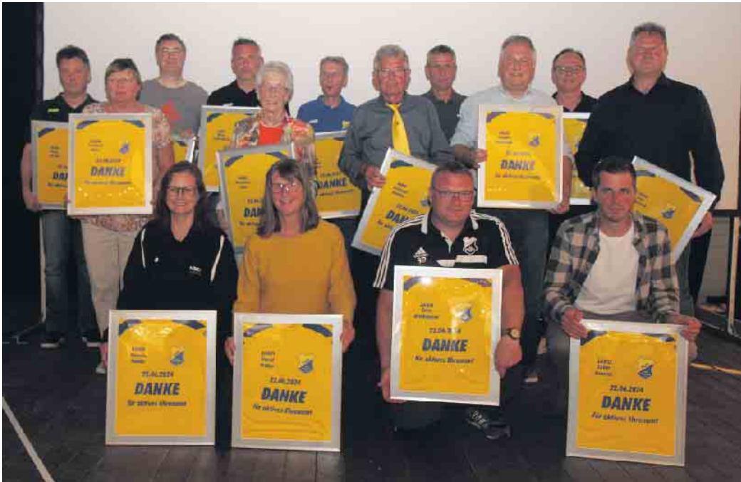
Ein großes Dankeschön haben sich die Ehrenamtlichen im TuS Dielingen verdient.