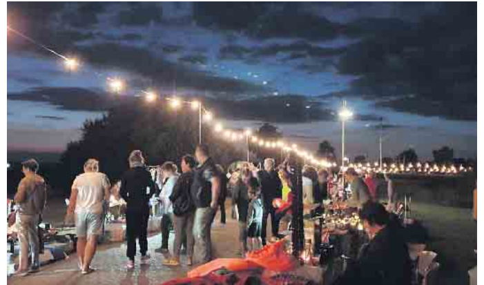
Der beleuchtete Abendflohmarkt am Dümmerdeich in Lembruch ist für den 17. August geplant.

Hier werden Kinder zu kleinen Zirkusartisten. Die Teilnehmer im Alter von 6 bis 12 Jahren können