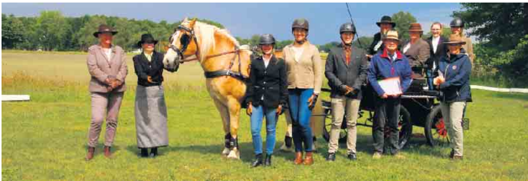
Prüfung 2. Kurs 2024, FA5 und Pferdeführerschein Umgang