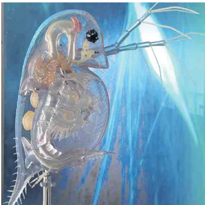
Faszination Plankton - im Dümmer-Museum gibt es viel Spannendes zu erleben und zu entdecken.

Spannende Workshops für Kinder im Alter von 7 bis 12 Jahren