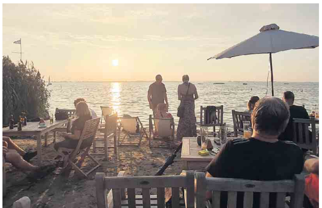
An der Bar dü Mar in Hüde lässt sich bekanntlich „der schönste Sonnenuntergang in ganz Niedersachsen“ erleben.