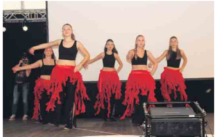
Die Tanzgruppe sorgte mit ihrem Auftritt für beste Unterhaltung.