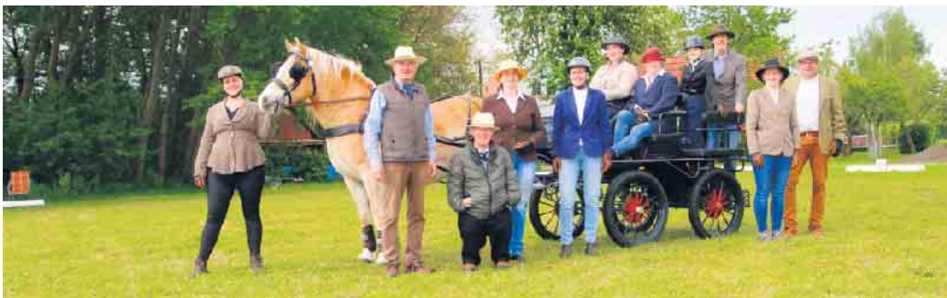
Prüfung 1. Kurs 2024, FA5 und Pferdeführerschein Umgang

Geprüft wurde 1 Pferdeführerschein Umgang und 8 FA5 mit Kutschenführerschein A. Bestanden hat den Pferdeführerschein