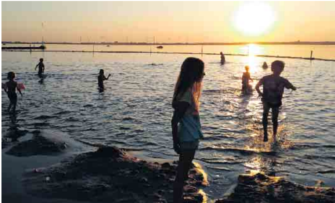
Spielen am Strand und im Wasser - immer wieder ein Highlight für die Kinder.

Auszeit am Wasser: Direkt „vor der Haustür“ am Dümmer See können große wie kleine Gäste Urlaubsfeeling pur erleben