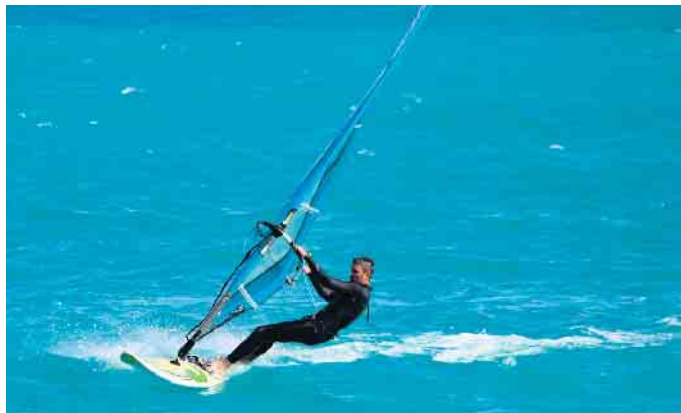
Der Dümmer See ist für seine vielen verschiedenen Wassersportmöglichkeiten, wie zum Beispiel Windsurfing, bekannt und beliebt. (Symbolfoto)

An den Strandbars, in der Gastronomie und im Marissa Resort gibt es ganz unterschiedliche musikalische Events. z.B. das Abschiedshafenkonzert des Shanty-Chors Grawiede am 7. Juli bei Schlick. Am 24. August wird die komplette Strandgastronomie in Lembruch mit dem „Dümmer Leuchten“ Lembruch musikalisch und illuminiert „ins rechte Licht rücken“. Und vielerorts rund um den See finden traditionelle Schützenfeste statt. Das Marissa Resort lädt zu