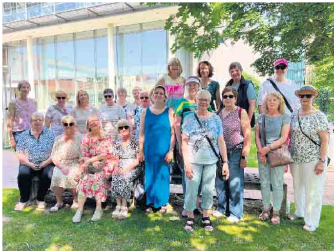
Die reiselustigen Landfrauen

Ein Tag in Vechta mit den Landfrauen aus Stemwede