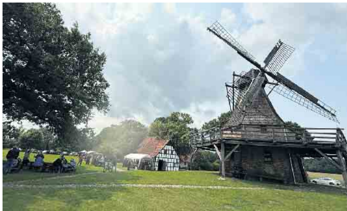
Zum Deutschen Mühlentag hatten in Stemwede die Windmühlen in Levern und Oppenwehe ihre Pforten geöffnet.

Deutschen Mühlentag öffneten viele Windmühlen ihre Pforten für Besucher, darunter auch die Mühle in Levern, mit Führungen, Vorführungen und einem bunten