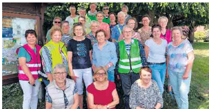
Die Landfrauen Sternwede starten an der Desteler Mühle

Programm stand die Besichtigung der Lübbecker Villen - eindrucksvolle, restaurierte Bauwerke, verwinkelte Gassen, umgeben von altem Baumbestand, üppigem Grün und blühenden Rosen. Ein besonders schöner Moment war der Blick in Richtung Sternwede - Vom höchsten Punkt der Stadt aus ließ sich in der Ferne der Sternweder Berg erkennen. Nach einem erfrischenden Getränk hieß es schließlich: aufsteigen, sammeln und die Heimfahrt antreten - mit vielen neuen Wissen im Gepäck.