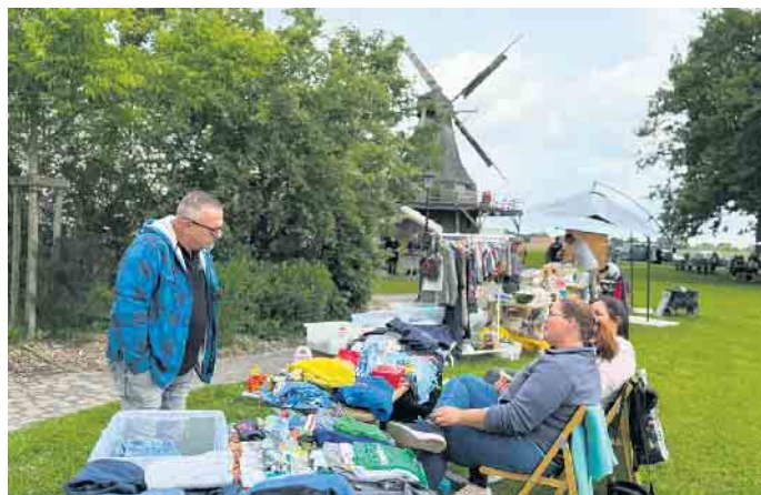
Ein Flohmarkt unter Mühlenflügeln lockte am Pfingstmontag zur Laverner Windmühle.