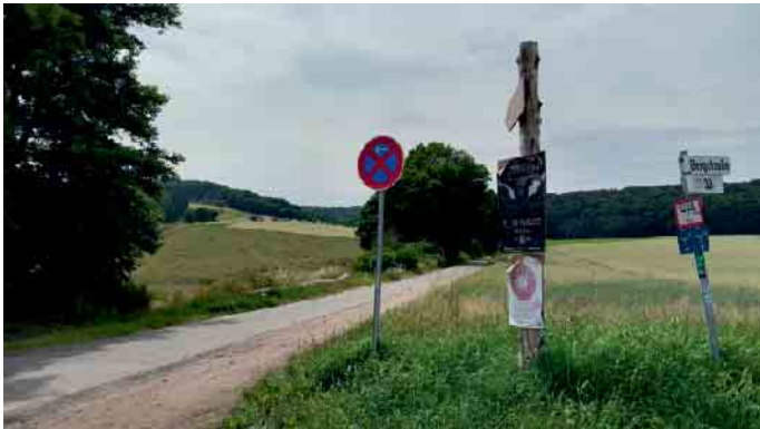
An der Bergstraße, einer Zufahrtsstraße zum Waldfrieden-Gelände in Wehdem, ist im Rahmen des „Wald Healing Festivals“ am Fronleichnamstag ein fünfjähriges Mädchen unter das Vorderrad eines Radladers geraten.

Healing-Festivals (...). Stewedes Bürgermeister Kai Abruszat (FDP) sagte dem WDR, es sei eine „unglaubliche Tragödie“. Die Entscheidung, das Festival weiter stattfinden zu lassen, habe der private Veranstalter in eigener Verantwortung gefällt - nach Rücksprache mit der Notfallseelsorge. Nach Angaben der Veranstalter solle das „in angepasster Form“ geschehen: mit Trauerveranstaltungen und Seelsorgern vor Ort. Für Bürgermeister Abruszat ist die Entscheidung „ein zweischneidiges Schwert“, er könne das aber akzeptieren und verstehen.