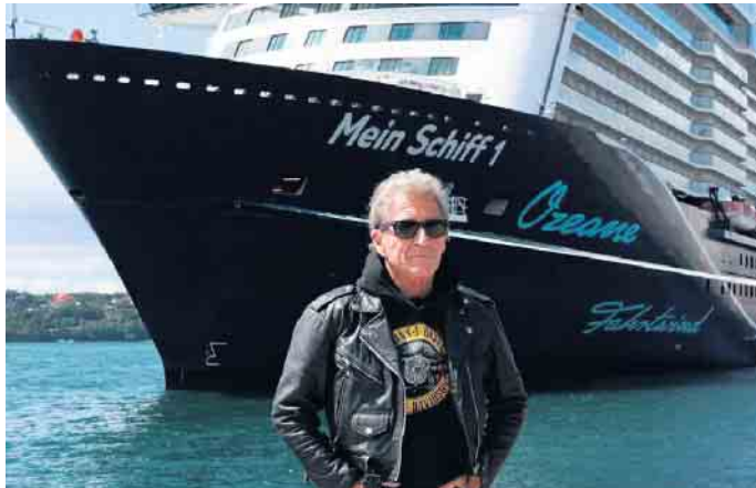
Peter Maffay gefiel die familiäre Atmosphäre an Bord.