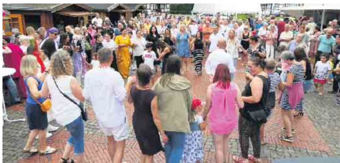
Der Verein KulturBUNT lädt auch in diesem Jahr für Samstag, 5. Juli, ab 15 Uhr, zum Fest der Nationen am Amtshof Lemförde ein.

Fest der Nationen wird am 5. Juli am Amtshof in Lemförde gefeiert