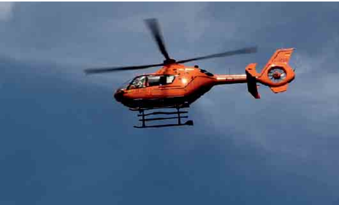
Ein Rettungshubschrauber brachte das kleine Mädchen mit schweren Kopfverletzungen ins Johannes Wesling Klinikum Minden. Foto: Symbolbild

Unfall auf dem Waldfrieden-Gelände in Wehdem: Kind wird von Radlader überfahren und erliegt schweren Verletzungen - Fahrer stand vermutlich unter Drogeneinfluss