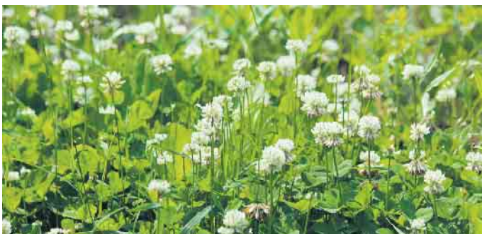
Eine Wiese voll Glück: Weißklee (Trifolium repens) wirkt krampflösend und verdauungsfördernd.

dann weiter zum Gipfel stieg saß dort ein großer, mächtiger Adler und hustete und würgte. „Sei gegrüßt, König der Lüfte, Ihr seht krank aus.“ - „Ach kleine Hexe, mein Frühstück ist mir nicht bekommen, es war ganz kratzig und muffig und nun hab ich Pusteln im Schnabel und Ausschlag unter den Federn. Hast du nicht etwas in deiner Tasche was mir helfen könnte?“ - „Dies Kraut hab ich dabei, wenn du es willst dann gebe ich dir davon!“ Und so hielt sie dem Adler die Blüten hin. „Was für ein Glück, dass du den Steinklee (Melilotus) bei dir hast, wo er doch ideal als Aufguss bei irritierter und entzündeter Schleimhaut eingesetzt werden kann. Äußerlich wirkt er bei gereizter, geröteter und entzündeter Haut juckreizmildernd und aufbauend. Ich danke dir von ganzem Herzen kleine Hexe und will dir einen Rat geben. Schau hinab ins Tal zu deinem kleinen Häuschen am See, wie es da ganz friedlich im Licht der Sonne funkelt. So schön hast du es dort mit deinem Gemüse und Kräutergarten und den Feen, Zwergen, Kobolden und Trolle, die bei dir herum toben. Das was du suchst, meine Liebe, liegt immerzu direkt vor deinen Füßen, du musst nur anhalten und es aufheben.“ Mit diesen Worten schwang er sich in die Lüfte und verschwand in den Wolken. Froh, dem Adler geholfen zu haben genoss die kleine Hexe die Aussicht noch eine Weile und ging dann fröhlich, mit der Tasche voll Glück, nach Hause!