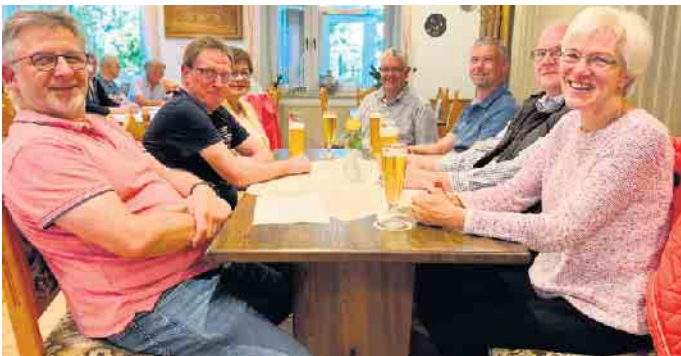
Die letzte Jahreshauptversammlung hatte erst im Herbst stattgefunden. Durch die „Coronazeit“ war der Termin, der eigentlich im Frühjahr stattfindet, im Kalender nach hinten gerutscht.