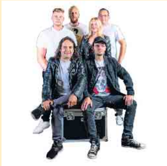
Erstmalig ist die Band „Certain Souls“ in Hollweide dabei. Ihr Motto lautet: „Wo wir auftauchen, geht die Post ab!“

Vehlage, Oppenwehe, Westrup und Drohne erwartet. „DJ Gerdi“ legt dann zur Schützenparty auf und er wird das Zelt sicherlich in Feierlaune bringen. Der Eintritt am Samstag ist frei. Am Sonntag werden dann die Majestäten für das neue Schützenjahr ermittelt. Vorher tritt der Verein aber um 13 Uhr bei Piel an um den Hofstaat vom Festplatz abzuholen. Gleichzeitig beginnt dann auch das Kinderschützenfest auf dem Festplatz mit dem anschließenden Kinderkönigsschießen. Parallel dazu findet auch ein