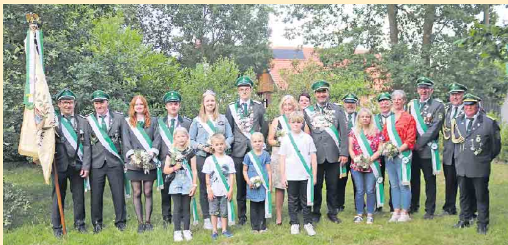
Der aktuelle Hofstaat des Schützenvereins Hollweide. Wer die amtierenden Majestäten ablösen wird, das entscheidet sich beim Adlerschießen am Sonntag.

Ab 20 Uhr werden als Gastvereine der Schützenverein Sielhorst, die Schützengilde Varl, der Schützenverein Wehden, die Jungschützen aus Lavern, die Desteler Mühlenschützen und eine Abordnung der Jägerschaft Lübbecke Hegeringe im Festzelt erwartet. Das Festzelt wird wieder von Getränken Eigenbrodt bewirtet und von den Schützengilden liebevoll dekoriert sein und zum Verweilen einladen. U.a. wird die in den letzten