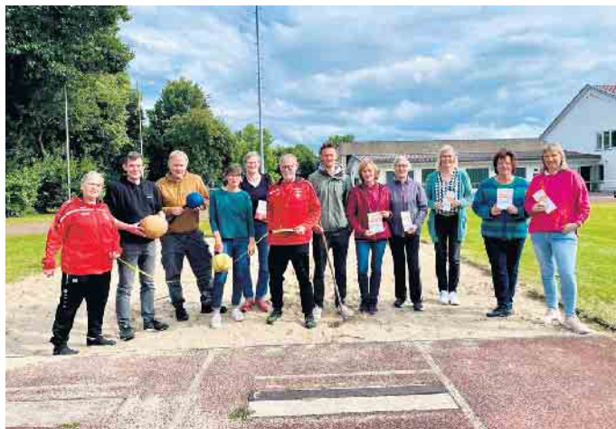
Bringen Stemwede gemeinsam in Bewegung: die Sportabzeichenprüferinnen und -prüfer der Stemweder Schulen und Vereine.

Im vergangenen Jahr wurden in Stemwede insgesamt 337 Sportabzeichen abgelegt. Mit den nun ausgerufenen 500 Sportabzeichen wird die Messlatte gleich ein ganzes Stück höher gelegt. In jedem Fall ein ehrgeiziges Ziel, vor allem aber eine Motivation, noch mehr potentielle Kandidatinnen und Kandidaten anzusprechen - Firmen, Betriebs-sportgruppen, Mannschaften, Nachbarschaften oder Cliquen. „Das Sportabzeichen richtet sich an alle. Egal ob alt oder jung, Hobby- oder Leistungssportler, mit oder ohne Behinderung“, erklären die Prüferinnen und Prüfer aus den Vereinen sowie die der Lehrerinnen und Lehrer der Stemweder Schulen. Konkret geht es beim Deutschen