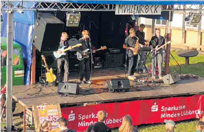
Die Band „Von Jacobi“ aus Dresden begeisterte mit rockigen Klängen.

Kleines Musikfestival auf dem Mühlengelände in Levern lockt viele Besucher