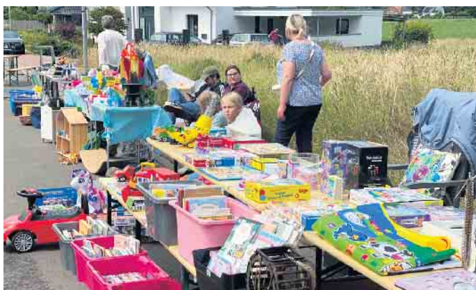
Beim Straßenflohmarkt in Lavern gab es viel zu entdecken.

Familiäre Atmosphäre und viel zu entdecken