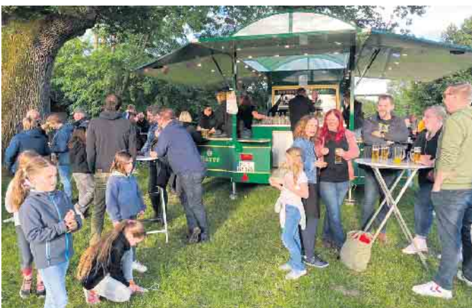
Schon am frühen Abend war das Gelände um die Leverner Mühle gut gefüllt mit bestgelaunten Besuchern