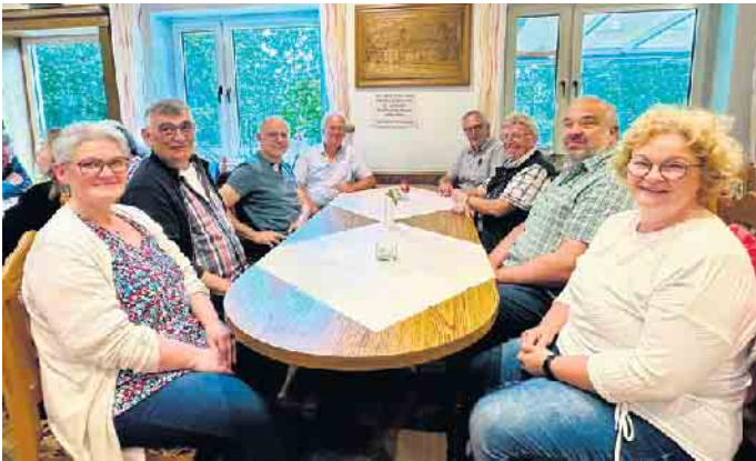
Die gut besuchte Jahreshauptversammlung des Vereines fand in diesem Jahr im Moorhof in Oppenwehe statt.