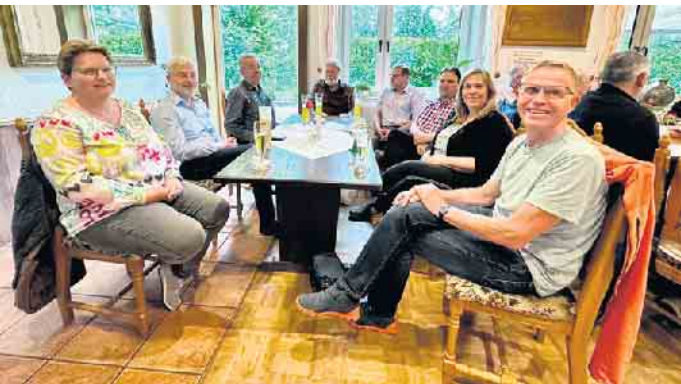
Die Mitglieder waren zur Jahreshauptversammlung und im Anschluss zu einem „Schnitzessen“ mit „Netzwerken“ eingeladen.