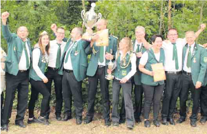
Der Arrenkamper Schützenverein holte den Supercup beim Stewwederberg-Verbandsfest.

Beste Stimmung beim Stewwederberg-Verbandsfest in Stewshorn