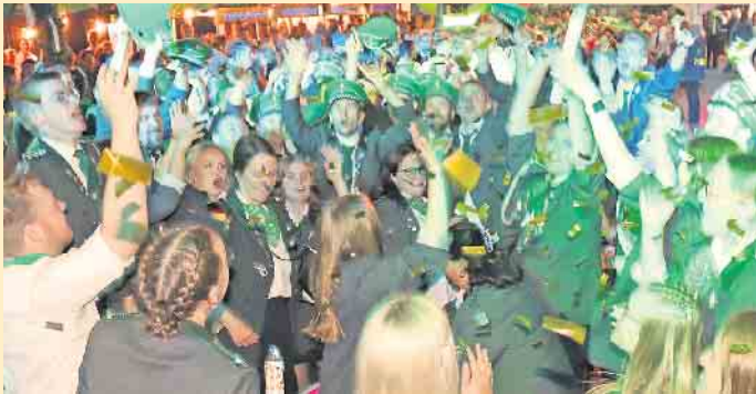
Beim dreitägigen Sommerfest der Hollweder Schützen wird sicher auch in diesem Jahr wieder ausgiebig gefeiert werden.

Vehlage, Oppenwehe, Westrup und Drohne erwartet. „DJ Gerdi“ legt dann zur Schützenparty auf und er wird das Zelt sicherlich in Feierlaune bringen. Der Eintritt am Samstag ist frei. Am Sonntag werden dann die Majestäten für das neue Schützenjahr ermittelt. Vorher tritt der Verein aber um 13 Uhr bei Piel an um den Hofstaat vom Festplatz abzuholen. Gleichzeitig beginnt dann auch das Kinderschützenfest auf dem Festplatz mit dem anschließenden Kinderkönigsschießen. Parallel dazu findet auch ein