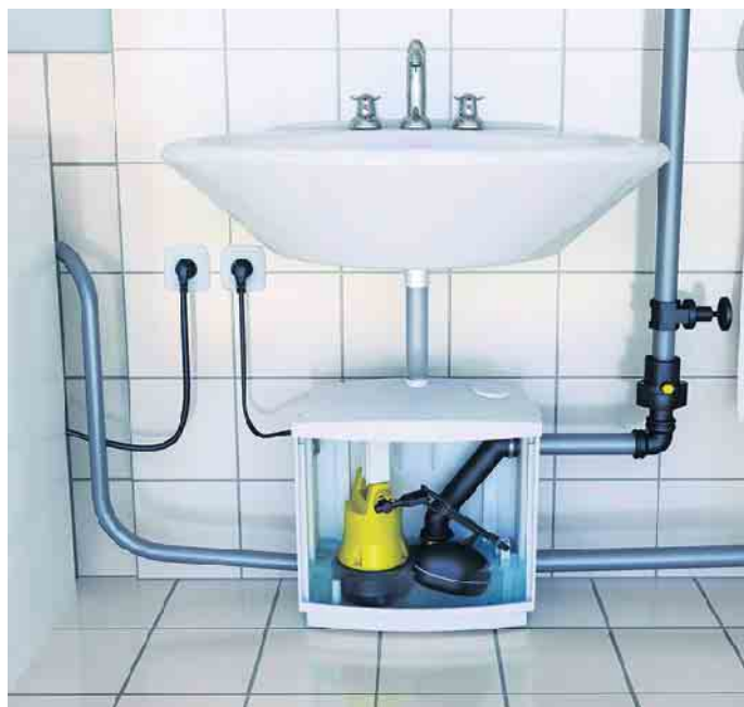
Die Kleinhebeanlage sammelt das Schmutzwasser aus Waschmaschine, Waschbecken und Dusche und pumpt es in das nächste Abwasserrohr. Richtig installiert, schützt sie auch gegen Rückstau.

hersteller wie beispielsweise Jung Pumpen einen deutschlandweiten Werkskundendienst und eine langfristige Ersatzteilversorgung. (trd/akz-o)