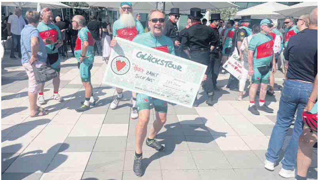
Kassensturz am Ziel in Bonn: Etwa 290.000 Euro wurden in diesem Jahr für den Verein „Schornsteinfeger helfen krebs- und schwersterkrankten Kindern“ auf der Glückstour gespendet.