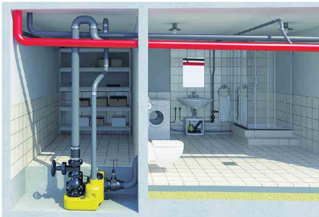
Die Hebeanlagen fördern Abwasser aus dem Keller in den Kanal und sorgen gleichzeitig für Schutz gegen Rückstau.

Dazu wird die Druckleitung, über die das Abwasser aus der Hebeanlage gepumpt wird, mit einem sogenannten Rückstaubogen über die Rückstauenebene (Höhe der Straßenoberkante) geführt. Nur so ist die Hebeanlage fachlich richtig installiert und sorgt dafür, dass kein Abwasser aus dem Kanal zurück in den Keller drücken kann. Setzt man als Eigenheimbesitzer*in auf Markenprodukte und lässt diese vom Profi einbauen, hat man nicht nur die Gewährleistung auf das Gerät selbst, sondern auch auf die gesamte erbrachte Leistung, die Installateure auf Grundlage relevanter Normen durchführen.