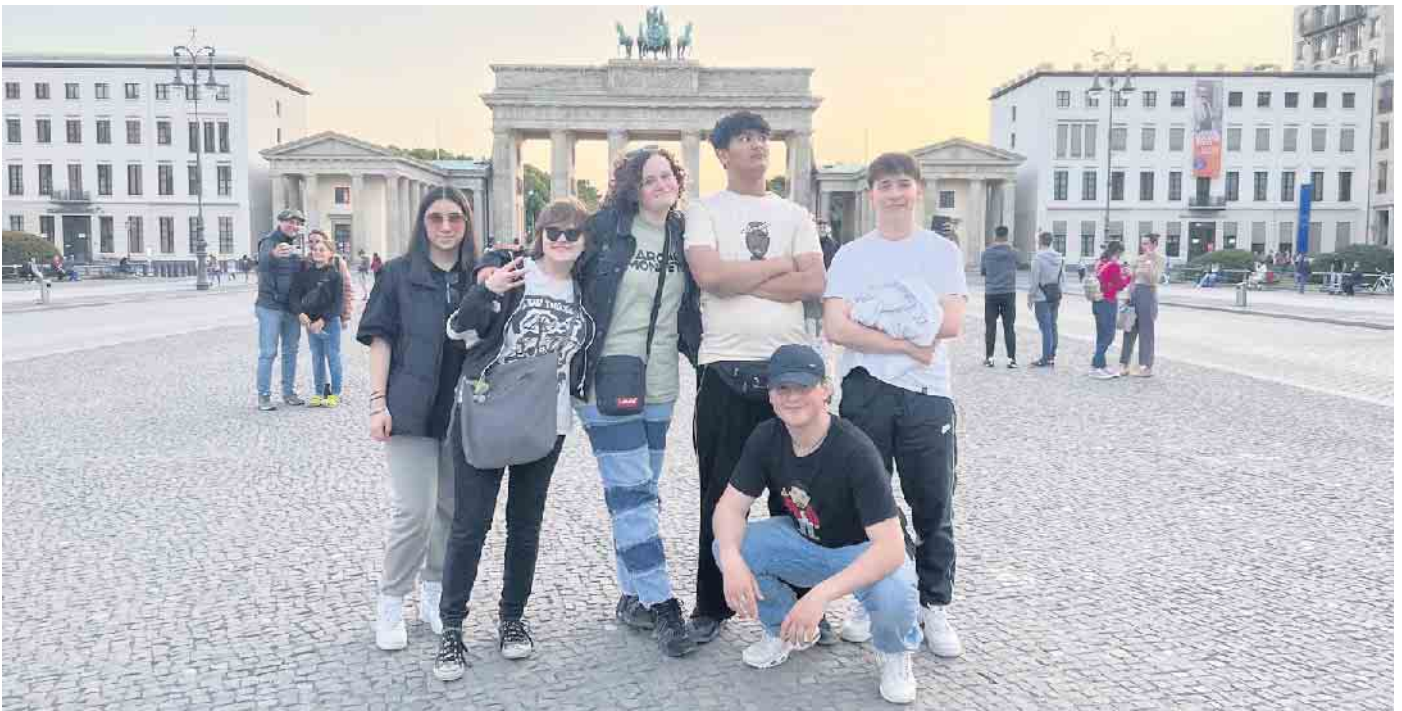
Die Stemweder Schüler vor dem Brandenburger Tor