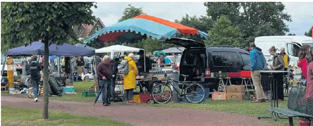
Trotz des schlechten Wetters kamen zahlreiche Schnäppchenjäger zum Flohmarkt der SPD in den Bürgerpark nach Lemförde.

Lemförde (hm). Nasse Tische, bunte Schirme und tapfere Händler: Es ist schon ein Risiko gewesen, am Pfingstsonntag einen Marktstand ohne Pavillon auf dem Lemförder Flohmarkt aufzubauen oder ohne Schirm über den Trödelmarkt zu bummeln. Aber Plänen zum Abdecken, wenn der nächste Schauer sich ankündigte, lagen stets griffbereit. Trotz des miserablen Wetters hielten viele Standbetreiber und Besucher durch, ausgerüstet mit Regenjacken und unerschütterlicher Flohmarktfreude. „Klar, das Wetter hätte besser sein können“, sagte eine Standbetreiberin, die jedes Jahr mit einem Stand für Kinderkleidung dabei ist. Mit Thermoskanne und Gummistiefeln bewaffnet, blieb sie standhaft bei dem beliebten Flohmarkt, den die SPD alljährlich am Pfingstson-