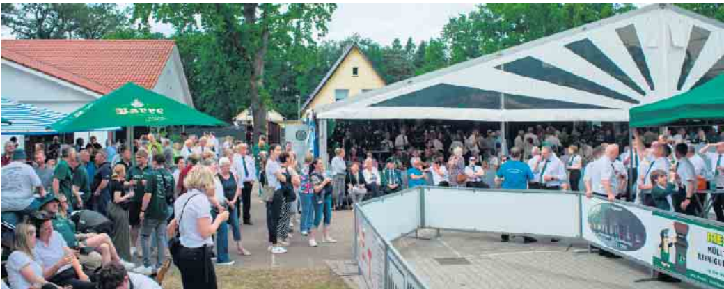
Das Publikum des Adlerschießens verfolgt das zähe Ringen mit dem Holz des Adlers.