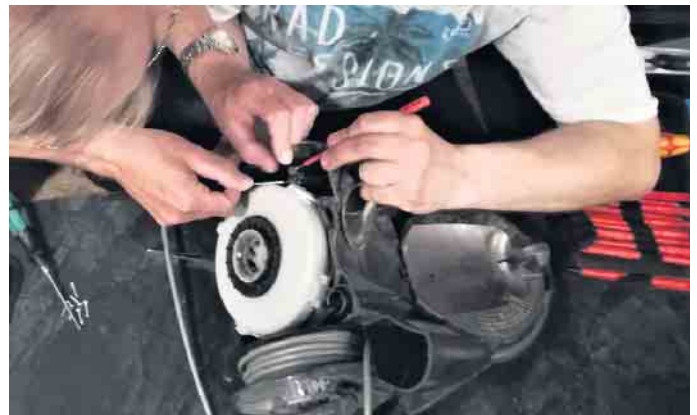
Reparatur Café Stewwede

Problemen und bei vor Ort durchführbaren Fahrrad-Reparaturen. Gemeinsam werden defekte Alltagsgegenstände repariert, es gibt sachkundige Beratung. Ansprechpartner für Interessierte ist Günter Kröger unter 0151-20415353 oder per E-Mail unter reparieren@jfk-stewwede.de .