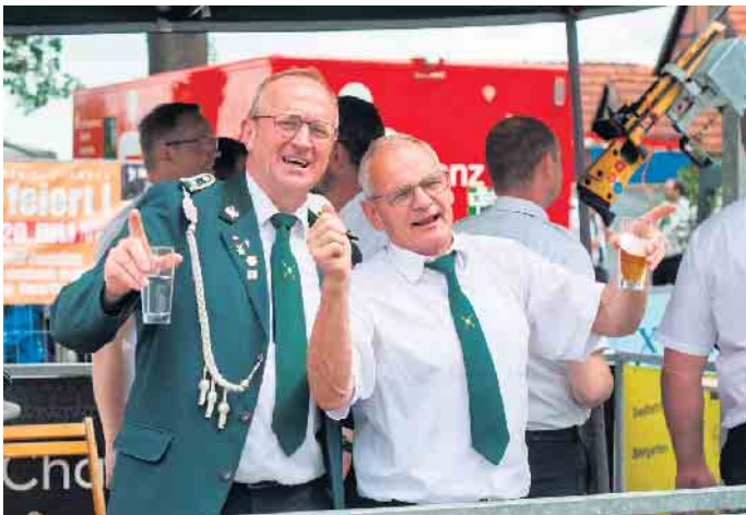
Die Schützen genießen ihr Königsschießen in Varl auch mal mit einem Glas Wasser.