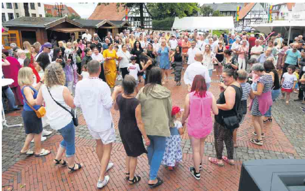
Der Verein KulturBUNT lädt auch in diesem Jahr für Samstag, 5. Juli, ab 15 Uhr zum Fest der Nationen am Amtshof Lemförde ein.

Eintritt frei, alle sind willkommen. Mehr Infos gibt es online unter: www.kulturbunt-lemfoerde.de