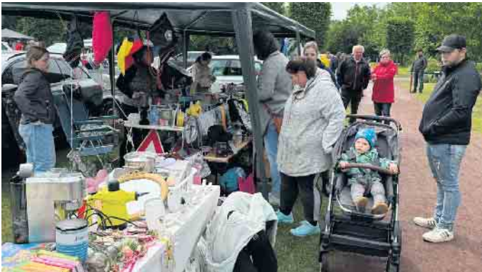
Trödel wechselte an den Ständen des Trödelmarktes rasch die Besitzer.