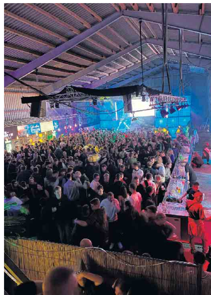
Die Revival GbR lädt wieder zur großen Summerparty auf Hof Aping in Westrup ein. Und zwar für Samstag, 21. Juni. Beginn ist um 20 Uhr.

Ü50 zahlt keinen Eintritt - neue Dorftheke mit Altbier und Spirituosen für Jung und Alt