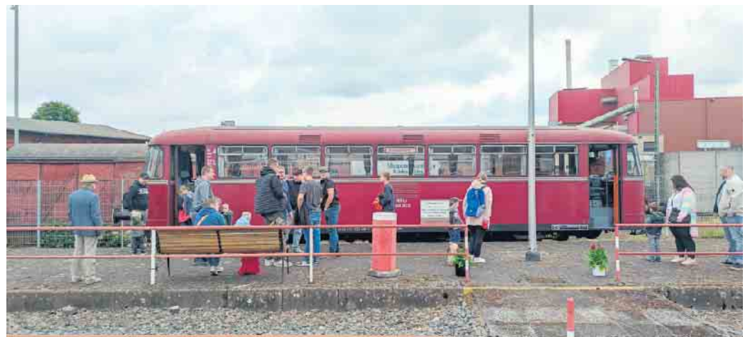
Noch ist es relativ ruhig am Bahnsteig, doch der Zug füllte sich rasch.

Die Kombination aus Fahrt mit der Museumsbahn und einem Ausflug zum Backtag am großen Stein in Tonnenheide wurde gut angenommen und von einigen Fahrgästen gerne genutzt. Der Heimatverein Tonnenheide hatte extra im Vorfeld den Fußweg vom Bahnhof Hahnenkamp Richtung großer Stein gemäht und