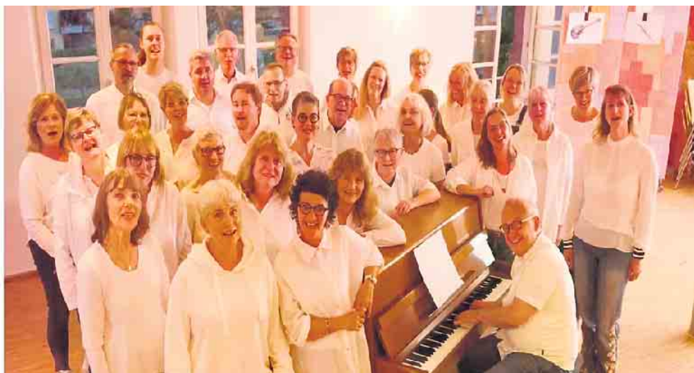
Am Samstag, 28. Juni, gastiert der Jazzchor Minden mit seinem aktuellen Programm „Summertime“ auf Einladung des Kulturvereins KulTür in der Ev. St. Johannis-Kirche in Rahden.

Der Eintritt kostet im Vorverkauf 20 Euro pro Person bzw. 15 Euro ermäßigt und an der Abendkasse 23 Euro bzw. 18 Euro pro Person.