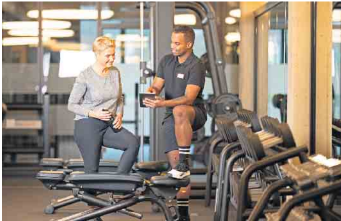
Wer trainiert, möchte dabei gut betreut sein: Fachkräften bieten sich in der Fitness- und Gesundheitsbranche sehr gute berufliche Perspektiven.