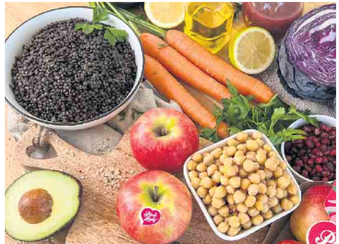
Knackige Äpfel, Belugalinsen, Rotkohl, Möhren, Avocado und Granatapfelkerne sind die Zutaten für die köstliche vegane Bowl.