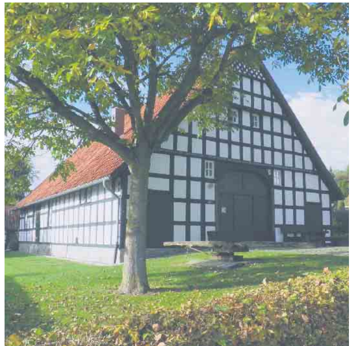
Heimathaus in Wehdem.

Das Heimathaus Wehdem öffnet am 11. Juni von 14.30 bis 18 Uhr. Anlässlich des 50. Geburtstages der Gemeinde Stemwede, widmet