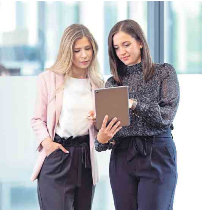
Fachkräfte der Fitness- und Gesundheitsbranche haben verschiedene Möglichkeiten, fundierte Kenntnisse und Fertigkeiten im Bereich Management zu erlangen.

Studium/Ausbildung: Gute Perspektiven in der Fitness- und Gesundheitsbranche