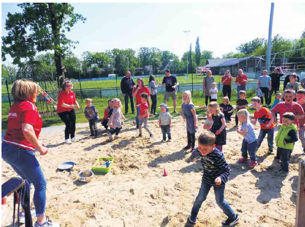
In welcher Form auch immer: Bewegung wird bei den Kids und Erzieherinnen der DRK-Kita Bullerbü in Rahden-Varl großgeschrieben.

stimmten Themen auf“, so die Einrichtungsleiterin.