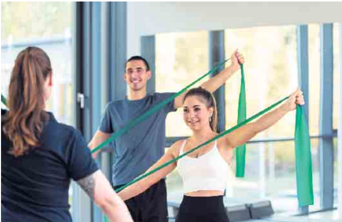
Ausbildungen und Studiengänge im Fitness- und Gesundheitsbereich eröffnen zahlreiche berufliche Möglichkeiten.

Gesundheit ist ein zentraler Wert in der Gesellschaft; während der Pandemie hat sich der hohe Stellenwert von Fitness- und Gesundheitstraining deutlich gezeigt. Nach den Beschränkungen der vergangenen Jahre kommen immer mehr bestehende und neue Mitglieder in die Anlagen, um von den positiven Effekten eines Trainings langfristig zu profitieren. Das illustrieren die kürzlich erhobenen „Eckdaten der deutschen Fitnesswirtschaft 2023“. Darüber hinaus haben Fachkräfte in der Zukunftsbranche attraktive berufliche Möglichkeiten.