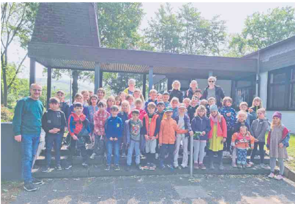
Die Gruppe vor dem Rückweg