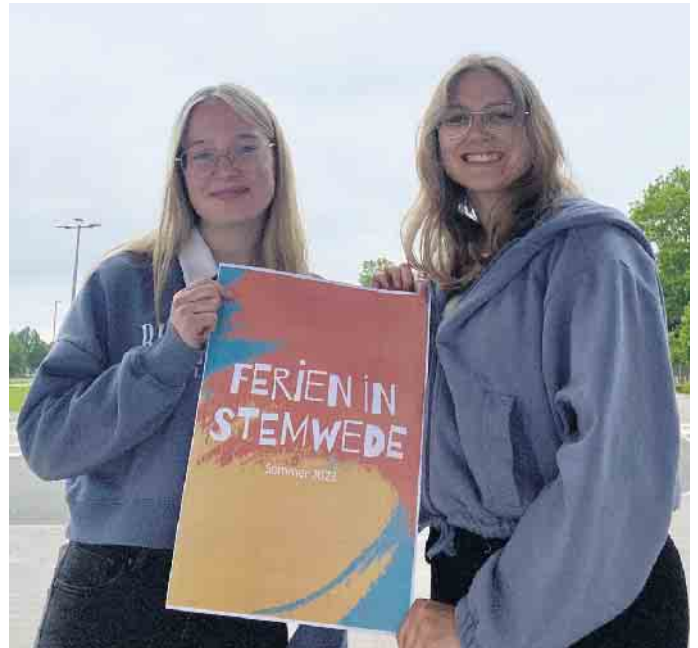
Zwei Helferinnen des Life Houses präsentieren das Plakat

Um Kräuter- und Blumenbeete geht es am 28. Juni. „Kochen wie die Großen“ und der Escape Room „SOS im Eis“ stehen am 29. Juni zur Auswahl. Am 3. Juli kann Theater oder aber Bauerngolf gespielt werden. Am nächsten Tag gehen „Teens auf Tour“, es öffnet die Weidenkunstwerkstatt, es entstehen bunte Dominosteine und es gibt ein Sommergrillen für Teens. Aus alten CDs entstehen am 5. Juli coole Kreisel. Der Tierpark Olderdissen ist am 6. Juli Ziel einer Fahrt oder die Kinder können am Schnuppertennis teil-