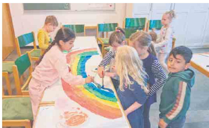
Der Regenbogen nimmt Gestalt an

Zeit für ein ordentliches Frühstück und für das Kennenlernen der verschiedenen Fische im großen Aquarium des Gemeindezentrums in Haldem. Ein Erinnerungsfoto durfte natürlich nicht fehlen, bevor die Kinder in Zweierpaaren und in langer Reihe ihren Fußweg zurück zur Schule antraten. Als nächste kirchliche Angebote warten der Schulabschlussgottesdienst vor Beginn der Ferien und der Gottesdienst zur Einschulung auf Lehrerinnen, Kinder und deren Eltern.