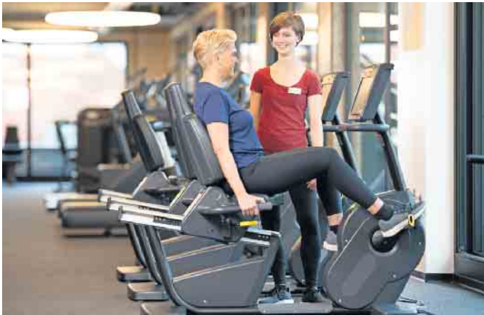
In der Zeit der Pandemie ist die Bedeutung von Fitness- und Gesundheitsanlagen im Bewusstsein von Gesellschaft und Politik gewachsen.

Fitness, Sport und Informatik an. Zudem können sich Interessierte in Lehrgängen der BSA-Akademie nebenberuflich im Zukunftsmarkt Prävention, Fitness und Gesundheit qualifizieren und weiterbilden. Mehr Infos zu beiden Qualifizierungsmöglichkeiten gibt es unter www.dhfp-g-bsa.de . Nachholbedarf in Fitness- und Gesundheitsbranche: Fachkräfte sind gefragt „Der Nachholbedarf an Fitness- und Gesundheitsdienstleistungen ist enorm und die positiven Effekte zeichnen sich bereits im Markt ab. Entsprechend ist die Branche mehr denn je gefordert,