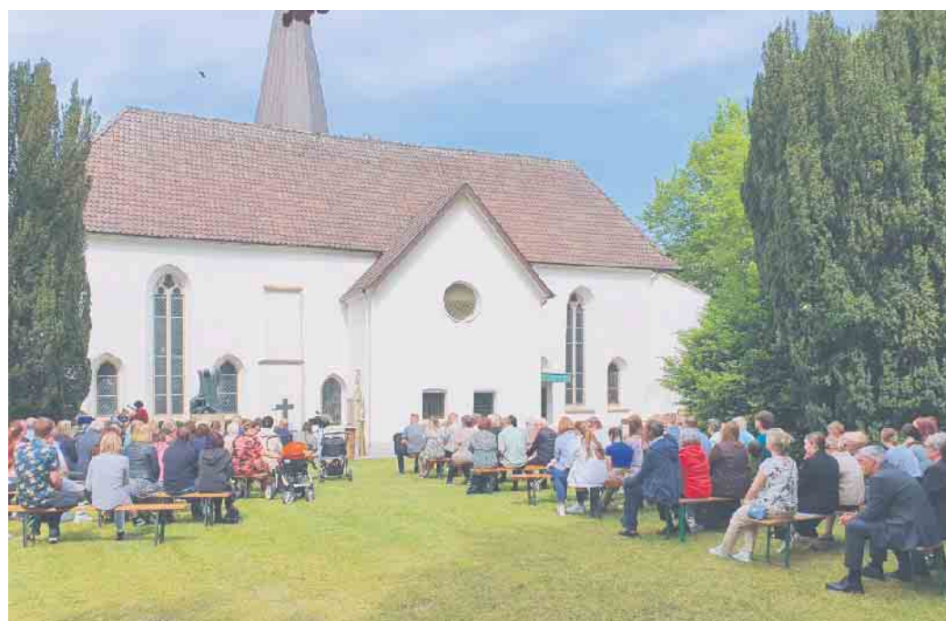
Die große Gemeinde