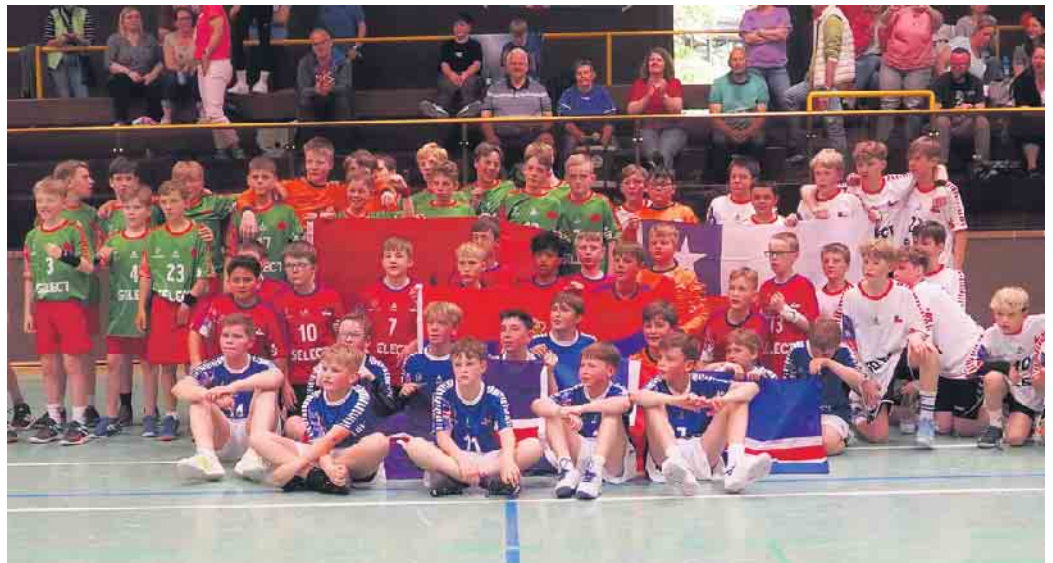
Alle Mannschaften vereint nach dem Turnierende