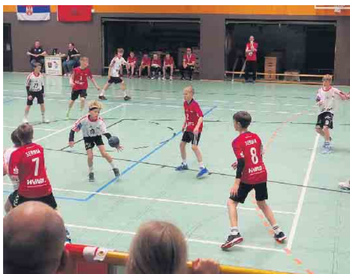
Szene aus dem Spiel Serbien (Lemförde) gegen Chile (Georgsmarienhütte)

Hauptstr. 106 • 49448 LEMFÖRDE • Tel.: 05443 8215