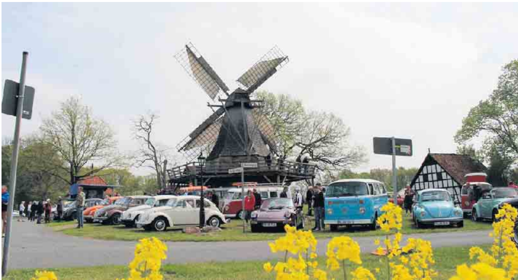
Die ersten Fahrzeuge kamen schon gegen 9 Uhr. Über den Tag verteilt füllte sich das Mühlengelände dann immer mehr mit luftgekühlten Fahrzeugen

ning Old Boys“ heizten dem Publikum dabei ordentlich ein - Hits aus den 60ern wurden zum Besten gegeben. Bei kühlen Getränken und Bratwurst und Pommes verbrachten die Besucher so einen interessanten und abwechslungsreichen Nachmittag an der Mühle.