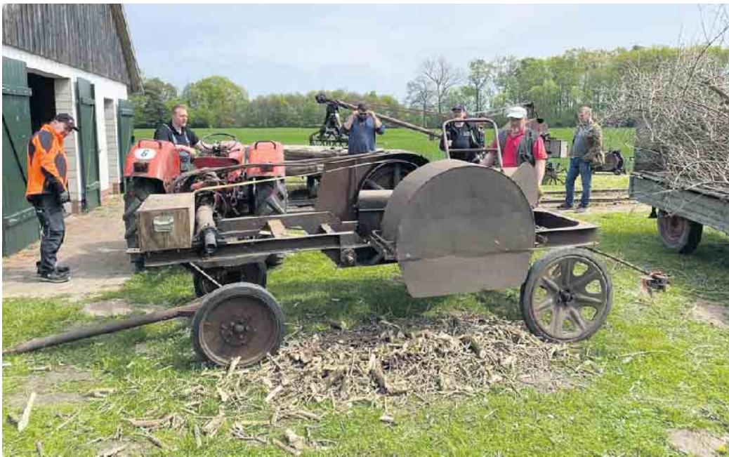
Die Altmaschinenfreunde zeigten Holzverarbeitung mit historischen Geräten.

Am vergangenen Wochenende war das Mühlengelände fest in der Hand der Liebhaber von luftgekühlten Fahrzeugen. Auch wenn der offizielle Beginn auf 10 Uhr geplant war, fanden sich die ersten Fahrzeuge bereits um kurz vor 9 Uhr ein, um die besten Stellplätze zu bekommen. Das Team vom Mühlenverein Levern hatte dafür gesorgt, dass alle Teilnehmer und Besucher mit Kaffee und belegten Brötchen aus dem Steinbackofen versorgt wurden. Schnell füllte sich dann das Gelände rund um die Mühle. Den Besuchern wurde ein umfangreiches Rahmenprogramm geboten. In der Museumshalle wurde gezeigt wie in vergangenen Zeiten aus Milch Butter gemacht wurde. Den interessierten Besuchern wurde vorgeführt wie mühselig es war und wie viele Arbeitsgänge dafür erforderlich sind. Rund um das Sägegatter konnte man sich Vorführungen zum Thema „Holzmachen“ ansehen. Die Mitglieder konnten an der zuvor gefällten Akazie zeigen, wie mit den historischen Maschinen das Holz in die passende Größe gebracht wurde. In der Mühle konnte erstmals ein virtueller Mühlenrundgang gemacht werden. Die Mühle wurde im letzten Jahr mit einer 360 Grad-Kamera von innen aufgenommen und ist nun virtuell begehbar. Besonders spannend war der virtuelle Rundgang mit einer VR-Brille. Viele Besucher konnten so Bereiche der Mühle erkunden die sonst nur den Mühlern zugänglich sind. Das hervorragende Wetter zog dann am Nachmittag viele Gäste auf das Gelände. Die „Bur-