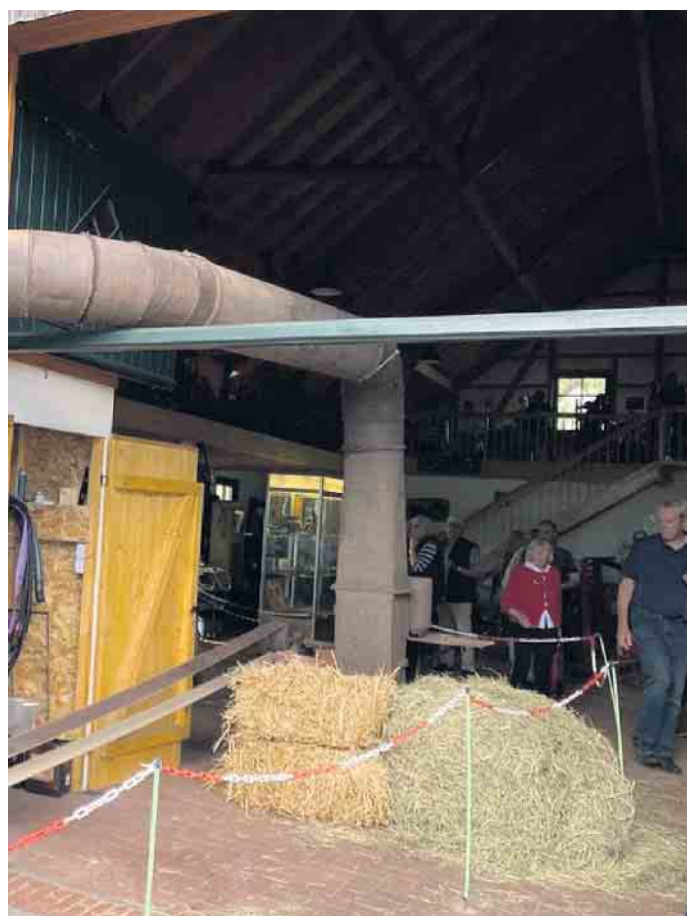
Heugebläse in Aktion: Das Heu wird (unüblicherweise) aus der Halle geblasen

Das Team vom Mühlen Gelände freut sich auf euren Besuch.