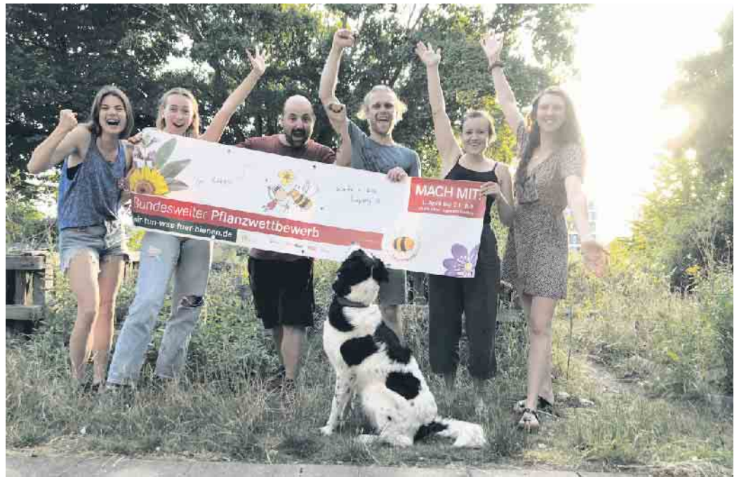
Ehemalige Gewinner*innen beim Deutschland summt!-Pflanzwettbewerb 2022.

Wie wäre es, wenn Sie Ihren Garten, den Balkon, die Terrasse oder eine andere Fläche in eine Insektenoase verwandeln? Egal wie alt Sie sind und wie groß die Fläche ist, Sie können mitmachen! Gegärtnert wird deutschlandweit in zehn Kategorien. Als Teilnehmer*in dokumentieren Sie Ihre Pflanzaktion mit Text und Vorher-Nachher-Fotos. Die Dateien laden Sie dann bis zum 31. Juli auf der Wettbewerbsplattform hoch. Zu gewinnen gibt es Geld- und Sachpreise. Machen Sie mit! Mehr unter: www.wir-tun-was-fuer-bienen.de Online-Lernplattform für naturnahes Grün