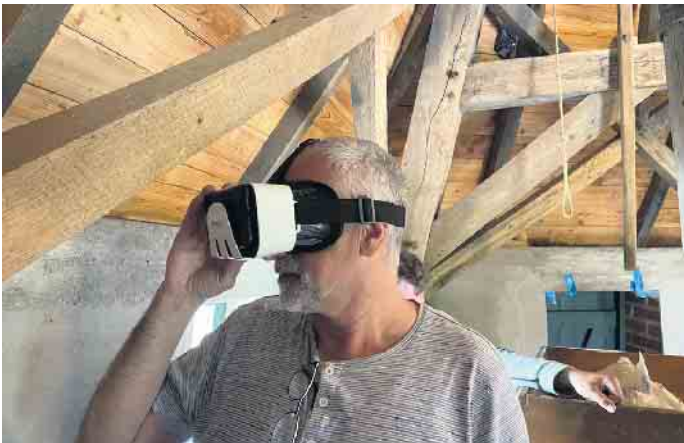
Die neue Attraktion kam gut an - virtuelle Rundgänge mit der VR-Brille