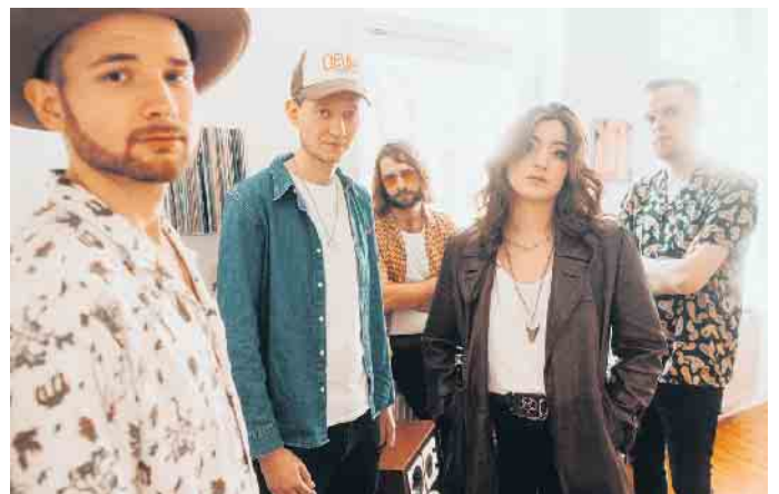
Jail Job Ev