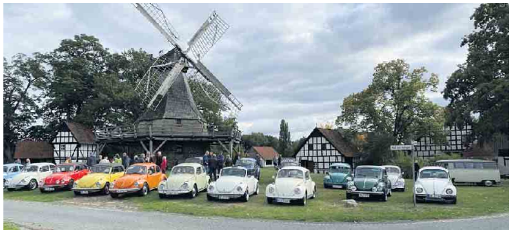
Oldtimertreffen an der Mühle in Lavern

Waffeln und Brezeln aus dem Steinbackofen im Heuerlingshaus. Für diejenigen, die es herzhafter möchten bieten wir auch Bratwurst, Currywurst und Pommes Frites an. In der Remise bieten wir neben den bekannten Kaltgetränken dieses mal auch Altbier frisch vom Fass und Altbierbowle an.