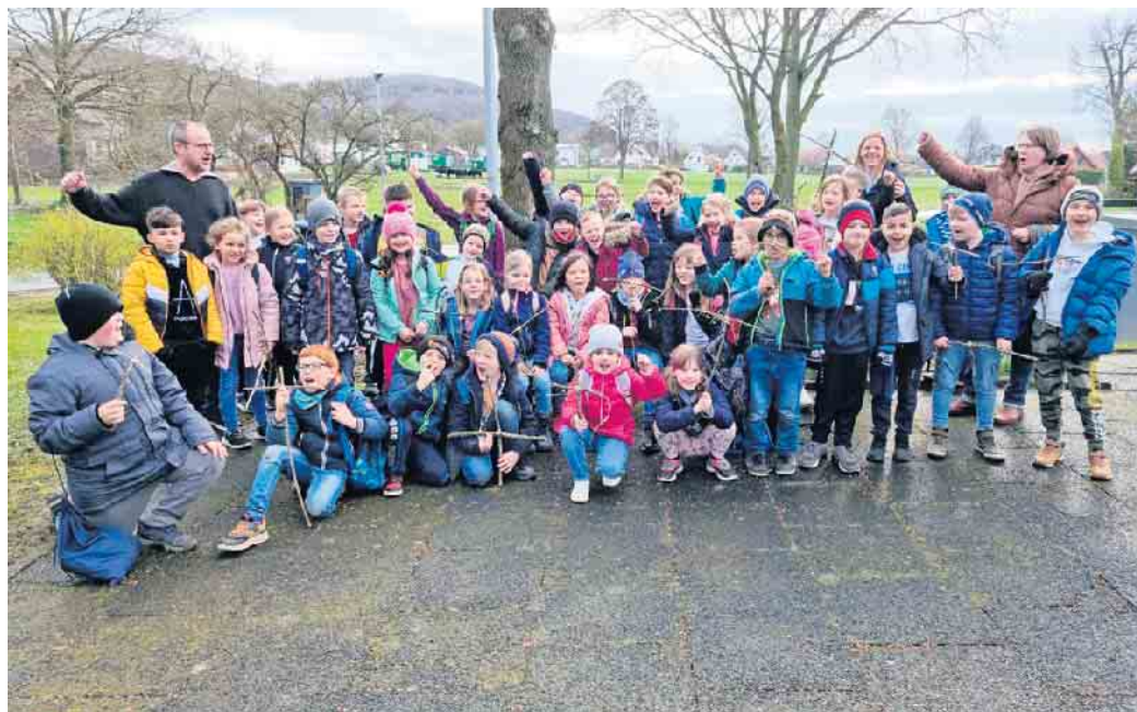
Zufriedene Gesichter und tolle Stimmung

Da wurden Fladenbrote gebacken und Obstspieße hergestellt, aus Stöcken entstanden Kreuze, die mit grünen Zweigen verziert wurden und Ostereier wurden kunstvoll bemalt, nachdem Pfarrer Beening den Kindern die Bedeutung der Eier erklärt hatte: „So wie