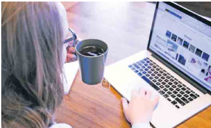
Einfach den eigenen Namen in die Suchmaschine eingeben: So lässt sich herausfinden, welchen ersten Eindruck man etwa auf Personalverantwortliche macht.