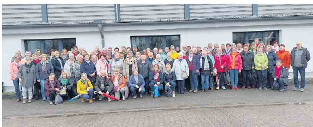
Hahn im Korb. Ein Landmann unter 86 Landfrauen

Unter dem Motto „fasziniert, begeistert, verzaubert“ luden die Veranstalter zu einer Lifestyle-Messe rund um das Thema Garten, Pflanzen, Dekoration; Wohnideen; farbenfroher Frhlingsmode, Schmuck, Accessoires und vielen leckeren Gaumenfreuden ein. Das Landgestt Warendorf, mit einer mehr als 190-jhrigen Geschichte, bildete mit den denkmalgeschtzten Gebuden eine wunderbare Atmosphre fr diese Veranstaltung. Zwischen der Entdeckungstour in die Welt der schnen Dinge, gab es fr die Stewweder Landfrauen die Mglichkeit