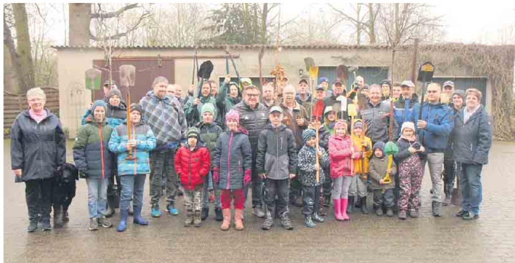
Annähernd 50 fleißige Helfer starteten zur jüngsten Baum pflanzt Aktion des Schützenvereins Oppenwehe.

„Ein ausgewachsener Baum liefert so viel Sauerstoff, wie zehn Menschen zum Atmen brauchen“, machte Bohne deutlich. Außerdem liefere ein Baum Holz zum Bauen und zum Heizen, speiche-