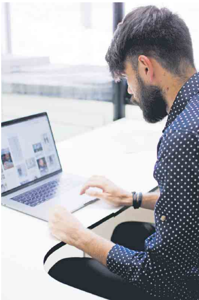
Eigene Qualifikationen, Berufserfahrungen und Stärken darf man online selbstbewusst darstellen.

Dadurch lassen sich unangenehme Überraschungen vermeiden. Unter adeccogroup.de etwa gibt es viele weitere Tipps für das digitale Eigenmarketing und die Jobsuche. Noch ein Tipp, der auf alle sozialen Plattformen zutrifft: Ein systematisches Aufräumen der eigenen Kontaktliste schafft Klarheit und sorgt dafür, dass man selbst relevantere Beiträge angezeigt bekommt. (djd)