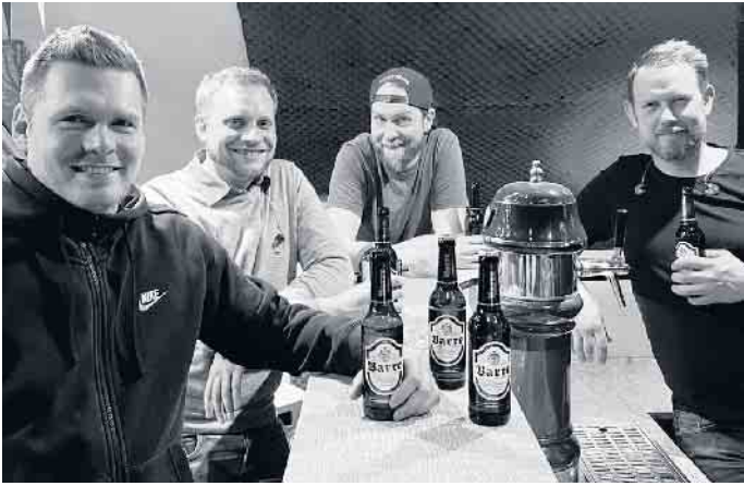
Under The Bitch

Um die Besucher auf die Jam einzustimmen ist es Tradition, dass zu Beginn des Abends ein oder zwei Bands jeweils für 30 Minuten spielen. Im April werden „Bluesbird“ und „Under the Bitch“ auf der Bühne stehen. „Lady Sings The Blues“ - dieses Motto prägt den Sound von „Bluesbird“. Nicht nur der reine Blues, sondern auch Rock und Country gehen in das Klangerlebnis „Bluesbird“ ein. Ein kerniger Sopran mit angerautem Timbre, schwebende Gitarren, Bluesharp, Resonatorgitarre, dazu die stabile Seitenlage einer treibenden Rhythmusgruppe mit jeder Men-