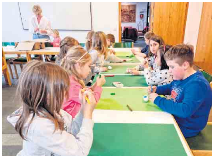
Volle Konzentration beim Eierfärben

Am 3. Mai findet der nächste Projekttag, diesmal in der Dielinger St. Marien-Kirche statt, wobei die Schülerinnen und Schüler der dritten Klassen die Orgel kennenlernen und den Kirchturm besteigen werden. Dabei darf es dann ruhig ein bisschen gruselig werden.