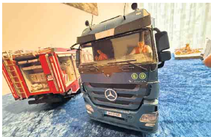
Im Müllwagen sitzen sogar die Fahrer. Aus Papier geformt versteht sich.

Sein neuestes Projekt ist die Nachbildung eines Flughafen-Feuerwehrfahrzeugs aus den USA aus mehr als 1.500 Einzelteilen. Es wird Monate dauern, bis das Modell sein vollendet ist. In diesem Jahr will Eberhardt Hagemann erstmals in der hiesigen Gegend bei der Kunsthandwerkermesse STIK (Stemwede ist kreativ) am 26. Oktober in der Wehdemer Begegnungsstätte seine filigranen Modelle der Öffentlichkeit zeigen.