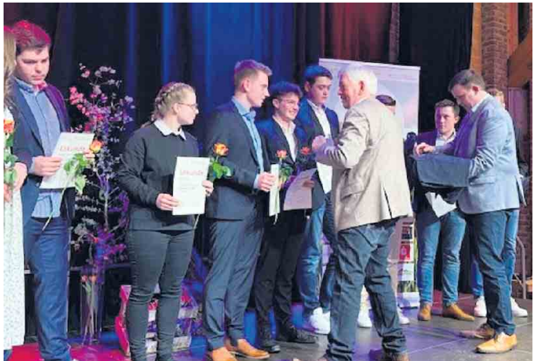
Händeschütteln und gute Worte gab es für jeden Einzelnen der Absolventen.