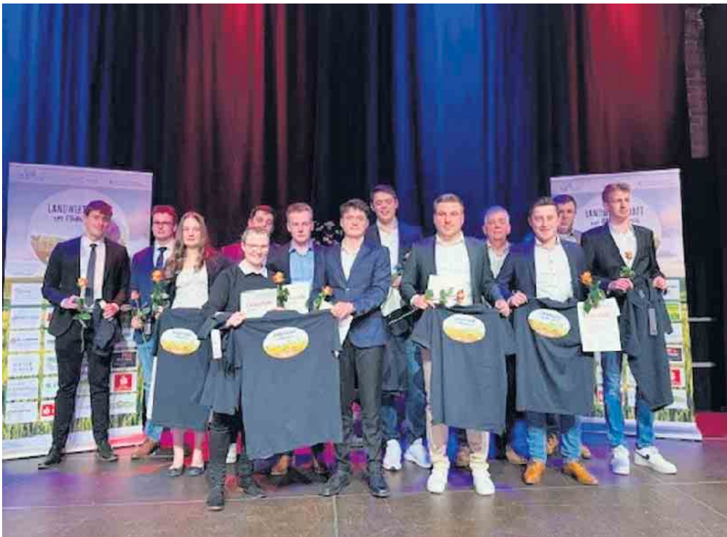
Die Freisprechungsfeier war ein gut besuchtes Event.

angelegenheit“, unterstreicht der Kreislandwirt. An dem Abend waren die jungen Landwirte und Landwirtinnen zahlreich mit ihren Familien und Ausbildern der Lehrbetriebe gekommen.