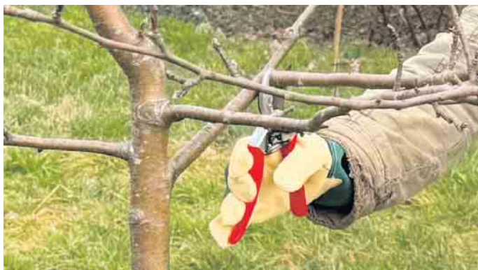
Wo das Werkzeug für den perfekten Schnitt angesetzt wird, zeigte der Fachmann.

Sonnabend zu einem Baumschnittkurs auf die Wiese an der Stemwederbergstraße eingeladen, um zu zeigen, wo man Schere richtig ansetzt. Der Obstbaumschnitt erfordert zwar Wissen und Geschick, doch mit der richtigen Technik kann