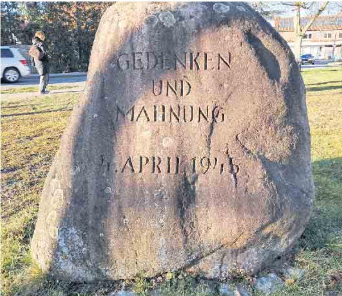
An der Ecke Hgelstrae/Schrttinghauser Strae in Levern erinnert ein Gedenkstein an den 4. April 1945.

Heimatverein Levern möchte am 04. April an den 80. Jahrestag des Kriegsendes in Levern und im Lübbecke Land erinnern