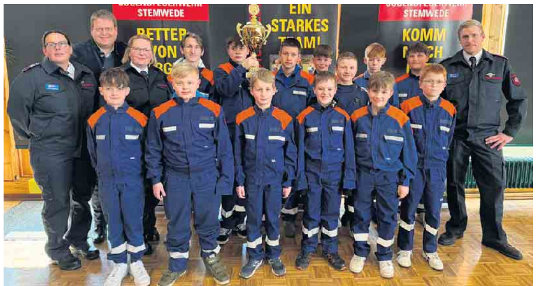
Der zweite Platz ging an die Jugendfeuerwehr Haldem-Arrenkamp (335 Punkte).

Musikalisch wurde der Kreisjugendfeuerwehrtag von Chris Blevins untermalt. Außerdem gab es bei einem Feuerwehr-Quiz kleine Preise zu gewinnen.