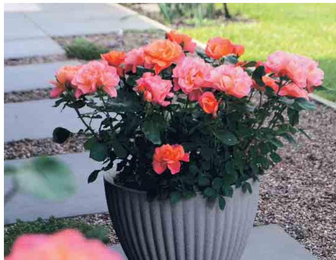
Während sich die Blüten der „Sugar Candy Rose“ öffnen entsteht ein Farbspiel, das an knallbunte Zuckerstangen erinnert.

Mit ihren vielen roten Blüten sieht sie aus wie gemalt. Die Rede ist von „Zepeti“, einer neuen Rosensorte, von der man von Weitem glauben könnte, sie wäre künstlich. Mit glänzend dunkelgrünen Blättern ist sie extrem widerstandsfähig gegen all die schrecklichen Rosenkrankheiten dieser Welt und setzt den ganzen Sommer über neue Blüten an. Kein Wunder, denn diese Rose ist nicht von schlechten Eltern: Geboren wurde sie in der erfolgreichen Züchterschmiede von Meiland in Frankreich. Ihre Mutter ist eine Zwergrose, die endlos blüht, und der Vater eine kerngesunde Knock Out-Rose.