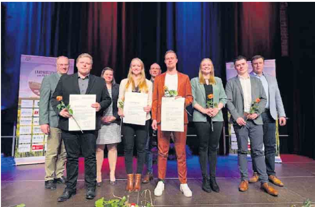
Der landwirtschaftliche Nachwuchs stellt sich „gut ausgebildet“ den Herausforderungen der Zukunft.