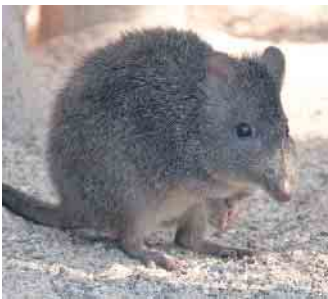
Nach ein wenig Eingewöhnung fühlt sich Langschnauzen-Kaninchenkänguru-Männchen Billy in seiner neuen Anlage schon sehr wohl. Weibchen Willa ist noch etwas zurückhaltender.