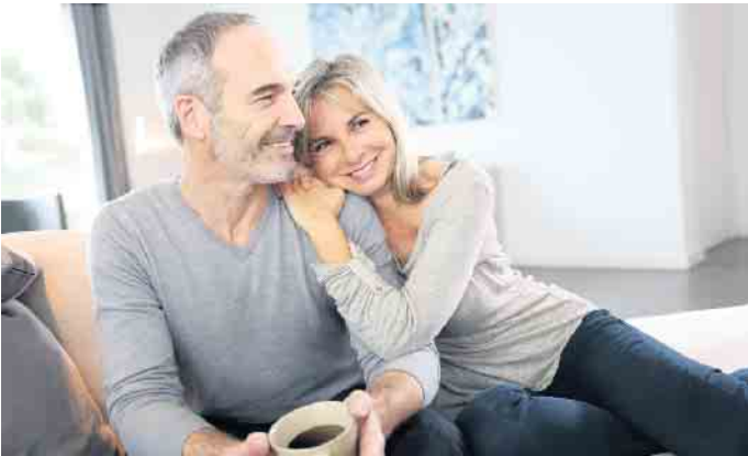
Eine Lüftungsanlage bietet mehr Lebensqualität. Die Räume werden kontinuierlich mit Außenluft versorgt, Feinstaub und Pollen werden dabei zuverlässig abgefangen.

Die effiziente Filtertechnik der kontrollierten Wohnungslüftung verhindert, dass Feinstaub, Pollen und Insekten beim Lüften ins Haus gelangen. So herrscht immer frische Luft, auch bei geschlossenen Fenstern. Damit das Lüftungssystem effizient arbeitet, sollten die Filter mindestens einmal im Jahr überprüft und ausgetauscht werden, bei Bedarf auch öfter. Sie können ganz einfach selbständig ausgewechselt werden. Durch den stetigen, aber zugleich zugluftfreien Luftaustausch beugen Lüftungsanlagen auch einer zu hohen CO 2 -Konzentration sowie der Entstehung von Schimmel vor. Über Sensoren lassen sich Feuchte, CO 2 - und Schadstoffgehalt gezielt überwachen und individuell nach Bedarf steuern, auch per App. Im Vergleich zum manuellen Lüften sind Lüftungsanlagen mit Wärmerückgewinnung zudem energieeffizient und senken die Heizkosten. (DJD)