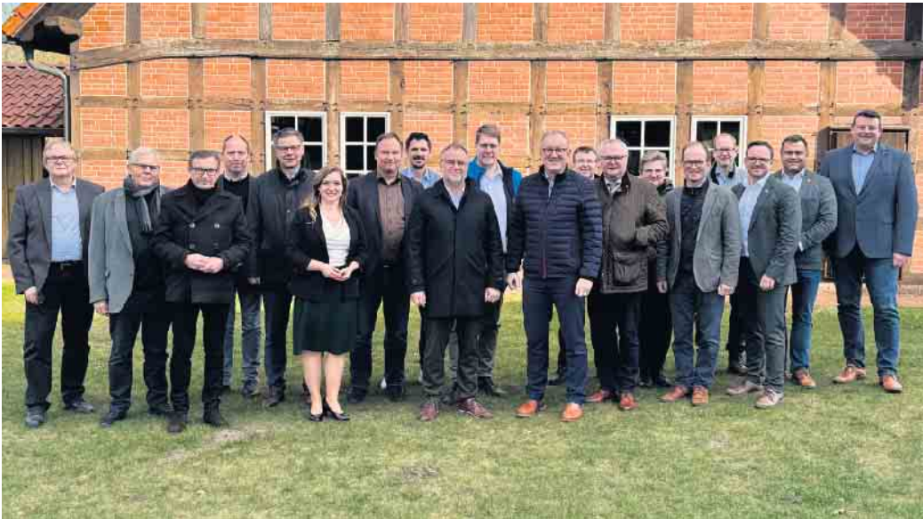
Kürzlich tagte die Mitgliederversammlung des Landschaftsverbandes Weser-Hunte und beschloss den aktuellen Haushalt.

Noch Mittel zur Förderung der niederdeutschen Sprache verfügbar