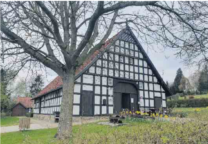
Heimathaus Wehdem.

Das Heimathaus Wehdem ffnet am 1. April, um 19 Uhr, seine Tren fr den Vortrag „Die Strae“ von Wilhelm Aping. In dem Vortrag geht es um die Grenzstreitigkeiten zwischen den Drfern Wehdem und Westrup um die Strae Groe Holz, welche sich an diesem Tag zum 125. Mal jhrt. Der Vortrag ist kostenlos.