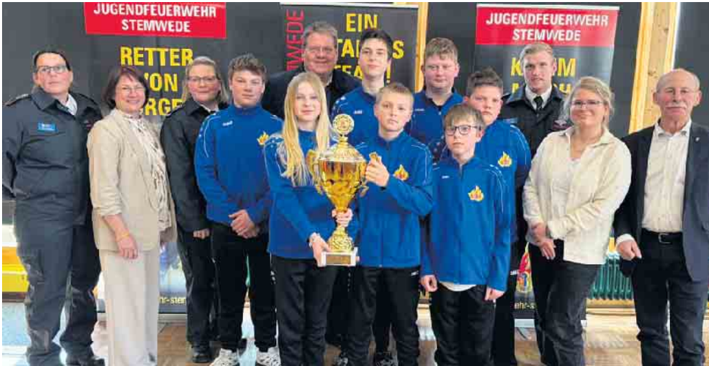
Die Jugendfeuerwehr Drohne-Dielingen konnte sich den ersten Platz bei den Kreismeisterschaften sichern. Es gratulierten die Ehrengäste.

Jugendfeuerwehren des Kreises Minden-Lübbecke tagten in Wehdem