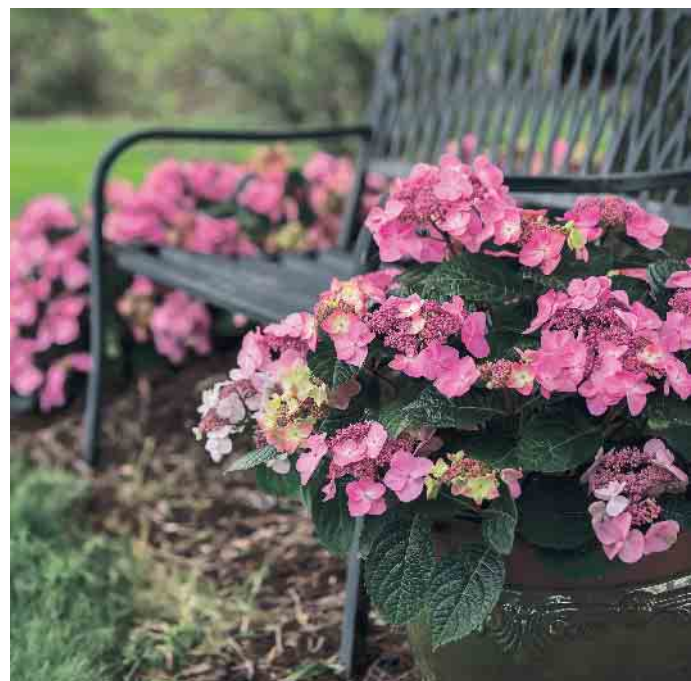
Die neue Tellerhortensie „Pop Star“ macht auch im Kübel eine gute Figur.

Hortensien fühlen sich im Halbschatten am wohlsten und bevorzugen einen leicht sauren, lehmig-humosen Boden, der die Feuchtigkeit gut hält. Das Pflanzloch zweibis dreimal so groß wie den Ballen ausheben, der nur feucht und bodeneben eingesetzt werden darf. Durch das Lockern der Ränder und der Sohle des Pflanzloches wird Staunässe verhindert und gleichzeitig können die flachen Wurzeln leichter in den Boden einwachsen. Anschließend das Pflanzloch mit Erde auffüllen, um die Pflanze herum leicht antreten und einen etwa 10 Zentimeter hohen Gießrand anhäufeln. (akz-o)