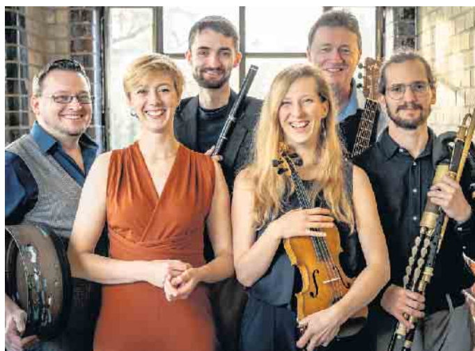
Die sechs Musikerinnen und Musiker von „Larún“ spielen auf den traditionellen Folkmusik-Instrumenten.

Weitere Informationen und Kartenvorbestellungen unter www.folkfruehling.de