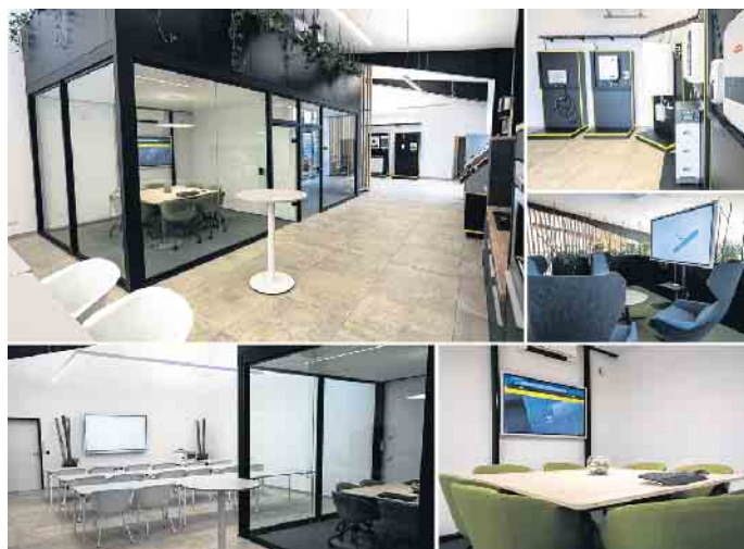
Das Hilker Forum bietet vielfältige Möglichkeiten für Schulung, Information und Vertrieb.

genregie - und viele weitere sollten folgen. Bis zum Jahr 2010 wächst das Unternehmen, und der Bedarf an Platz nimmt zu. Während ein Container mit Modulen im Jahr 2004 noch eine Besonderheit war, rollen heute fast täglich die LKW der Zulieferer an. Diesem Wachstum wird mit dem Bezug eines neuen Bürogebäudes in der Steinmasch sowie dem Bau von Außenlagern und zusätzlichen Lagerflächen an der Carl-Zeiss-Straße Rechnung getragen.