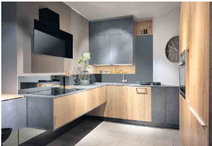
Viel Raum zum Verstauen bietet diese kleinere Lifestyle-Küche in trendiger Spachtelbeton-Optik kombiniert mit Alteiche (Dekor). Durch die raffinierte Planung entsteht eine Atmosphäre von Weite und Großzügigkeit.

chen, Spülen und Kühlen wie ein Professional: 45 cm hohe Kompakt-Einbaugeräte in einen Hochschrank neben- oder übereinander integriert - sie sorgen garantiert dafür, dass in kleine Lifestyle-Küchen ebenso viel Komfort, Energieeffizienz, Funktionalität und innovative Technologien einziehen, wie man sie auch aus großen, offenen Wohnküchen kennt. Eine weitere interessante Option sind 2in1-Produkte wie Induktionskochfelder mit einem integrierten Dunstabzug. Für eine verlängerte Frische von empfindlichen Lebensmitteln plus Vitamainerhalt planen die Küchenspezialisten attraktive Einbau-Kühl-/Gefriergeräte je nach der individuell gewünschten Nischenhöhe ein. Und wo kein großer Geschirrspüler Platz hat, tut es auch ein 45 cm schmales Einbaugerät mit der gleichen Komfortausstattung und Effizienz wie ein Modell in Standard-Size. Viele 45er-Modelle arbeiten zudem sehr leise, was sie auch für Appartements attraktiv macht. Damit die Tätigkeiten an der Spüle