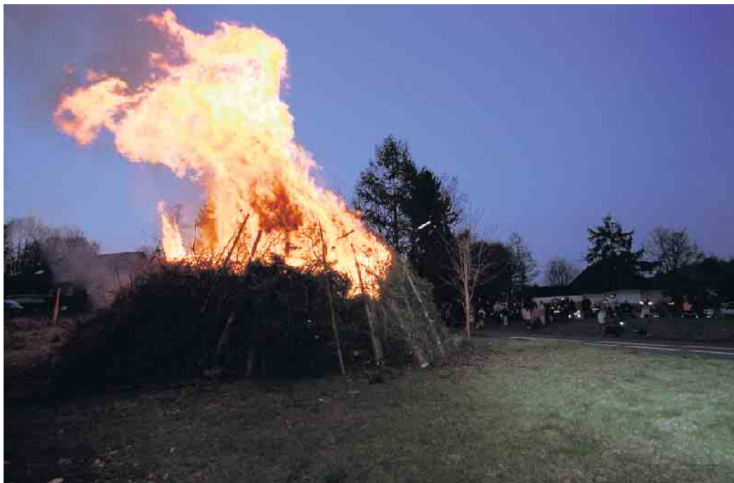
Osterfeuer sind ein uralter Brauch und haben bis heute nichts an ihrer Faszination verloren.

Um das Osterfeuer ranken sich weitere Märchen. Das brennende Osterfeuer soll früher einmal umtanzt und das verglimmende über-