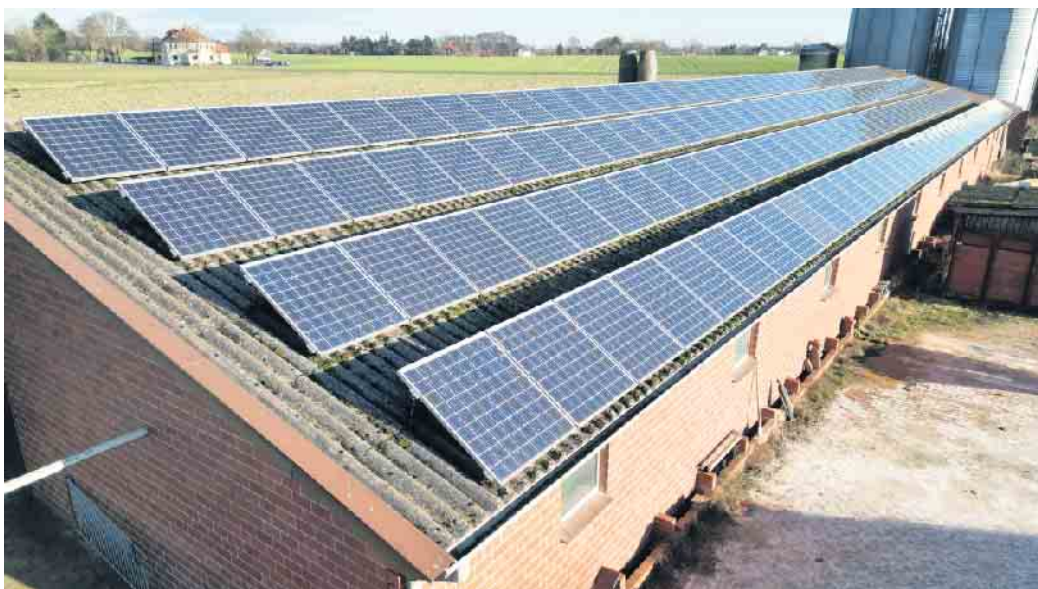
Die 2004 erbaute Anlage an der Bremer Straße in Rahden funktioniert auch heute noch reibungslos.

„Als Subunternehmer hatte ich zuvor bereits einige PV-Anlagen für Kollegen aus der Region gebaut. Aber bei dieser Anlage habe ich meinen ersten kompletten Container mit Photovoltaik-Modulen bestellt. Der Wert war enorm, aber schon damals