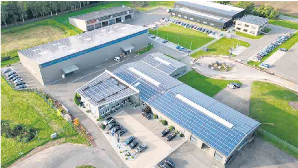
Der Firmenkplex an der Carl-Zeiss-Straße aus der Luft.

Seit Februar stehen unter anderem Abendveranstaltungen zum Thema Photovoltaik auf dem Programm. Der nächste Termin ist am 08. April - das Unternehmen freut sich auf interessierte Besucher. Da die Plätze begrenzt sind, wird um vorherige Anmeldung gebeten. Dies kann über die Webseite www.hilker-solar.de (Banner im oberen Bereich) oder direkt per Telefon unter 05771 - 914 99 130 geschehen.