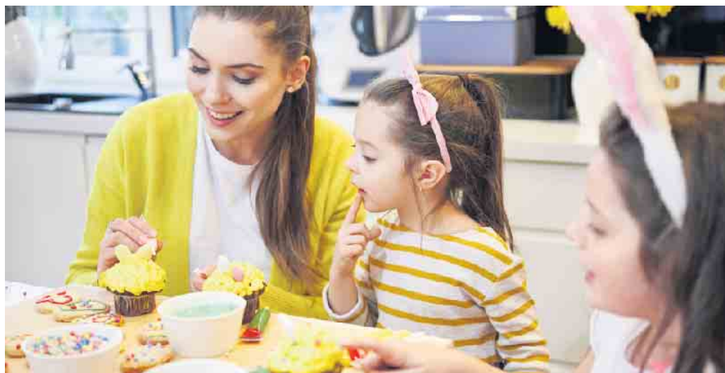
Vielfältige traditionelle Leckereien aus der Osterbäckerei versüßen uns das Osterfest.