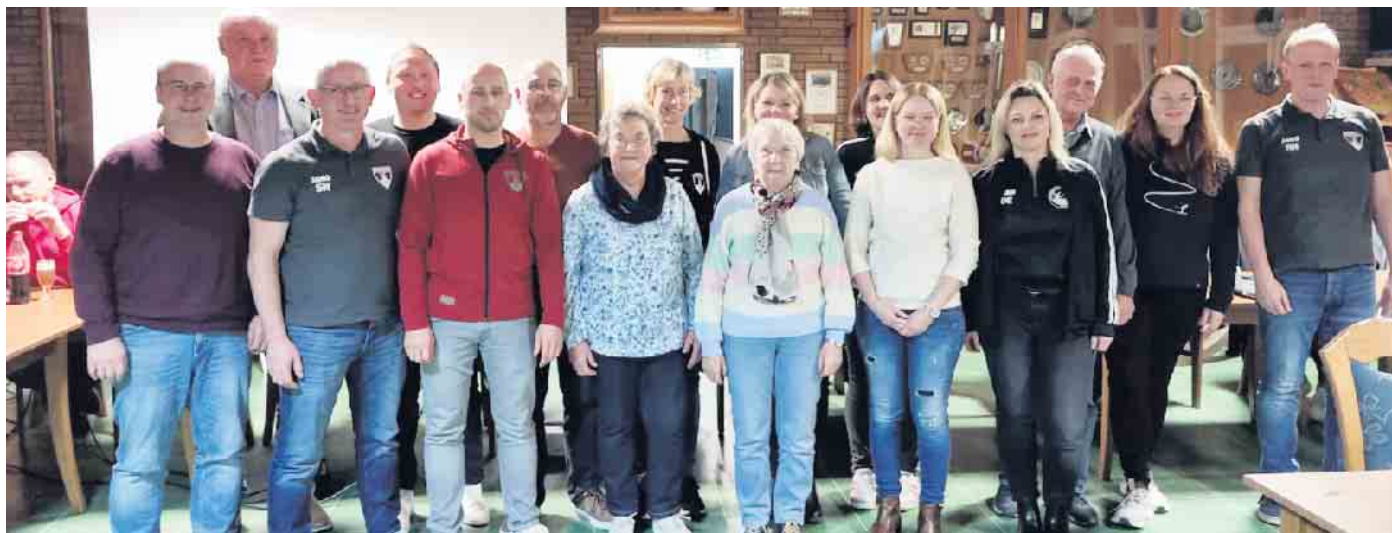
Geehrte und gewählte Mitglieder

Neu im Angebot des FCO wird nach den Osterferien eine Badminton-Gruppe sein.