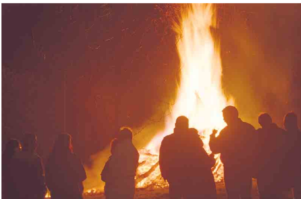
Hier trifft man sich: Am Osterfeuer kommen große und kleine Besucher aus den Dorfgemeinschaften immer wieder gerne zusammen.