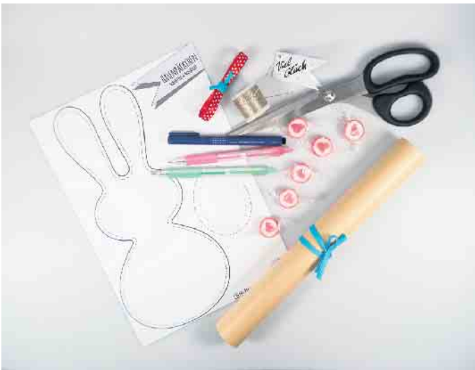
Das Material für die Osterhasentüten auf einen Blick.

Für den Anhänger die ausgedruckte Ostereivorlage oder eine selbst gewählte Form aus Papier ausschneiden und mit verschiedenfarbigen G2-7 Stiften individuell gestalten. Am Ende lochen und mit Schleifenband an der Hasentüte befestigen. Fertig ist das süße Ostergeschenk! (djd)