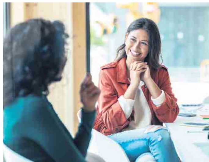
Ein Bewerbungsgespräch ist immer ein Dialog, bei dem auch der Arbeitgeber auf dem Prüfstand steht.