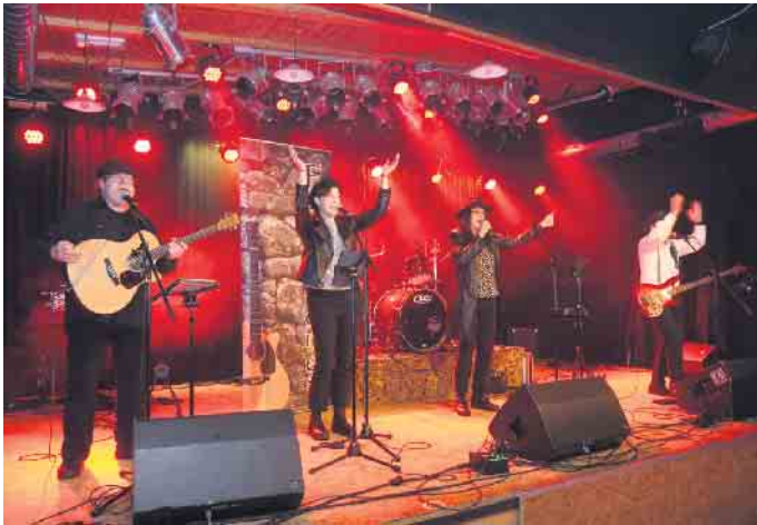
Die Band „Folk Stones“ überzeugte mit vierstimmigem Folk.

20 Musiker und Künstler gaben sich die Klinke in die Hand