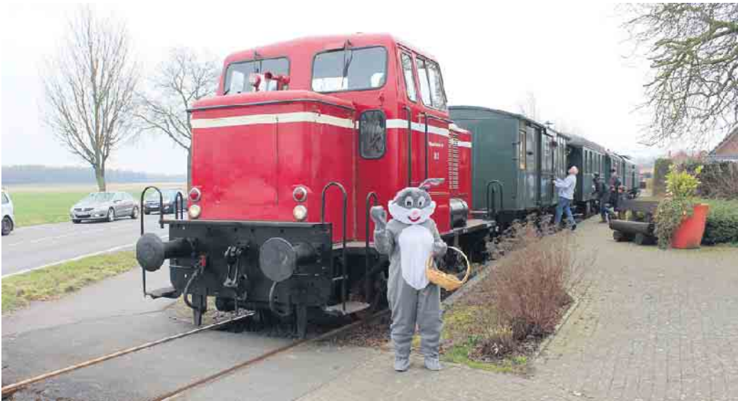
Zu Ostern ist die Museumsbahn wieder unterwegs

Am Ostermontag eröffnet die Museums-Eisenbahn Minden die Saison auf der Wittlager Kreisbahn mit einer Osterhasenfahrt. Auf dem Wehrendorfer Bahnhofsgelände können die kleinen Fahrgäste, ausgerüstet mit einem Lösungsbogen sich auf die Suche nach Osternestern machen. In den Nestern finden die Kinder altersgerechte Rätsel, die zu lösen sind und deren Antwort dann in den Lösungsbogen eingetragen wird. Der Osterhase tauscht den Lösungsbogen am Ende der Suche gegen ein mit Süßigkeiten gefülltes Osternest ein. Während des dreiviertelstündigen Aufenthaltes in Wehrendorf werden Bratwürstchen und Getränke angeboten. Der Kleinbahnzug der Museums-Eisenbahn, wie er in den Fünfziger Jahren auf der Wittlager Kreisbahn verkehrte, fährt um 10.30 Uhr und um 13.30 Uhr von Preußisch Oldendorf und um 11.30 Uhr ab Bohmte zum Ostereiersuchen nach Wehrendorf. Die Fahrt, die über die gesamte Stre-