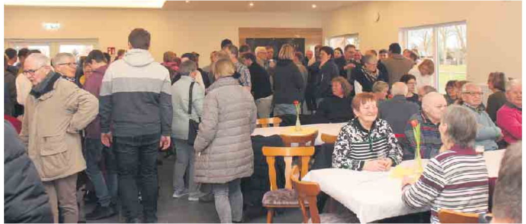
Groß war das Interesse der Bürger zur Einweihung des neuen Dorfgemeinschaftshauses in Oppendorf.

Vereinen und Bürgern steht nun ein moderner Gebäude, das mit seiner Ausstattung auf der Höhe der Zeit ist, zur Verfügung. Für den Schützenverein gibt es einen neuen Schießstand, für den Sportverein TuS Oppendorf stehen neue geräumige Umkleidekabinen zur Verfügung. Neu sind auch die sanitären Anlagen, nebst behindertengerechtem Toilettenraum sowie die Küche. Herzstück aber ist der große lichtdurchflutete Gemeinschaftsraum, der allen Vereinen und Bürgern zur Verfügung steht. „Um ein solches Gebäude zu errichten, benötigt es zwei wesentliche Dinge: Geld um