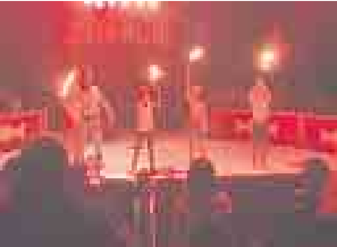
Die Fakire sorgten für Erstaunen beim Pubikum