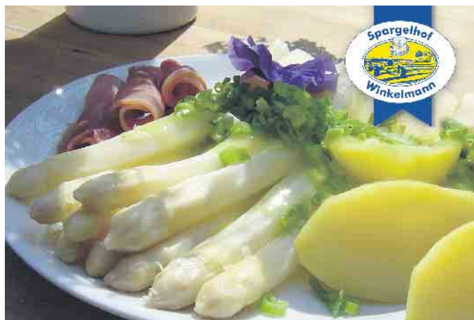
Spargel aus der Region bietet die Spargeldiele Winkelmann ab dem 1. April an