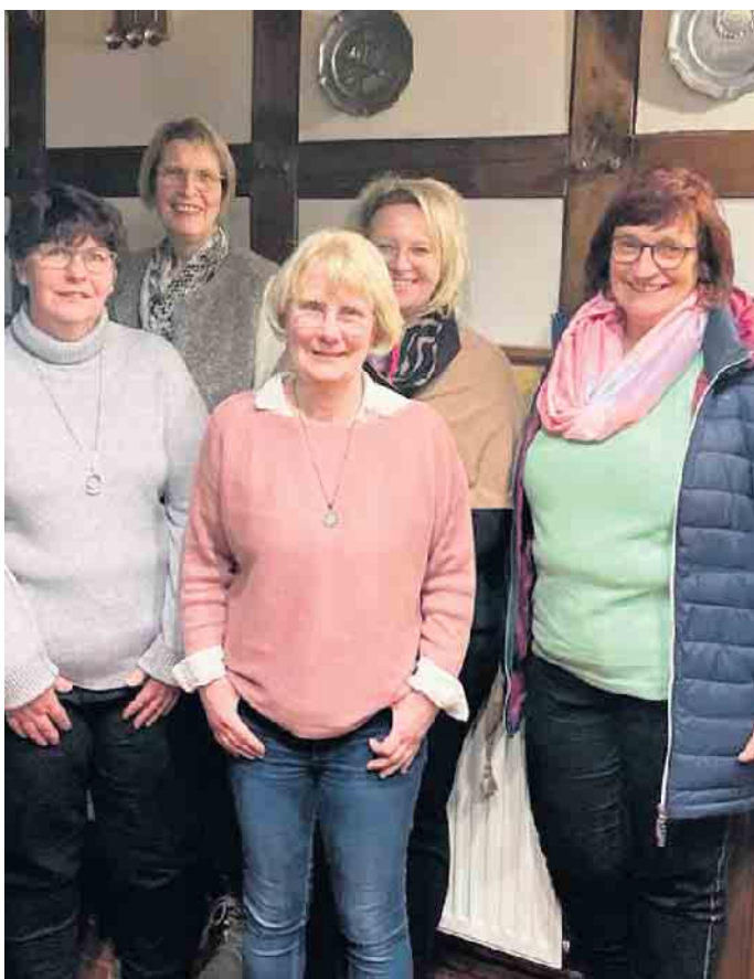
Vorstand der Dielinger Landfrauen

Nachdem alle Formalien geregelt waren wurde der gemütliche Teil eingeläutet. In Gesprächen und Überlegungen gab es viele Ideen für die neue vierjährige Amtszeit.