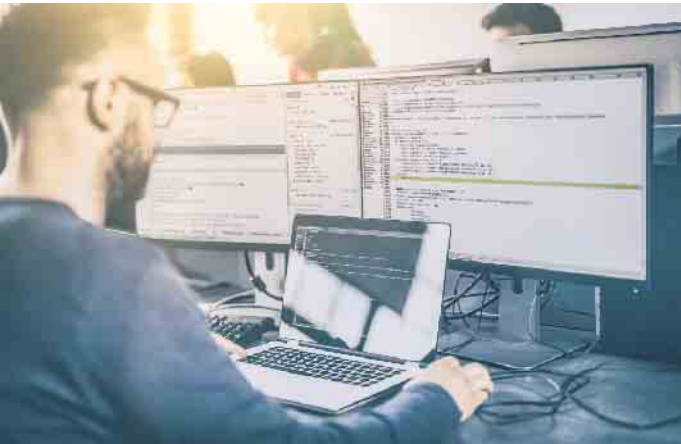
Cybercrime-Experten setzen sich vor allem mit dem technischen Vorgehen von Hackern auseinander.