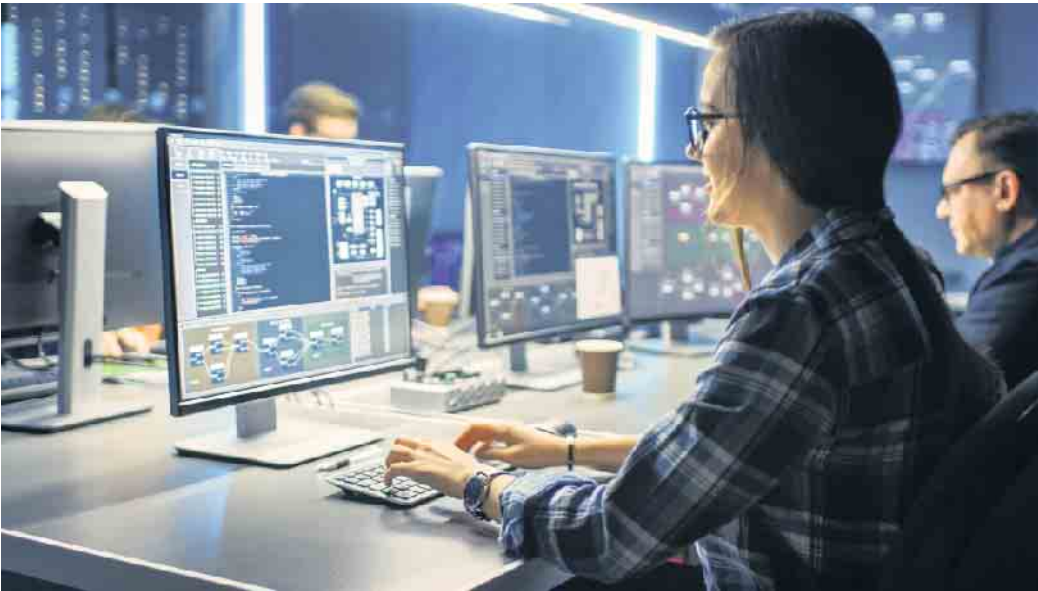
Die Absolventinnen und -absolventen des Studiengangs sollen Cybercrime-Angriffe frühzeitig erkennen und entsprechende Sicherheitsmaßnahmen planen und umsetzen können.

Was früher der Stoff von Science-Fiction-Filmen war, ist heute eine reale Bedrohung: Cyberkriminalität. Vor allem öffentliche Verwaltungen werden immer wieder Opfer von Hackerangriffen, weil IT-Sicherheit in vielen Behörden noch ein weitgehend blinder Fleck ist. Die Bedrohung durch Angriffe aus dem Netz auf Behörden und Unternehmen ist auch nach Ansicht des Bundesamtes für Sicherheit in der Informationstechnik (BSI) gestiegen. Galt die Lage vor einem Jahr noch als „angespannt“, so wird sie im aktuellen Lagebericht als „angespannt bis kritisch“ beschrieben. Die Furcht vor Hackerangriffen ist eine der größten Sorgen von Unternehmen. Weltweit steht diese Gefahr einer Studie zufolge auf Platz eins, in Deutschland rangiert das Thema auf dem zweiten Rang hinter der Betriebsunterbrechung - die wiederum nicht selten