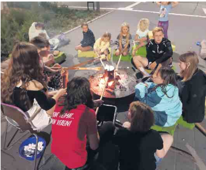
Kommt, schaut euch um, findet Freunde

Die einzelnen Gruppen, die sich im Life House treffen, haben hierfür großartige Angebote vorbereitet und laden zum Ausprobieren und Mitmachen ein. Die Kindergruppen, die sich an diesem Tag im Life House vorstellen sind der Kindertreff und Kochen für Kinder. Die Jugendgruppen, die an diesem Nachmittag ihren Treff vorstellen sind der Mädchentreff, der Jungen- und Sporttreff und die MINT-AG. Weitere Gruppen sowohl für Kinder und Jugendliche, die sich regelmäßig im Life House treffen, sind die Naturgruppe und der Kinder- und Jugendtreff (Ki-JuT). Außerdem können die Besucher*innen die einzelnen Räume und ihre Freizeitaktivitäten, wie einen Gamingraum, verschiedene Konsolen, Gesellschaftsspiele, Kicker, Billard und weitere Angebote erkunden und ausprobieren. Abgerundet wird der Nachmittag mit dem Spielmobil sowie Snacks und Getränken.