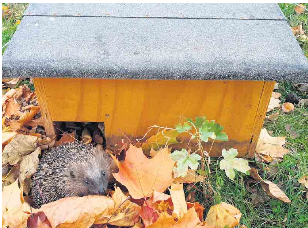
Igel am Schlafhaus

sich bei der Igelhilfe Herford-OWL informieren unter der Notfallnummer 0151 2138 6210.