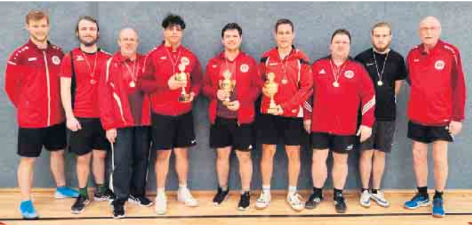
Alle Teilnehmer Herren-Einzel und -Doppel