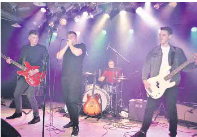
The Backyard Band

dem es bei den Besuchern kein Halten mehr gab. Vom ersten Ton an ging es mit vollem Rhythmus nach vorne und still stehen gehörte der Vergangenheit an. Die vier Kölner Musiker standen voller Energie auf