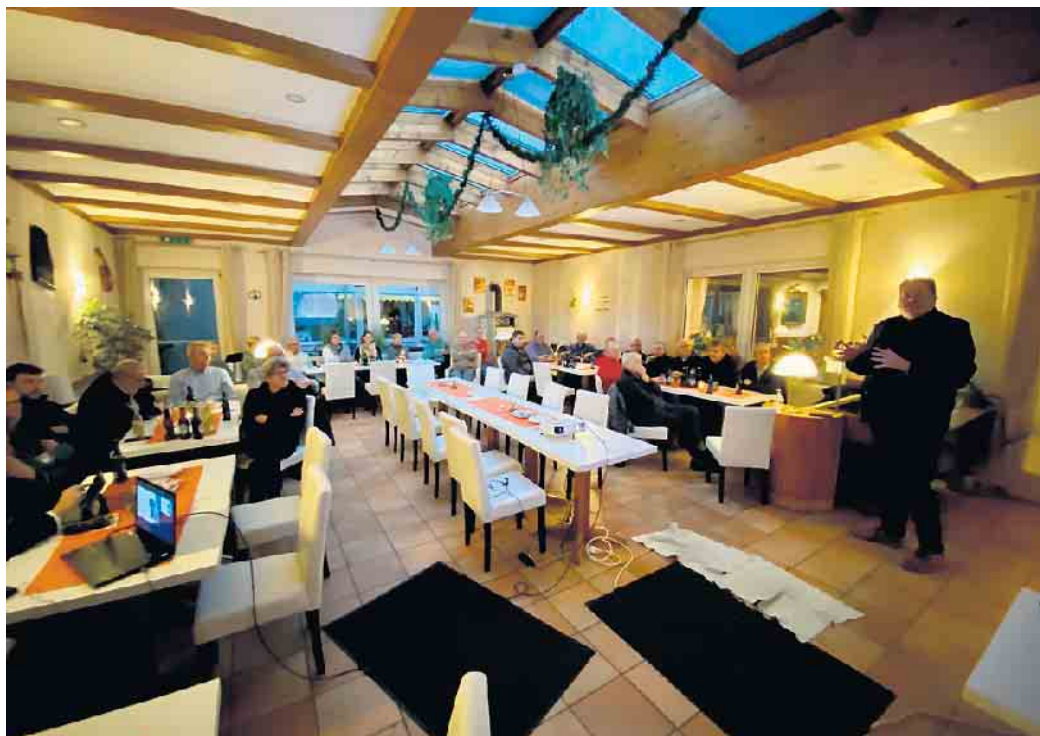
Ortsteilgespräch in Oppenwehe

Hier kam noch einmal der Hinweis des Bürgermeisters, dass defekte Spielgeräte auf Spielplätzen bitte der Gemeinde gemeldet