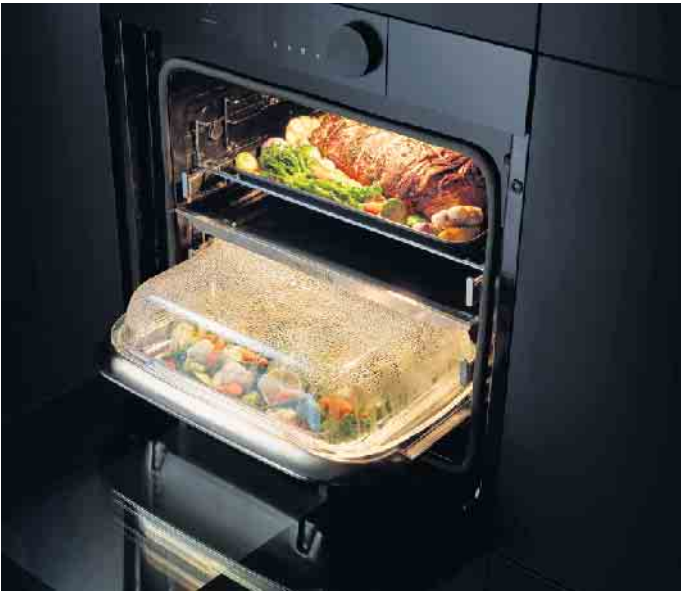
Oben schmort das Fleisch, unten gart das Gemüse sanft und vitaminscho-nend im Dampfgareinsatz. Beides bei unterschiedlichen Be-triabsarten, Temperaturen, Garzeiten und ohne Geruchs- und Ge-schmacksübertragung.