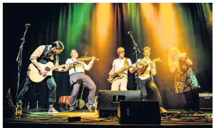
Die Kilkenny Band aus Osnabrück

www.stewweder-kulturring.de Ticket-Vorbestellungen werden ab sofort entgegengenommen.