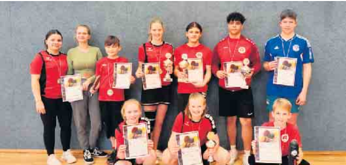
Schüler und Jugend: Teilnehmer Schüler, Schülerinnen, Jungen, Mädchen