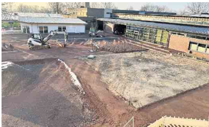
Blick auf den im Bau befindlichen neuen Schulhof der Stemmweder-Berg-Schule.

Für das neue Jugend-, Sport- und Freizeitzentrum steht ein Gesamtbudget von 6,5 Millionen Euro zur Verfügung. Der Bund fördert das Projekt mit knapp 2,3 Millionen Euro. Der Großteil der Gesamtkosten fließt in die umfassende Sanierung der Zweifachturnhalle, die sowohl unter energetischen Gesichtspunkten als auch im Sinne der Barrierefreiheit von Grund auf modernisiert wird.