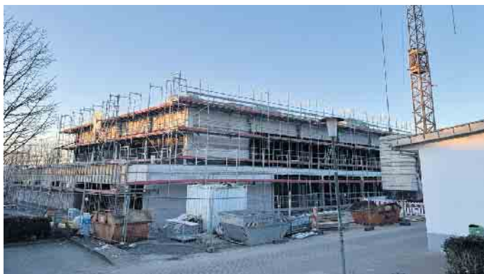
Eine tiefe Fensterfront zielt künftig die Nordseite und sorgt für ordentlich Tageslicht in der Halle. Die Fenster werden in den kommenden Wochen eingesetzt.