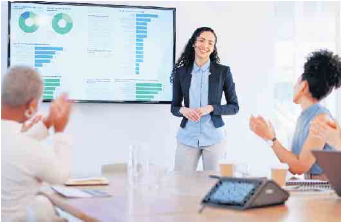
Lampenfieber ade: Wie man erfolgreich PowerPoint-Präsentationen erstellt und vorträgt, lässt sich mithilfe einer Weiterbildung schnell erlernen.

fi“, der sich im Arbeitsalltag dann als falsch herausstellt. Hier gilt das Motto: Mut und Offenheit zur Wissenslücke - oder besser noch im Vorfeld Lücken schließen. (DJD)