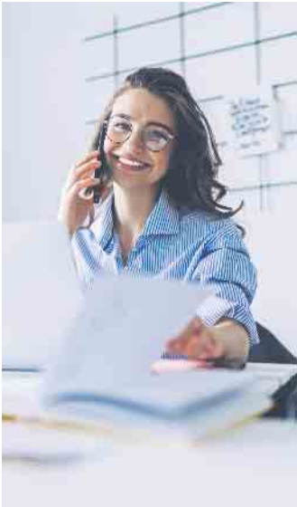
Echter Durchblick statt Chaos: Schulungen in MS Office sind ideal für alle, die sich auf Bürojobs bewerben wollen.

Arbeitgeber schätzen nicht nur Bewerber, die über fundierte Kenntnisse in Office-Anwendungen verfügen, sondern auch Ehrlichkeit und Offenheit. Eine Aussage wie „In Excel bin ich noch nicht so fit, aber ich mache gerade eine Weiterbildung“ wird von Arbeitgebern deutlich lieber gehört als der Satz „Da bin ich Pro-