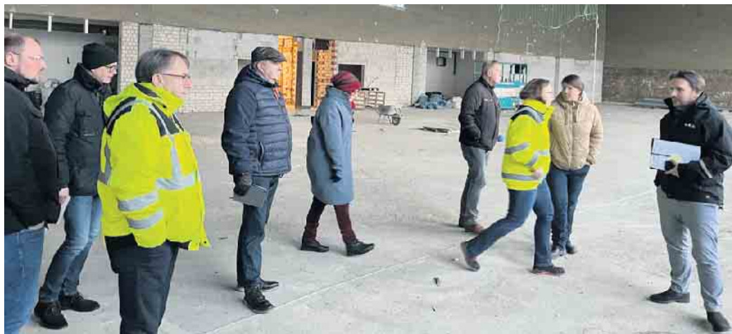
Besichtigung der entkernten Zweifachturnhalle in Wehde: das baubegleitende Gremium machte sich ein Bild vom aktuellen Stand der Bauarbeiten.