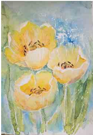
Blumen mit Aquarell-Malerei

Die Teilnehmer lernen, zarte und lebendige Blumenkompositionen mit Aquarellfarben zu gestalten? Anmeldung unter anmelden.life-house.de oder 05773-991401.