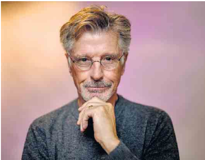
Als Traumschiff-Arzt Doc Sander ist Nick Wilder einem Millionen-Publikum bekannt. Im April lädt er auf Schloss Benkhausen zu einer musikalischen Lesung ein.

„Ich freue mich schon sehr auf das besondere Ambiente von Schloss Benkhausen. Das wird ein außergewöhnliches Event“, erklärt Nick Wilder. Millionen Deutsche kennen ihn noch aus seiner Rolle als ZDF-Traumschiff-Arzt „Doc Sander“. Außerdem gab er einer großen deutschen Versicherungsgesellschaft in zahlreichen Spots unter dem Motto „Hallo, Herr Kaiser!“ ein unverwechselbares Gesicht. Weniger bekannt dürfte das sympathische Nordlicht - seine Heimat ist die In-