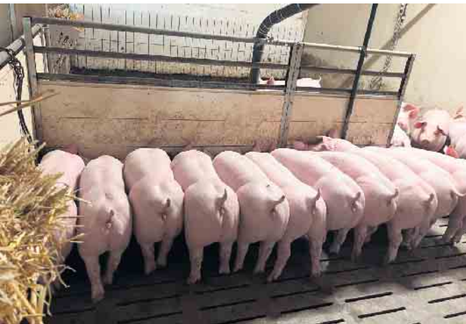
Im Schweinemastbetrieb Sander wird großer Wert auf Tiergesundheit gelegt.