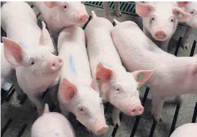
Jede Woche werden auf dem Wehdeiner Hof Ferkel geboren.