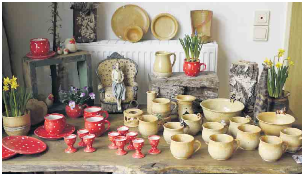
Handgefertigte Seifenschalen gehören zu den kreativen Arbeiten aus der Töpferei von Kathinka Luckmann und Gerd Lammers in Sundern.

Dort lassen sich ihre kreativen Ideen perfekt umsetzen; mit viel Platz drum herum: einem großen Bauerngarten, einer Blumenwiese und vielen alten Haustierrassen. Nach und nach verwandelt sich der ganze Hof in ein größeres Ge-