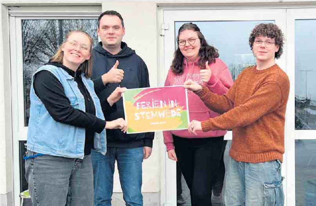
Garantiert keine Langeweile: Für das Programm „Ferien in Stemwede“ hat sich das Orga-Team wieder viele tolle Aktionen einfallen lassen.

Auch in den Osterferien werden in Stemwede wieder Ferienspiele angeboten. Für alle Stemweder Kinder heißt es daher wieder „Ferien in Stemwede“. So wurde auch für diese Osterferien wieder ein buntes und abwechslungsreiches Programm zusammengestellt. Insgesamt gibt es 26 Aktionen, damit die Kinder die Ferien vor der eigenen Haustür verbringen können. Es gibt viel Neues zu entdecken. Langeweile wird auf jeden Fall nicht aufkommen. Für die Gemeinde Stemwede kümmert sich der JFK Stemwede mit dem Life House um die organisatorische Abwicklung wie Anmeldung und Erstellen des gemeinsamen Programmheftes. In den Osterferien besteht außerdem für Eltern die Möglichkeit arbeiten zu gehen und dabei das Kind ganztägig unterzubringen. Die Betreuung findet von 7.30 bis 16 Uhr statt. Das Kind erhält dabei ein Frühstück, Mittagessen, Getränke und erlebt ein buntes und abwechslungsreiches Programm. An den Ferienspielen in den Osterferien beteiligen sich der Verein für Jugend, Freizeit und Kultur in Stemwede und das Life House, die Jugendförderung und die Schulsozialarbeit der Gemeinde