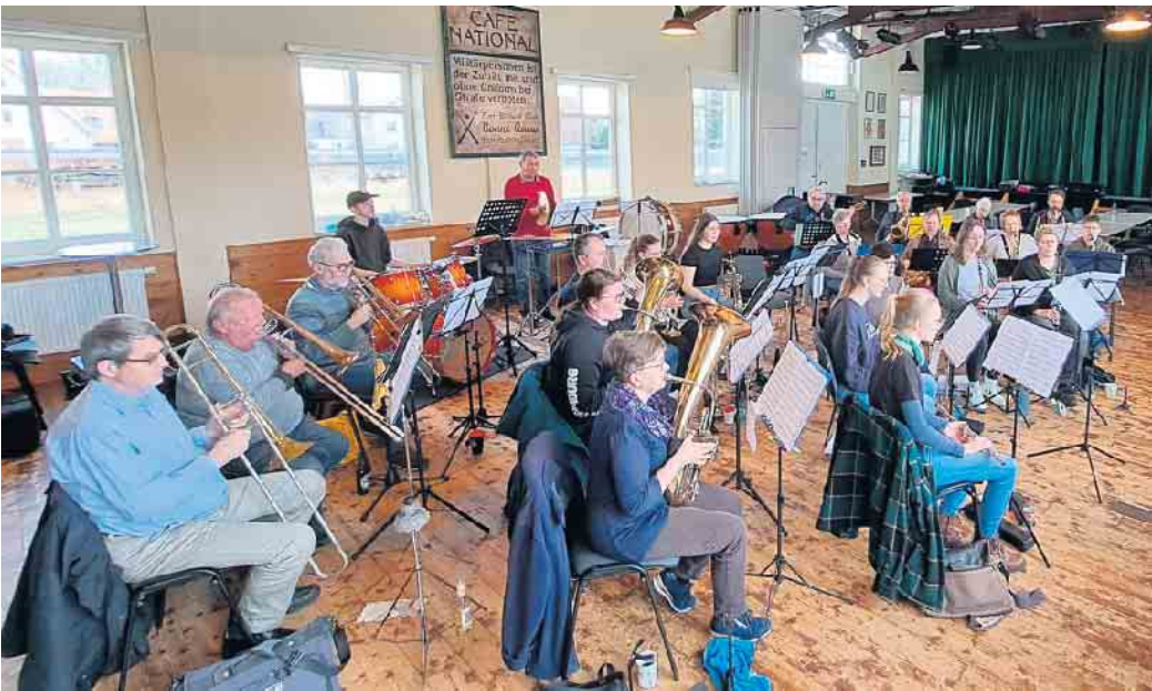
Das Orchester bei der Probenarbeit im Rahdener Bahnhof