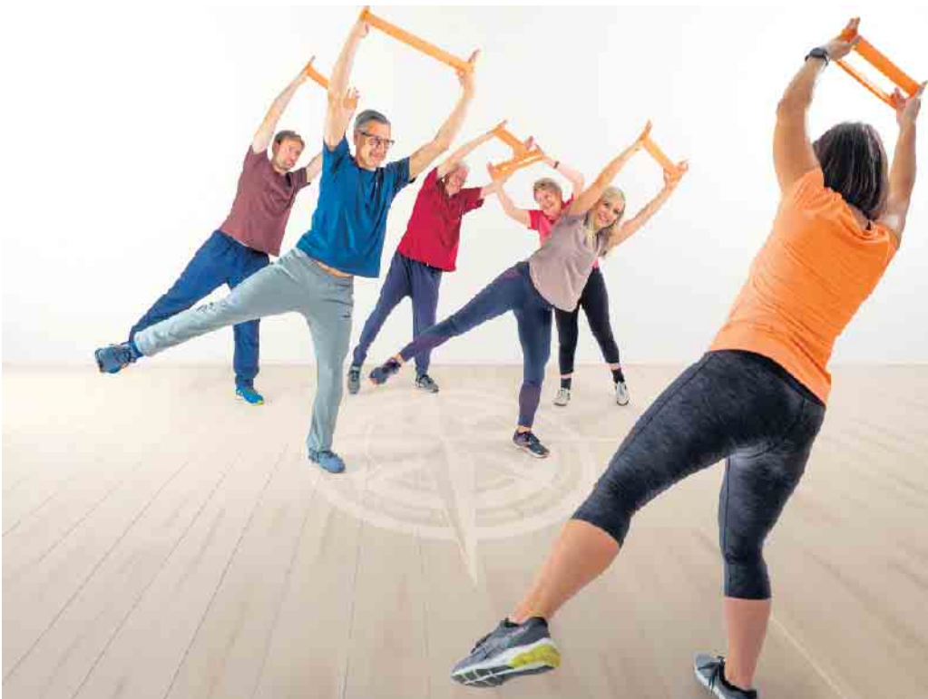
Ganzkörperübungen mit dem Flexiband: Ein gesunder Rücken trägt viel zur persönlichen Lebensqualität bei.

Weitere Veranstaltungen und Infos zum Tag der Rückengesundheit Rund um den 15. März finden bundesweit zahlreiche Vor-Ort- und Online-Veranstaltungen statt. Eine Übersicht bietet der Veranstaltungskalender auf der Webseite zum Aktionstag. Darüber hinaus gibt es dort ein kostenfreies Booklet zum Tag der Rückengesundheit mit ausführlichen Informationen rund um die zehn Empfehlungen sowie ein Gewinnspiel: www.agr-ev.de/tdr