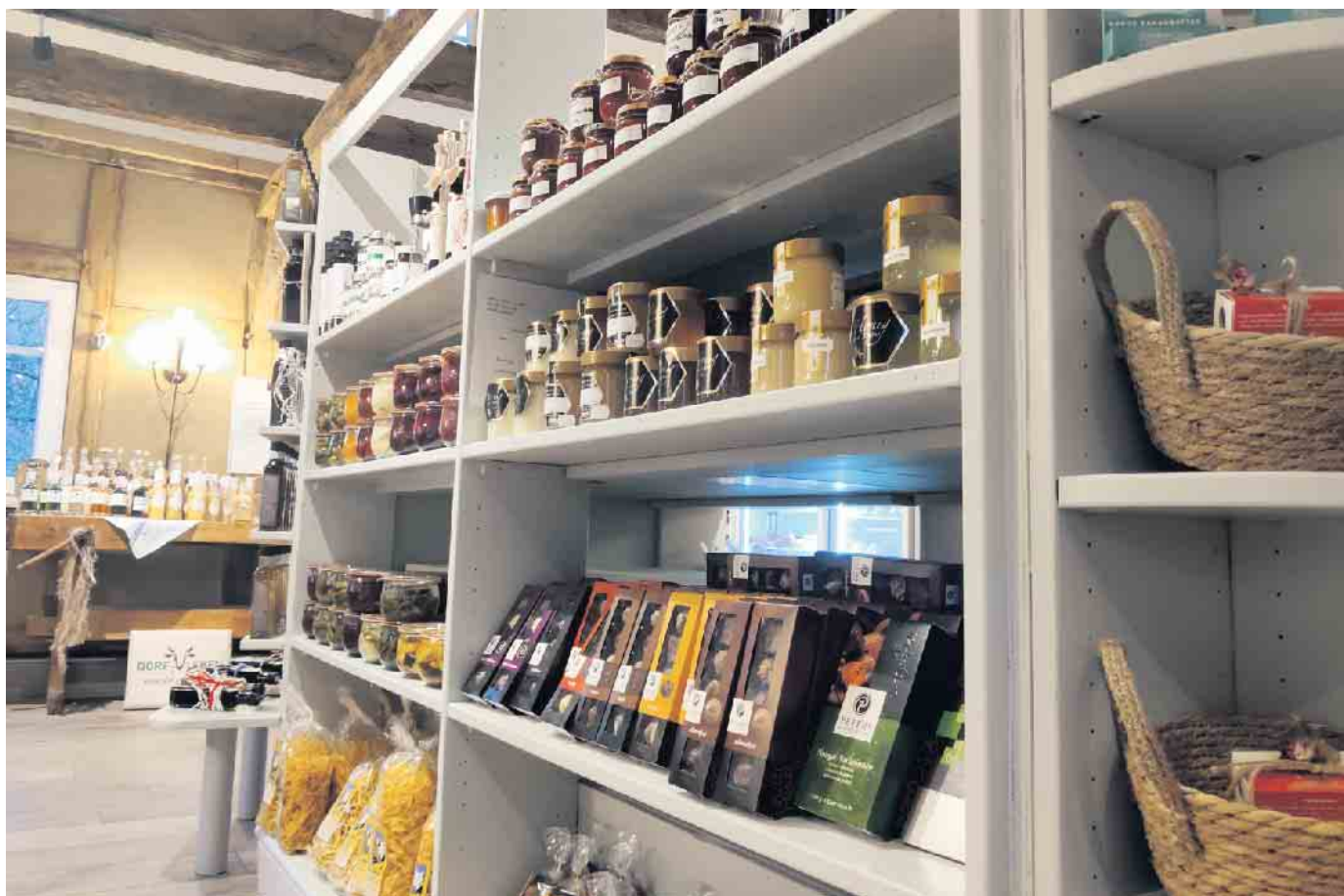
Kleine Besonderheiten für Liebhaber regionaler Qualitätsprodukte - dadurch zeichnet sich das Sortiment von Wehdebrocks Hofladen in Hollwede aus.