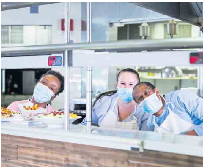
In der Systemgastronomie in Deutschland arbeiten Menschen aus rund 120 Nationen.

und wie diese abgebaut werden können. Mit einer guten interkulturellen Unterstützung der Azubis sorgt die vielseitig und ständig wachsende Branche für starke und erfolgreiche Mitarbeiterinnen und Mitarbeiter und tritt dem Mangel an qualifiziertem Nachwuchs tatkräftig und gezielt entgegen. (djd)