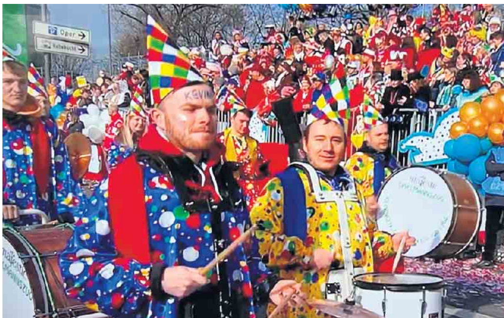
Die Stewweder Spielleute hatten viel Spaß beim Rosenmontagszug in Köln.

zahlreichen Zuschauern hatten sie am Sonntag „Mer lasse den Dom in Kölle“ und am Montag „Schenk mir dein Herz“ auf den Kölner Straßen erklingen lassen. Zu Beginn der vergangenen Woche kamen die Bunten-Blusen-Kostüme