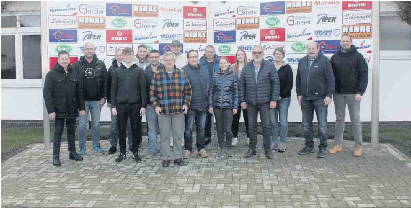
Waffensachkundelehrgang: 13 Teilnehmer und die Dozenten.