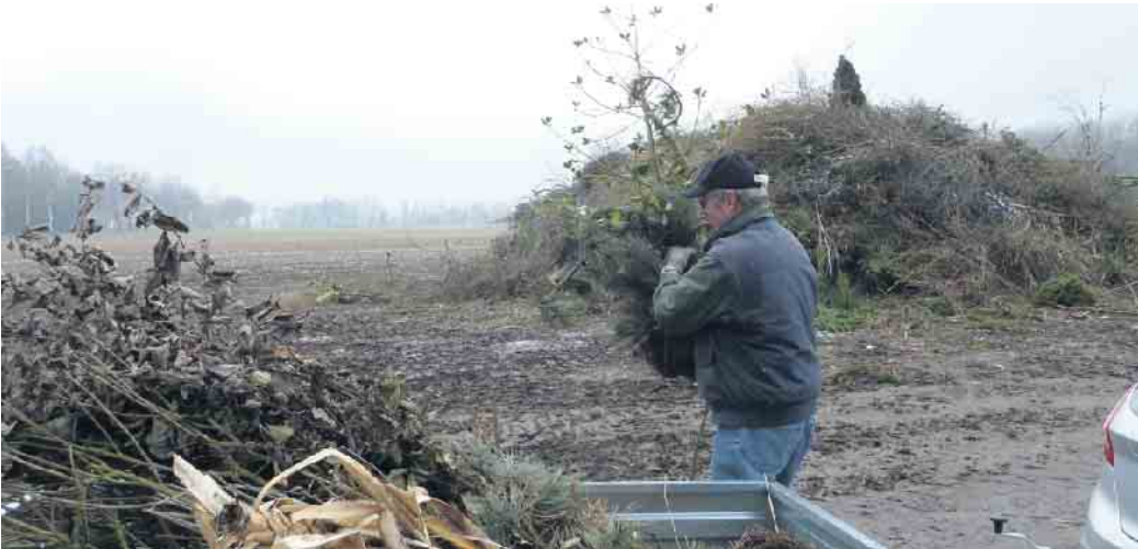
Die Vorbereitungen für das Osterfeuer laufen

Anderes Holz, wie Wurzeln, Stämme, mit Schutzmitteln behandeltes Holz, darf nicht angeliefert werden. Die Feuerwehr überwacht die