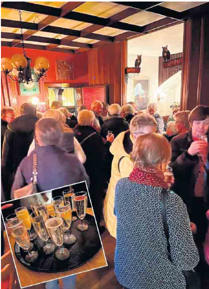
Gute Stimmung herrschte bei der Ladies Night