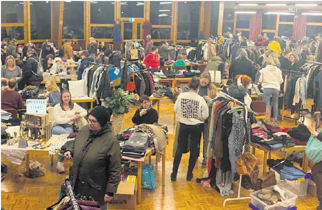
An 63 Ständen nahm die Damenwelt die angebotene gebrauchte Kleidung genau unter die Lupe.

Beim Wehdeimer Frauenflohmarkt gab es eine zweite Chance für Kleidung und Accessoires. Hier durfte gestöbert und gefeilscht werden, um schöne Sachen aus zweiter Hand zu finden. Zwar war die Kleidung getragen aber zumeist im Bestzustand und zu Preisen erhältlich, die einfach nur glücklich machten. Sweatshirts waren ab zwei Euro zu bekommen, Schuhe für drei Euro und Winterjacken ab fünf Euro. „Das sind wirkliche Schnäppchen“, freuten sich die zukünftigen Trägerinnen. Ich nehme immer reichlich Klimpergeld mit zum Flohmarkt. Wäre doch schade, wenn wir ein tolles Teil durch die Lappen geht, nur