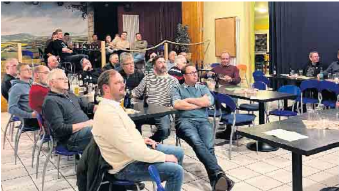
Die Mitglieder des Ortsvereins hörten interessiert zu.