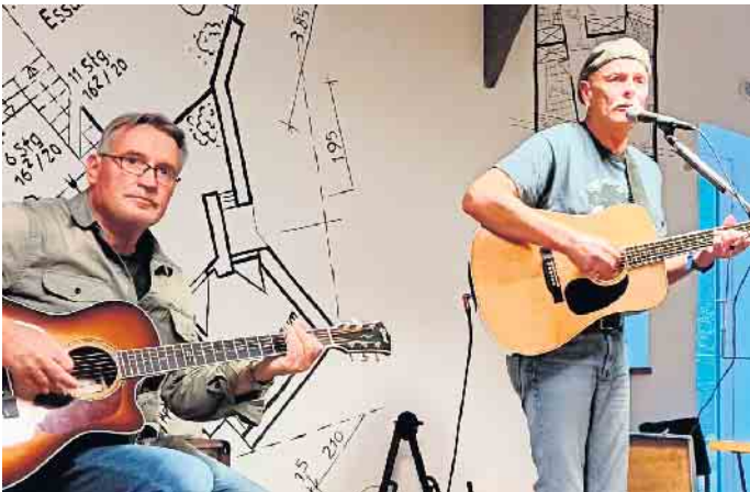
„acoustic time“ spielen bekannte und weniger bekannte Songs aus Folk, Rock und Pop der 60er-Jahre bis heute.

Jetzt geht's rund: JFK Stewwede lädt für den 16. Februar zum 3. Stewweder Kulturkarussell ein