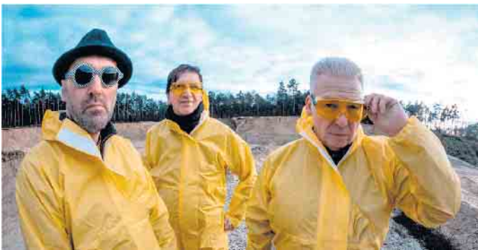
„Goodbye Paranoia“ stehen für schroffe Klanglandschaften. Gitarre, Bass und Schlagzeug sprechen eine ganz eigene, universelle Sprache.