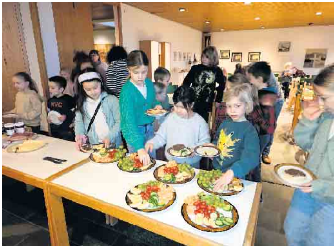
Andrang beim Obst-Büffet

men. So wurden Obstbäume gebastelt oder gemalt und Schlangen gefaltet. In der Spielgruppe ging es unter anderem darum, das verbotene Gummibärchen zu finden und in der Küche wurden Obstküchlein aus Blätterteig hergestellt, die frisch aus dem Ofen vor dem Ende der Kinderkirche verzehrt wurden. Das Kinderkirchen-Team plant, bei einer ähnlich großen Zahl von Teilnehmenden in Zukunft eine vierte Aktionsgruppe anzubieten, um die Inhalte des Kindergottesdienstes noch intensiver und abwechslungsreicher vertiefen zu können. Der Termin für das nächste Treffen der kleinen und großen Kinderkirchen-Fans steht bereits fest. Am Samstag, 22. März, werden sich ab 9 Uhr erneut die Türen des Gemeindezentrums Haldem für hoffentlich viele Kinder öffnen.