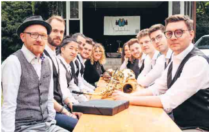
„Das Salopporchester“ ist ein zwölfköpfiges Ensemble, das die bekanntesten Melodien aus Pop, Rock, Jazz und Klassik im unverkennbaren James Last - „Happy Sound“ präsentiert.