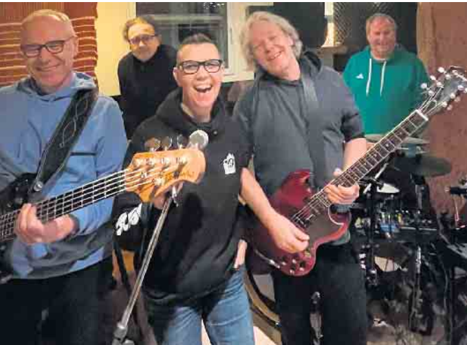
Winchesters Masters of the Muffins

Band ist der Zusammenschluss einiger Jam-Musiker und hat seinen Namen von dem mystischen „Winchester-Haus“, das genauso verwinkelt und magisch ist wie die Musik der Band. Sie spielen Musik, etwas abseits vom Mainstream, die eindringlich und überraschend ist. Es sind verschiedene Songs unterschiedlicher Musikrichtungen. Vorwiegend von Frauen gesungen aus den Achtzigern - von Funk bis Rock und New Wave.