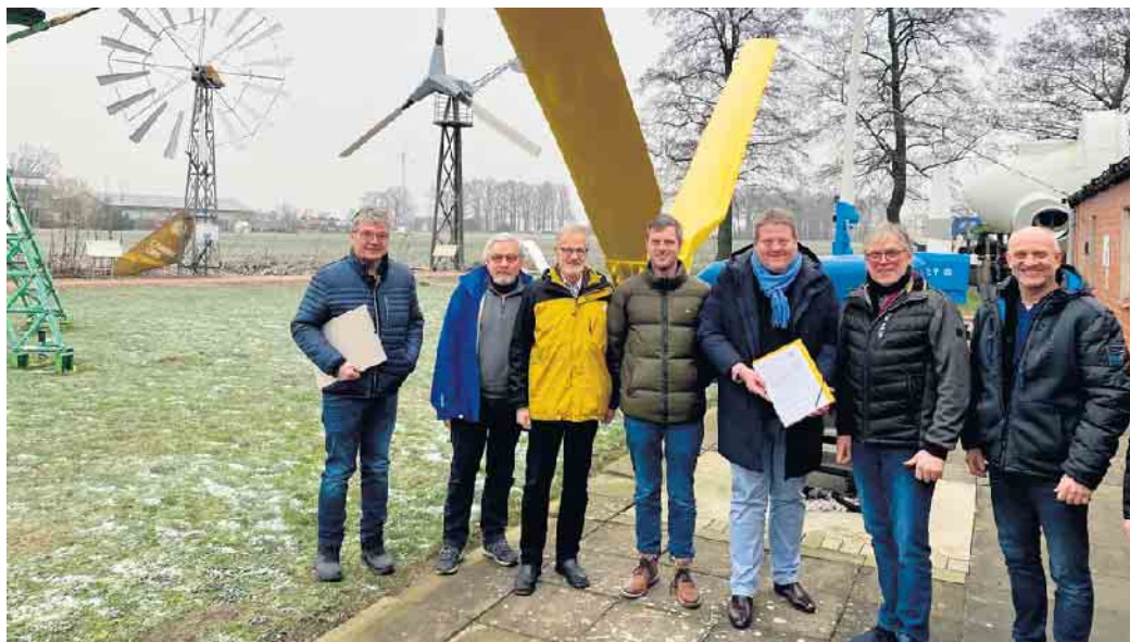
Bürgermeister Kai Abrusztat (5. v. li.) überbrachte den Förderbescheid.

Auf Wunsch des Vereins hatten sich der Bürgermeister und die Mitarbeiter der Verwaltung der Projektidee angenommen, immer in der klaren Haltung, dass sich die Gemeinde aus grundsätzlichen Erwägungen und natürlich auch wegen der Finanzlage selbst finanziell nicht beteiligen könne. Konkret soll nun mit dem Geld vom