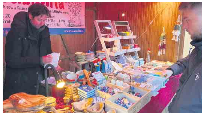
Mit abwechslungsreichem Kunsthandwerk lockten die Aussteller beim Wintermarkt.