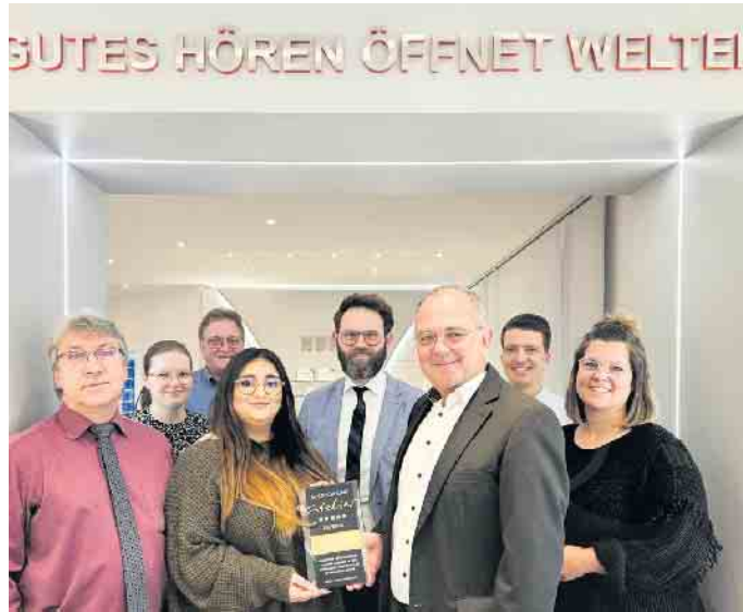
Bedankt sich für das entgegengebrachte Vertrauen: das Hörakustik-Team von HOHN.

Da jeder Mensch unterschiedliche Anforderungen an ein Hörsystem hat, abhängig von Hörverlust und Lebensstil, wird bei einem Besuch in einem Fachgeschäft von HOHN zunächst besprochen, in welchen Situationen die Kunden mehr Hör-