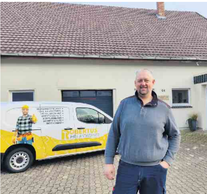
Der Firmensitz in der Stewede mberg-Straße 94 in Wehde m ist eine bekannte Adresse in Stewede. Auf den Firmenwagen steht nun Robertus GmbH - sonst ändert sich nichts.

im Sommer eventuell eine eigene Ausstellung in Wehde m umsetzen. Der Unternehmer ist verheiratet und hat zwei Kinder. Weitere Infos gibt es auch unter der neuen Website: www.robertus-gmbh.de Von Mareile Mattlage