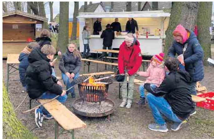
Eine der Attraktionen für die jüngsten Besucher: Stockbrot grillen.

Lembruch (hm). Metallarbeiten oder lieber Handtaschen? Was aus Stoff oder was aus Wolle? Oder duftende Seife? Die Liste der Aussteller, die sich am Wochenende beim Wintermarkt auf dem Gelände rund um den Entenfang nahe dem Dümmer-Museum in Lembruch präsentieren, war lang und versprach den Besuchern kunsthandwerkliche Vielfalt. Sowieso lockte die zweite Auflage des Wintermarktes zahlreiche Gäste an den Dümmer See. Neben abwechslungsreichem Kunsthandwerk galt es gleichermaßen kulinarische Vielfalt zu entdecken. Neben regionaler Wildbratwurst