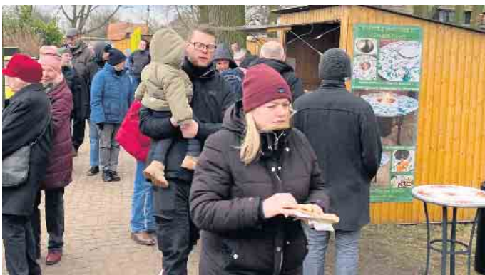
Der Wintermarkt lockte viele Besucher auf das Gelände nahe dem Dümmer-Museum in Lembruch.

Eingeladen zu dem bunten Treiben hatte das Eventteam Lembruch in Kooperation mit dem hiesigen Heimat-Verschönerungsverein. Sie hatten auch für ein musikalisches Rahmenprogramm sowie Kurzweil für die jüngsten Besucher gesorgt. Seine Pforten hatte auch das Dümmer-Museum geöffnet, neben Führungen gab es hier ein buntes Kinderprogramm.