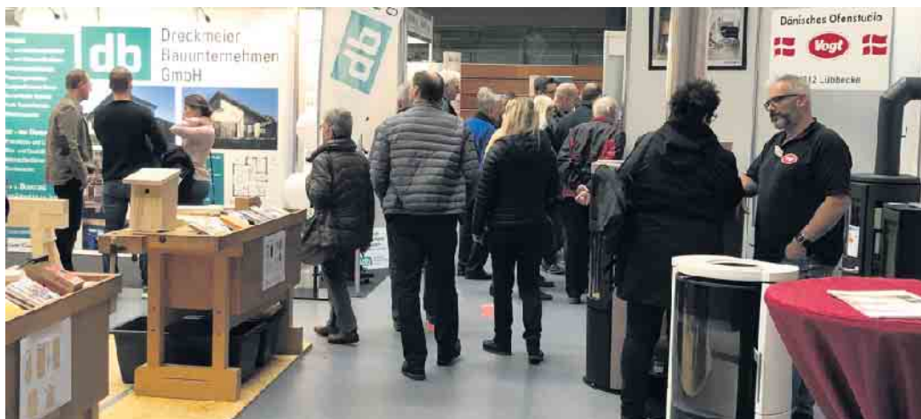
Die letzte Ausstellung verzeichnete gute Besucherzahlen

Ergänzt wird das facettenreiche Angebot des Forums durch praxisnahe Fachvorträge zu aktuellen Themen wie Einsparungen mit Photovoltaik und