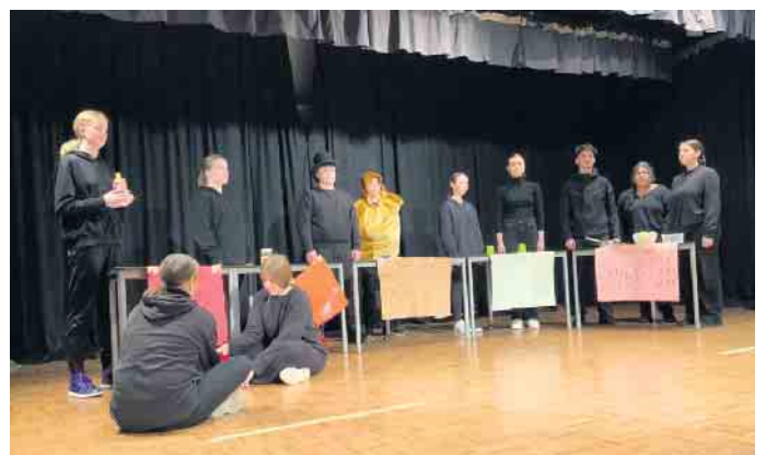
DG Klasse „Ein Traum“