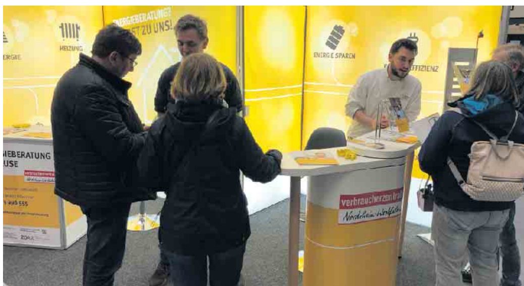
Fachgespräche und Informationen