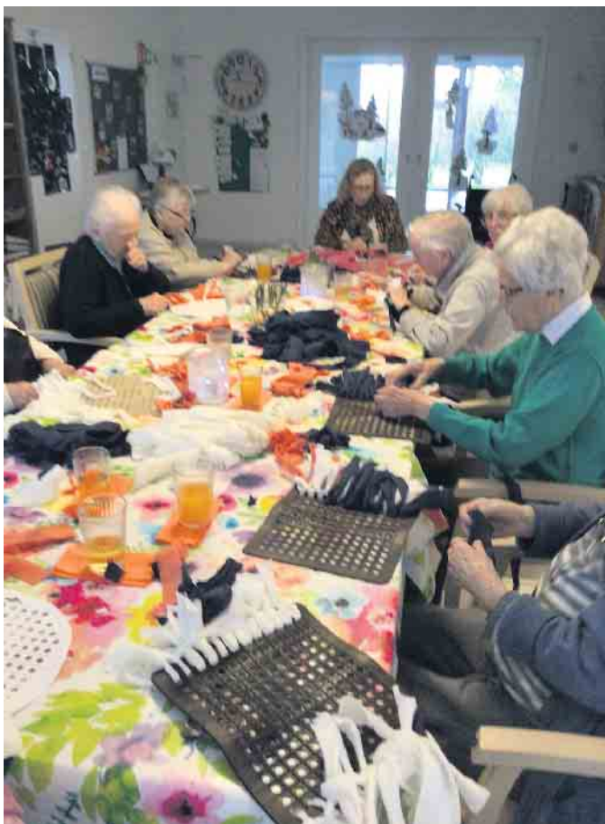
Das Kreativ-Team bei der Arbeit

Dort können sie einen Termin unter Tel. 05772 9797960 vereinbaren.