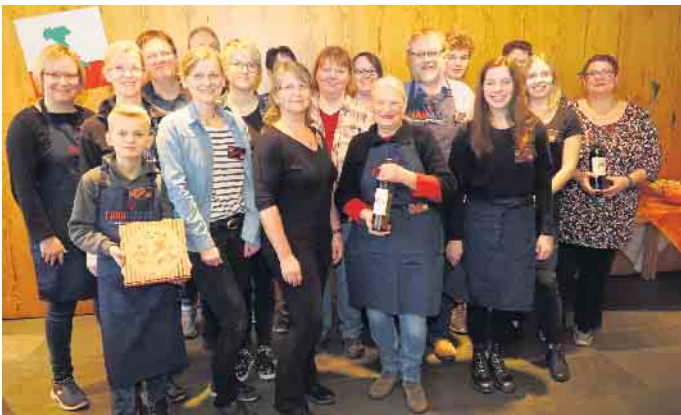
Das Team aus 2020

wohnt, sehr liebevoll dekoriert sein, aber dieses Mal wird man den Verensgeburtsstg in den Räumen auch spüren. Die Gruppe des ehemaligen Dritte-Welt-Ladens Haldem gehört schon lange dem CVJM an. Nachdem die Gruppe Abstand vom Verkauf auf Märkten und Basaren genommen hatte, die Unterstützung des Projektes deshalb aber nicht auch eingestampft werden sollte, musste eine neue Idee her. In anderen Gemeinden gab es bereits schon eine „Pizzeria für Tansania“, warum nicht auch in Haldem den Versuch starten? Mittlerweile backt das Team schon über 20 Jahre jedes Jahr Pizza in Haldem.