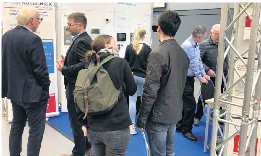
prägen den Ablauf der Ausstellung