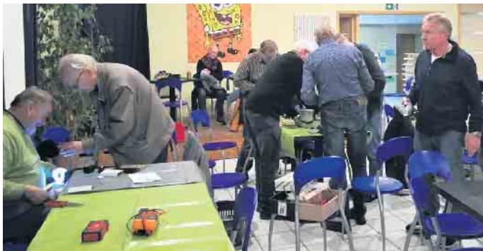
Das Reparatur Café erfreut sich großer Beliebtheit