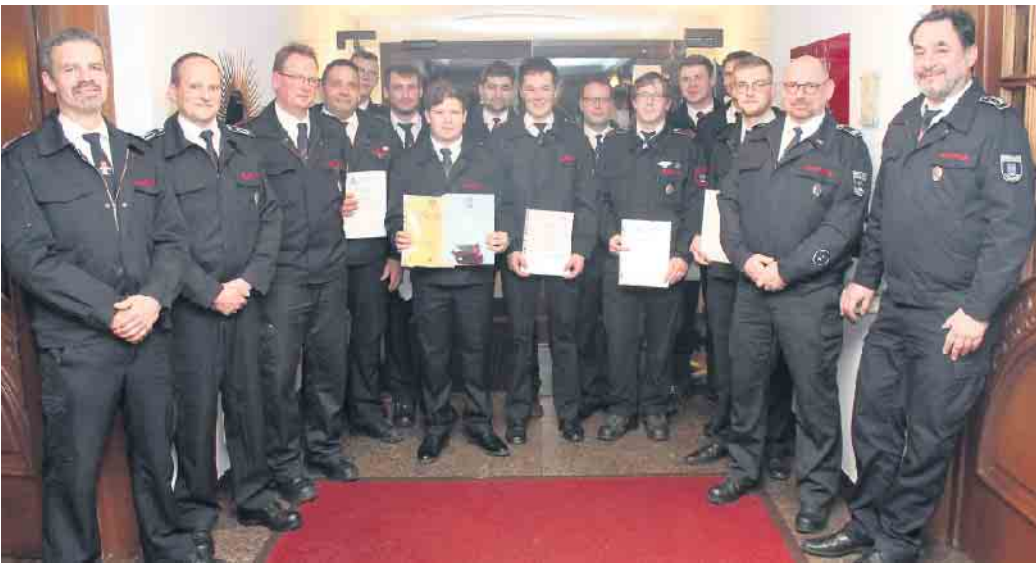
Befördete und Seminarteilnehmer der Löschgruppe Haldem-Arrenkamp mit Verantwortlichen der Steweder Freiwilligen Feuerwehr.

So konnte nach dem weiteren Abflauen der Pandemie in Frühjahr 2022 wieder zum gewohnten Dienst- und Ausbildungsbetrieb innerhalb der Feuerwehr zurückgekehrt werden. Auch traditionelle Veranstaltungen wie der Leistungsnachweis in Hille und das Treffen der Ehrenabteilung auf Kreisebene in der Festhalle Levern konnten wieder stattfinden. Der 2019 geplante Tag der offenen Tür der Löschgruppe konnte im August 2022 realisiert werden.