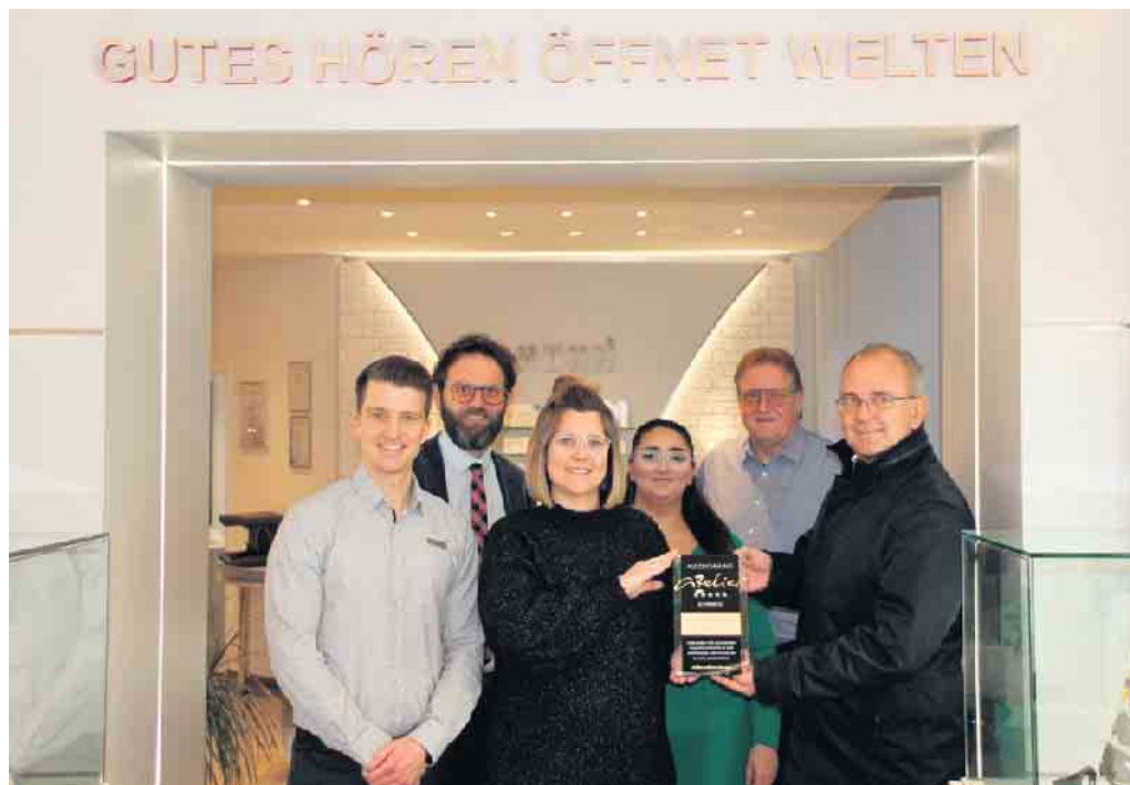
Das Hörakustik-Team von HOHN erhält den Atelier Award

Bei einem Besuch in einem Fachgeschäft der Firma HOHN wird zunächst besprochen, in welchen Situationen sich die Kunden (wieder) mehr Hörkom-