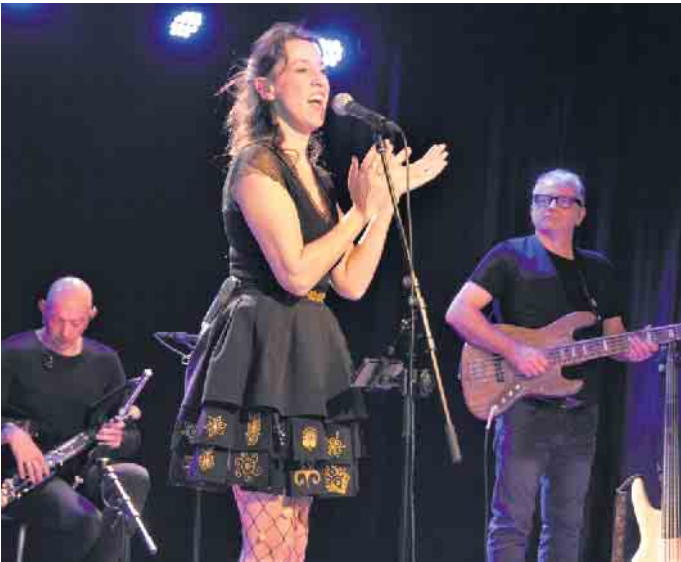
Gwennyn in Aktion

Mit keltischer Musik aus der Bretagne entführten „Gwennyn & Band“ die Besucher im voll besetzten Life House in das Reich der Mythen dieser sagenumwobenen Region im Norden Frankreichs. Gwennyn, die Königin des keltischen Pop, ist heute nicht mehr aus der bretonischen Musik wegzudenken. Bekanntgeworden durch die Zusammenarbeit mit Weltstar Alan Stivell, transportierte Gwennyn die traditionelle bretonische Musik angereichert mit Elementen der Pop und Rockmusik in die Neuzeit und verzauberte damit die Besucher im Life House. Auch wenn kaum jemand der Besucher die bretonisch gesungenen Texte verstanden haben dürfte, so zog die sympathische Bretonin zusammen mit ihrer vierköpfigen Band die Besu-