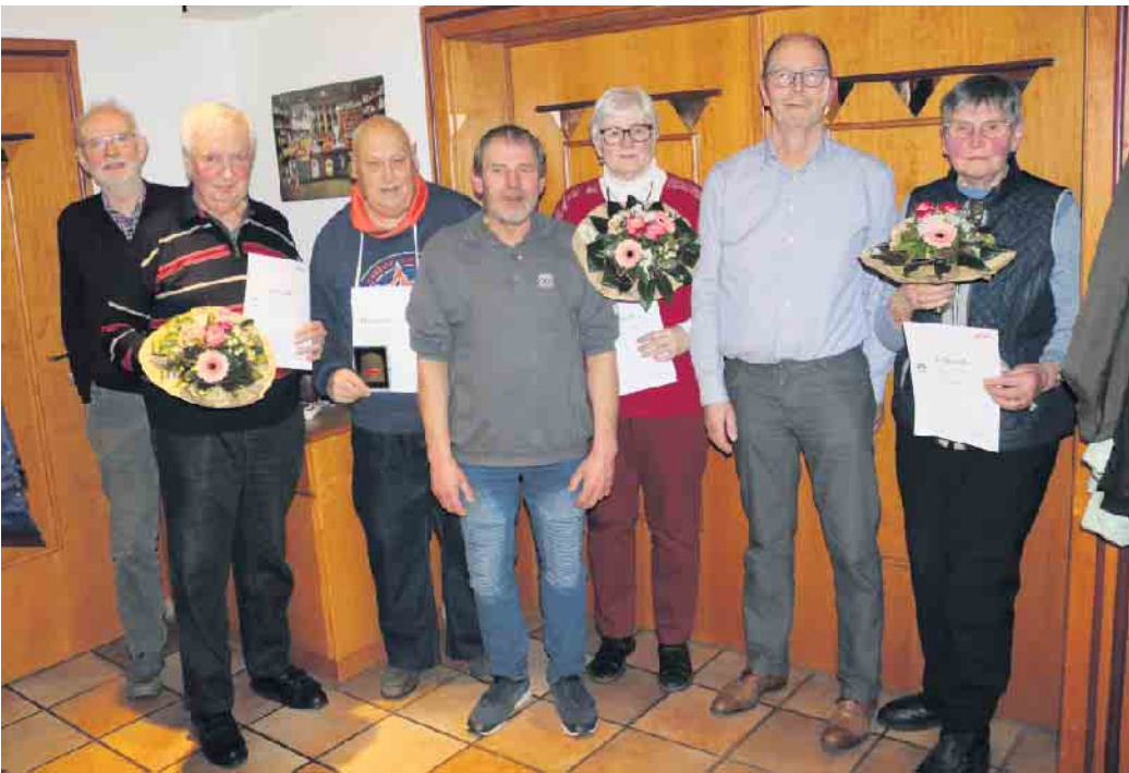
Die geehrten Mitglieder