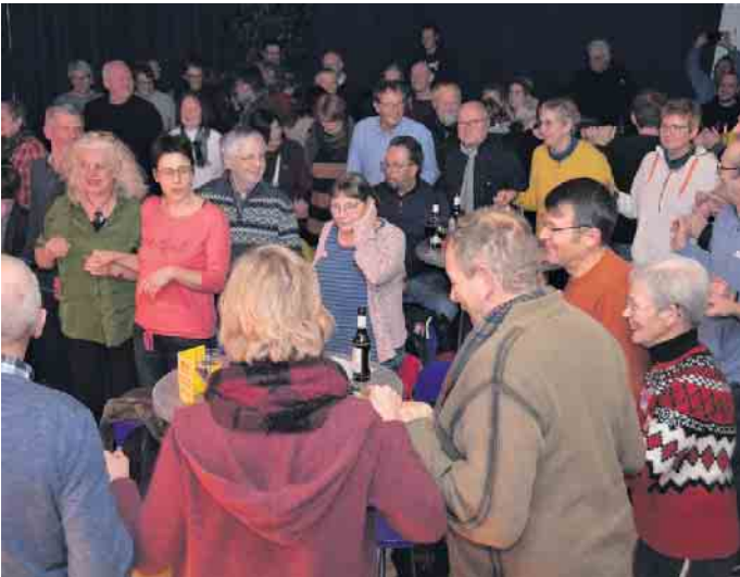
Das zahlreiche Publikum war begeistert und ging voll mit

cher von Anfang an in ihren Bann. Mit dazu beigetragen haben sicherlich auch die liebevollen Ansagen der Lieder in Deutsch und die ausführlich Beschreibung über den Inhalt. Sie erzählte von ihrer Heimatstadt, vom Meer und von den Bergen, die nicht sonderlich hoch, dafür alt sind. Mit ihrer Band spielte die mehrfach ausgezeichnete Sängerin traditionelle Lieder und Eigenkompositionen. Typisch bretonische Instrumente wie die Bombarde und ein Dudelsack gaben den Liedern einen mystisch anheimelnden Klang. Durch den Einsatz von Gitarre und Bass wurde den Liedern aber ein modernes Gewand verpasst, wenn auch immer die Welt der Sagen und Mythen der Bretagne präsent blieben. Besonders die schnelleren Lieder gefielen dem