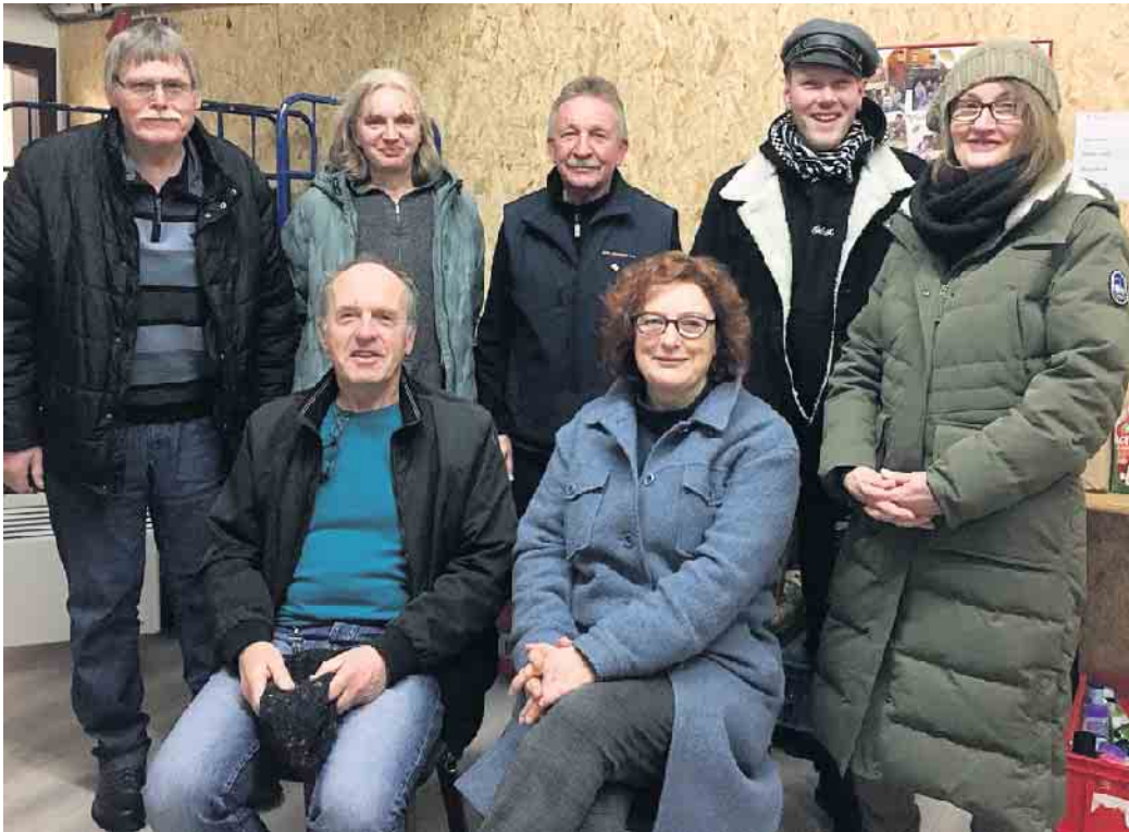
Die Grünen besuchten die neuen Räumlichkeiten der Tafel