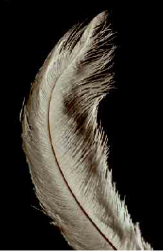
Nahaufnahme einer Feder