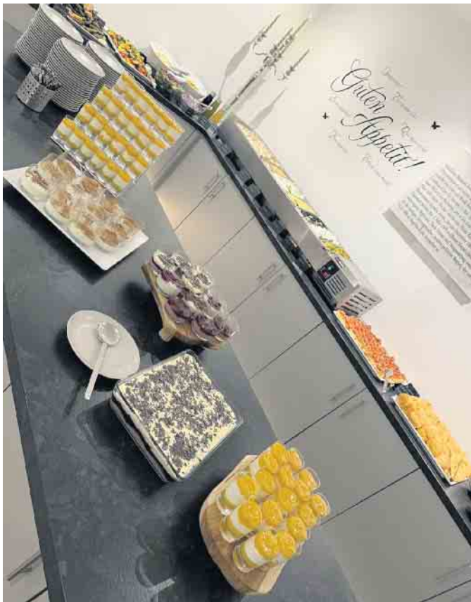
Das Konzept „schmeckt“ den Besuchern: Ein Blick in die Küche des „Asmin“ zeigt das reichhaltige und kreative Buffet und die selbstgemachten mediterranen Speisen, durch die sich das Restaurant auszeichnet.

Weitere Informationen gibt es online unter www.asmin-restaurant.de oder bei Instagram @asmin.restaurant.events