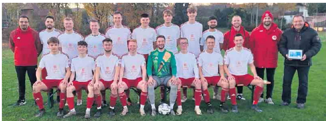
Das Team sowie Vereinsoffizielle bedankten sich herzlich mit einem Gutschein für die großzügige Spende des schicken Sport-Outfits.