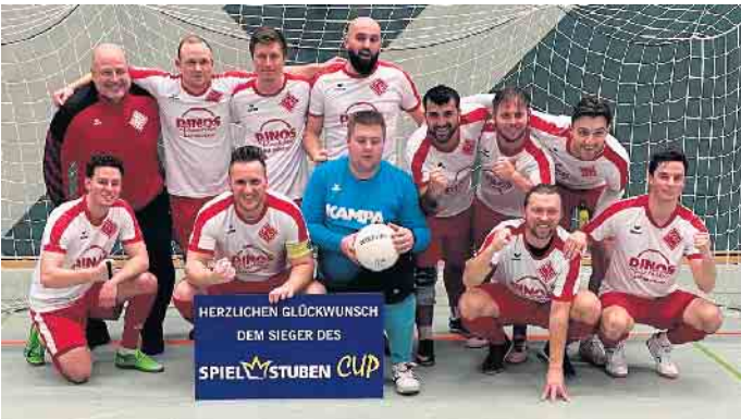
Das Kreisligaturnier gewann FT Dützen II mit einem hartumkämpften Sieg.

Bohmte/Ostercappeln/Schwagstorf erneut behaupten und gewannen gegen die Damen von der Lembruch/Damme III mit einem Ergebnis von 2:3.