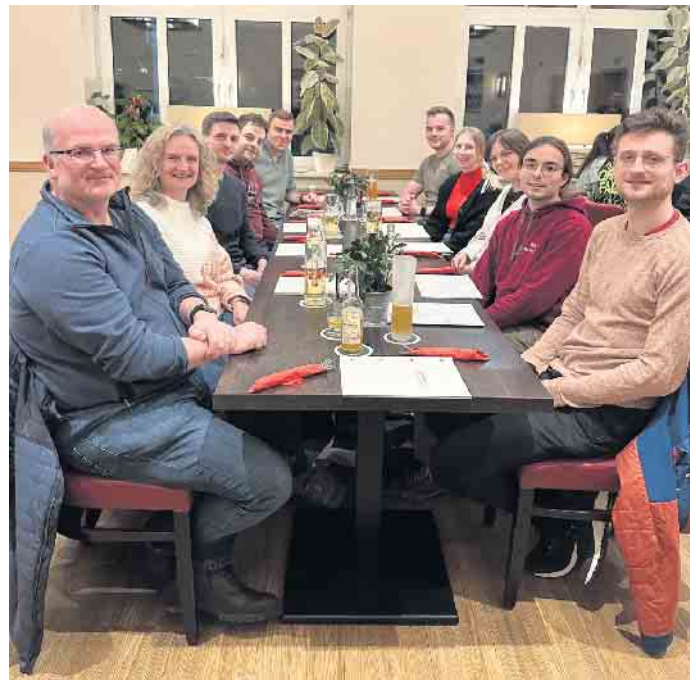
Nach der Jahreshauptversammlung im Online-Format trafen sich ortsansässige Vereinsmitglieder zum gemütlichen Ausklang bei Schneiders am Museumshof.

Der Verein bittet diese beiden Jahrgänge, sich mit ERA in Verbindung zu setzen. Eine große Bitte geht auch an die Eltern der beiden Jahrgänge, die Information weiterzugeben. E-Mail: vorstand@era-ev.de