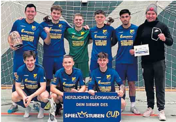
Der niedersächsische Landesligaspitzenreiter TSV Wetschen hat das Hauptturnier um den Spielstuben-Cup 2025 gewonnen.

sicherte sich neben dem Spielstuben-Cup-Wanderpokal noch die Siegpriämie von 250 Euro. Die unterlegenen Gäste aus dem benachbarten Kreis Herford konnten sich mit 150 Euro trösten. Auf dem dritten Rang landete wie im Vorjahr der TuS Lemförde (100 Euro)