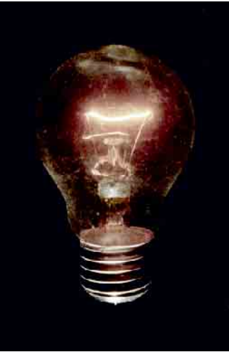
Nahaufnahme einer Glühbirne

spezielle Bildeffekte. Es ist keine Spezialausrüstung nötig, um gelungene Nah- und Makrofotos zu erreichen. Die Tipps und Tricks, die in diesem Kurs vermittelt werden, gelten dabei gleichermaßen für analoge wie digitale Aufnahmen, vieles ist schon mit der Handykamera umsetzbar. Anmeldung unter anmelden.life-house.de oder telefonisch unter 05773-991401.