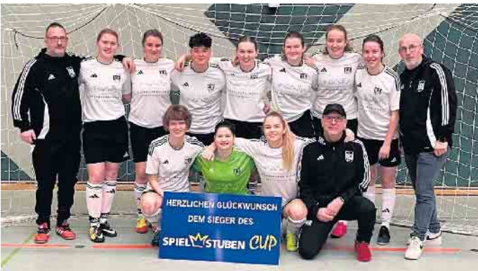
Im Damenturnier konnten sich die Vorjahressiegerinnen von der SG Bohmte/Ostercappeln/Schwagstorf erneut behaupten.