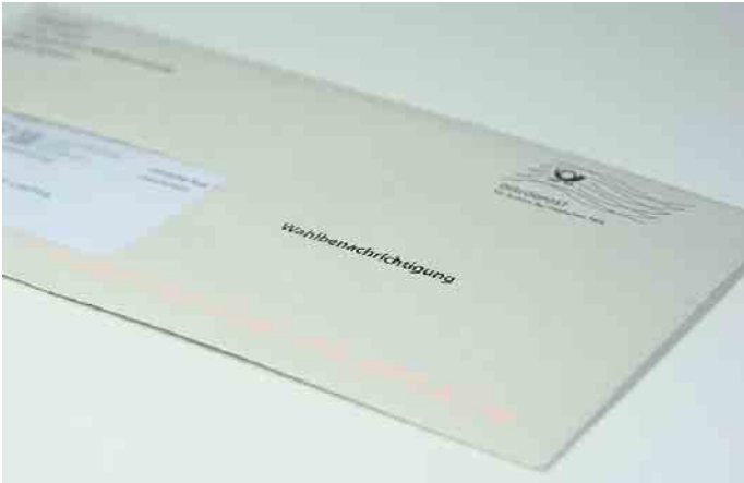
Die Kommunen können die Briefwahlunterlagen aufgrund der für die Stimmzettel geltenden Liefertermine voraussichtlich erst ab dem 10. Februar an die Wählerinnen und Wähler versenden (Symbolbild).

Einwurf im Rathaus: Wer seine Briefwahlunterlagen schriftlich beantragt und zugesandt bekommen hat, kann sie entweder mit der Post zurückschicken oder die Briefwahlunterlagen im Rathaus abgeben oder am Rathaus einwerfen. Jedes Rathaus hat einen 24-Stunden-Briefeinwurf, der auch hierfür genutzt werden kann.