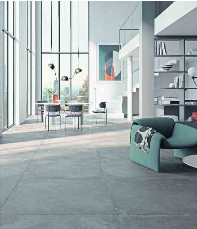
XXL-Fliesen im trendigen Estrich-Look schaffen Großzügigkeit in offenen Wohnkonzepten.

mutung liegen wohnliche Oberflächendekore wie Natursteininterpretationen oder authentische Holzanmutungen im Trend. Mutige können offenen Räumen auch mit kräftigen Farben und Kontrasten Charakter und Persönlichkeit verleihen - zum Beispiel mit historischen Dekoren in Look von Zementfliesen. (DJD)