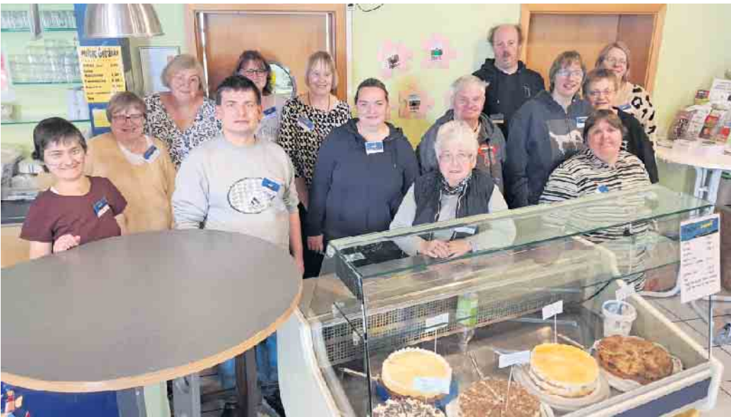
Team Cafe House Wehdem

Das „Café-House Wehdem - Klönschnack am Sonntagnachmittag“ öffnet wieder seine Pforten und lädt ins Life House ein. Bei duftendem Kaffee, frisch gebackenen Waffeln, Torten und Kuchen können Spaziergänger und Sonntagsausflügler von 14 bis 17 Uhr verweilen und klönen. Das Café-House Wehdem wird durch die Kooperation der Lebenshilfe Lübbecke mit dem JFK Stewede e.V. möglich. Das Café-Team besteht aus Menschen mit und ohne Behinderung, die sich hier seit 2012 gemeinsam für „ihr“ Café-House-Projekt engagieren: Nicht die Perfektion zählt, sondern das gemeinsame Handeln. Ob Waffeln backen, Kaffee einschenken oder Tortenstücke verteilen - jeder hat seine Aufgabe gefunden. So haben auch Menschen mit einem Handicap die Möglichkeit sich in ihrer Freizeit für andere zu engagieren. Wehdem. Das Café-Team freut sich auf seine Stammgäste und auf neue Besucher jeden Alters.