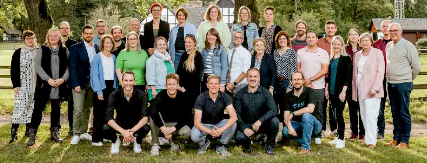
Der Abiturjahrgang 2004 feierte beim Sommerfest von ERA sein zwanzigjähriges Abiturjubiläum.

Ehemaligenverein ERA e.V. des Gymnasiums Rahden zieht Bilanz und wählt - Abiturjahrgang 2004 feiert zwanzigjähriges Abiturjubiläum