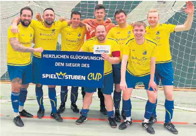
Die dritte Mannschaft des veranstaltenden TuS Dielingen hat zum ersten Mal das Kreisklassenturnier gewonnen.

Spielstuben-Cup 2025: TSV Wetschen sichert sich im Hauptturnier den Wanderpokal