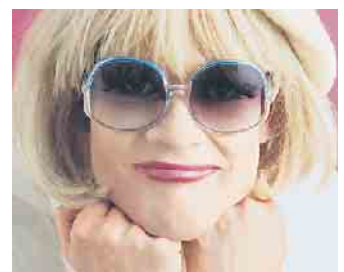
Eine Berliner Schnauze mit Herz und Verstand: Irmgard Knef präsentiert ihrem Publikum brandneue, groovige Songs voller Swing und Jazz und Highlights aus ihren Soloprogrammen.

Der Eintritt kostet 69 Euro inklusive Apéritif und Dreigangmenü. Ticketbestellungen online unter: www.kul-tuer.de