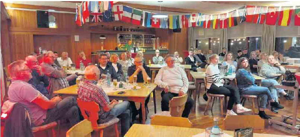
Wie traditionell bei der Helferfete üblich, gab es neben Getränken und Essen auch den aktuellen Turnierfilm zu sehen.

Wehdem. Viele Helfer des Stewweder U19-Turniers waren der Einladung des Turnier Teams zur Helferfete gefolgt. Die Organisatoren nutzen die Möglichkeit, sich erneut bei den Helfern für ihren unermüdlichen Einsatz zu bedanken. Neben dem U19 Turnier, dem VolksbankPlus-Cup, und dem Lebenshilfe-Cup stand im Mai auch das 50. Vereinsjubiläum des TuS Stewwede auf dem Programm. Alle Helfer sorgten dafür, dass die Gäste von nah und fern erneut auf dem Sportgelände in Wehdem schöne Stunden verbringen konnten. Wie traditionell bei der Helferfete üblich, gab es neben Getränken und Essen auch den aktuellen Turnierfilm zu sehen. Hier wurden Einblicke in die vergangene Ausgabe gezeigt, dies rief Erinnerungen wach und sorgte für manchen Lacher unter den Helfern.