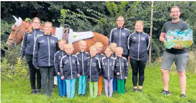
Die kleinsten Voltigierer des Reitvereins Wehdem-Oppendorf können nun einen komplett neuen Satz Trainingsjacken ihr Eigen nennen.

Wehdem/Oppendorf. Für die kleinsten Voltigierer des Reitvereins Wehdem-Oppendorf gab es eine großzügige Spende. Sie können nun einen komplett neuen Satz Trainings-