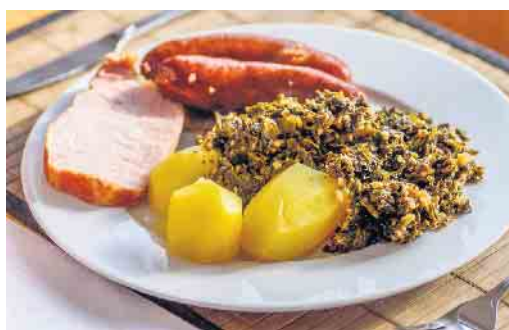
Tradition der Kohlfahrt: Nach der Bollerwagen-Tour wird im Gasthaus mit Grünkohl, Kartoffeln, Pinkel und Kasseler ordentlich aufgetischt. (Symbolbild)

Eigenes Schnapsglas: Wer sein Schnapsglas nicht mit der Spucke von zehn anderen Personen teilen will, muss sich ein eigenes „Pinneken“ mitbringen. Um dieses nicht zu verlieren, eignet sich ein Band um den Hals. Hinweis: Sollte das Glas irgendwann dennoch verloren oder kaputt gehen (was wahrscheinlich ist), werden zu fortgeschrittener Stunde auch Schlücke direkt aus der Schnapsflasche von den