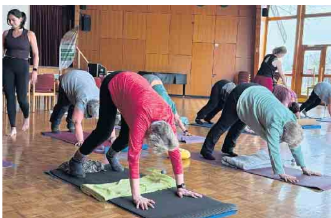
Der „Herabschauende Hund“ gehörte zu den Yogaübungen, die die Landfrauen testen durften.

Vorträge zu Ernährung, Fasten und Achtsamkeit vervollständigten das Angebot. Und weil so viel Bewegung und Kopfarbeit hungrig machen, gab es eine Kaffeepause direkt nach dem Fasten-Vortrag, allerdings nicht mit Torten und anderem Hüftgold, sondern mit gesunden selbst gemachten Snacks der Twiehäuser Landfrauen.