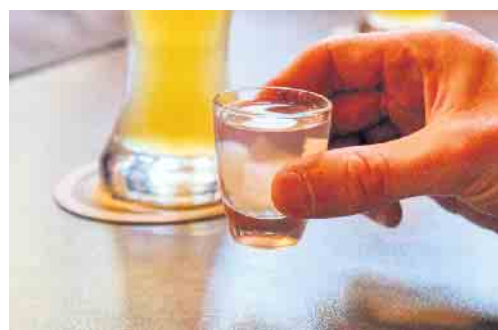
Tipp: Besinnen Sie sich auf die Klassiker: Schnaps und Bier. Nur klares ist Wahres! (Symbolbild)