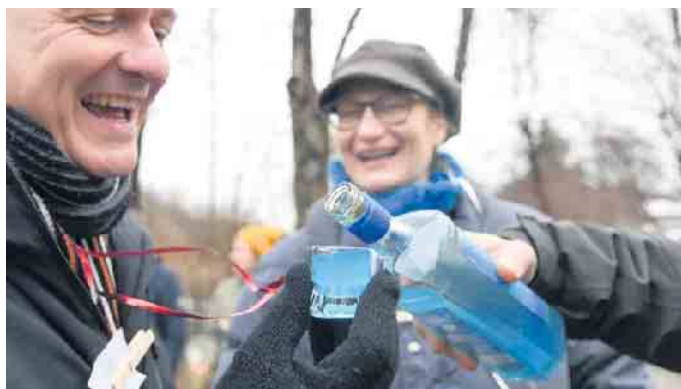
Wer sein Schnapsglas nicht mit der Spucke von zehn anderen Personen teilen will, muss sich ein eigenes „Pinneken“ mitbringen. Um dieses nicht zu verlieren, eignet sich ein Band um den Hals.

Jackentasche: Am nächsten Tag lohnt sich ein Blick in die Jackentasche. Oft ist ein Potpourri aus kleinen Andenken der letzten Nacht vorzufinden: ein halbleerer, klebriger Kurzer, ein angebissenes Mettenden-Stück, das zerrissene All-inclusive-Bändchen vom Gasthaus und die Visitenkarte vom DJ. Den wollten Sie vermutlich unbedingt für die nächste Geburtstagsparty buchen. Also machen Sie sich ruhig schon mal an die Planungen hierfür. Das steigert die Laune und vertreibt die Reue über die vergangene Nacht.