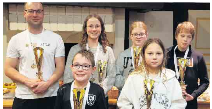
Stolz auf ihre Leistungen und Erfolge: Die Vereinsmeister 2024 der TV01-Bohmte Schwimmsparte mit ihren verdienten Pokalen und Medaillen.