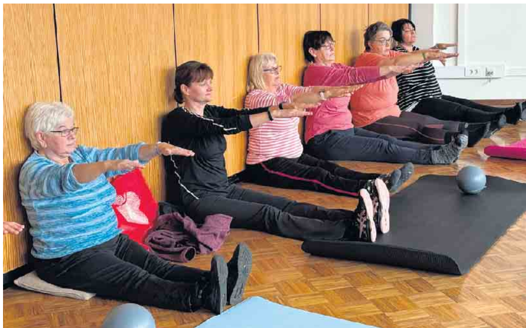
Gar nicht so einfach! Die Übungen der Rückenschule überraschten die Landfrauen.

Seien es kraftvolle Bewegungen und Verweilen in Übungen mit lustigen Namen, wie „Cobra“ oder „Herabschauender Hund“, die