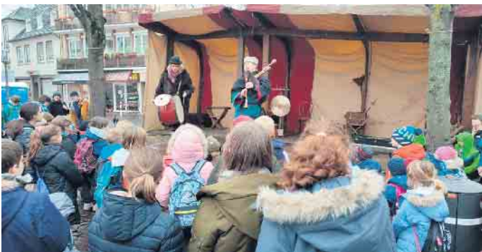
... sowie die entsprechenden Instrumente

schulstoffergänzenden Erfahrung den Jugendlichen viel Freude macht und viel mehr Lerneffekt hat, als es der bloße theoretische Unterricht vermitteln könnte.