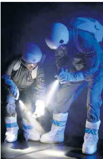
Unsere Schüler*innen fiebern bei der Suche nach Laika mit.