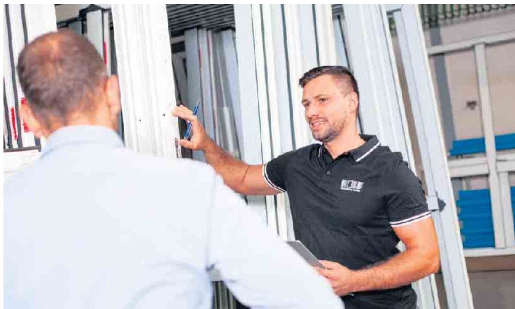
ROLF Fensterbau - Ihr kompetenter Rundum-Service zum Thema Schallschutz