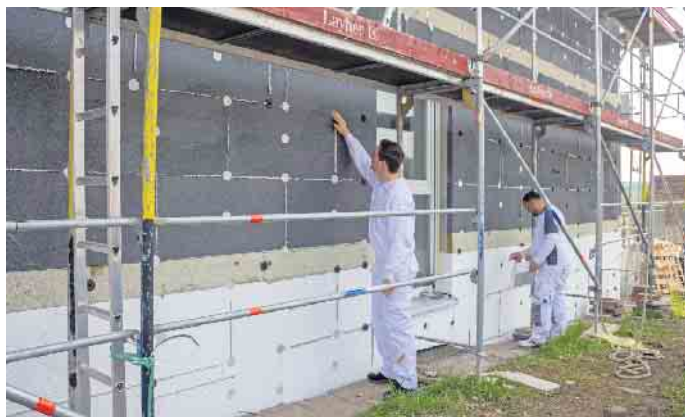
Angesichts hoher Energiepreise amortisiert sich das energetische Sanieren noch schneller.

tiger Technik nach Jahrzehnten der Nutzung anschließend recycelbar. (djd)