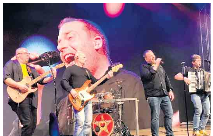
Garanten für Kölschen Party- und Schunkelalarm: „Sternrocker“.