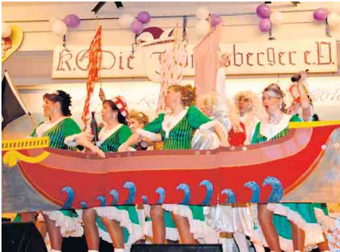
Grandioses Tanztheater zeigen die „Poppelsdorfer Schloss-Madämcher und Schloss-Junker“ Bonn.

Lila-Weiße KG zündet „Feuerwerk der Guten Laune“