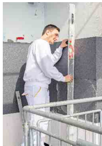
Dämmen durch den Profi: Die fachgerechte Ausführung stellt Langlebigkeit und Wirksamkeit des Wärmeschutzes sicher.

rungsfahrplan aufstellen, der exakt für die vorhandene Bausubstanz passende Empfehlungen abgibt. Damit sind aus der Bundesförderung für effiziente Gebäude (BEG) Zuschüsse von bis zu 25 Prozent der Gesamtinvestitionen möglich. Beispielsweise unter www.mit-sicherheit-eps.de gibt es dazu viele weitere Informationen und Tipps für Hauseigentümer. Die Dämmung mit Hartschaum wie expandiertem Polystyrol (EPS) zählt zu den seit Jahrzehnten bewährten Verfahren. Das Material verbindet eine hohe Dämmleistung mit leichter Verarbeitbarkeit und geringem Gewicht - wichtig gerade für die Altbausanierung. Zudem ist das Material langlebig, sicher und dank heu-