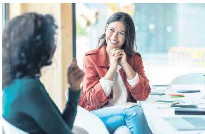
Ein Bewerbungsgespräch ist immer ein Dialog, bei dem auch der Arbeitgeber auf dem Prüfstand steht.