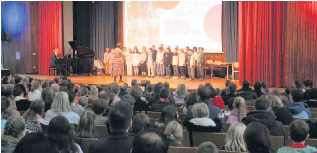
Die Besucher beim Programm in der Aula.

Den Tag der offenen Tür am Anno-Gymnasium nutzten viele Besucher, um die Schule kennenzulernen und sich zu informieren. Über 400 Gäste konnten ein kurzweiliges Programm sehen. Natürlich stellten sich die Schulleitung sowie die Eltern- und Schülervertretungen vor, aber besonders Schulhund Haylee begeisterte die jungen Gäste. Der Chor gab mit seinem gelungenen Beitrag einen Vorgeschmack auf die AG-Möglichkeiten am Anno wie auch die Unterstufen-Theater-AG, die die Stimmung mit einem lustigen Weihnachtsstück auflockerte. Zu viele Reden sollten es ja auch nicht sein, denn dem Anno war daran gelegen, vor allem den Kindern der 4. Klassen die Schule vorzustellen und ihnen einen Eindruck von der Atmosphäre zu vermitteln. Die Lehrkräfte hatten im Vorfeld mit ihren Schülerinnen und