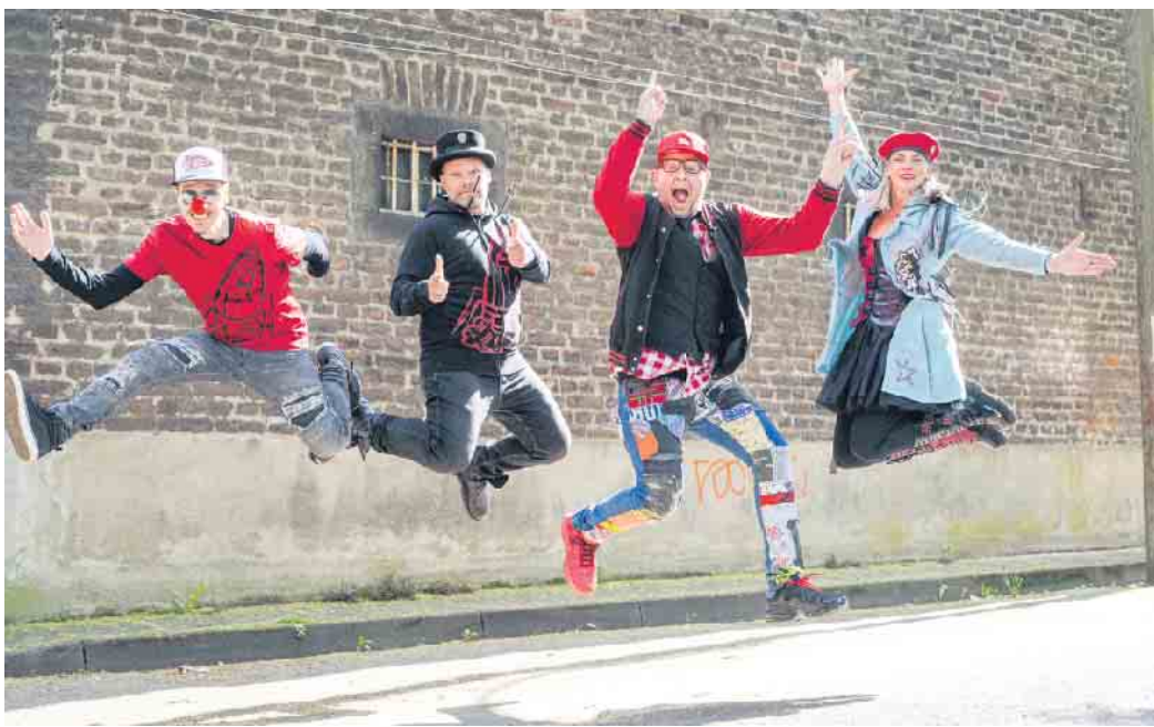
Für Riesenstimmung sind erstmalig die Polonaise-Raketen „Kommando 3“ auf Siegburger Bühne dabei. i Foto: Kommando 3

Noch auf der Suche nach einer originellen Geschenkidee zum Weihnachtsfest? Die KG „Die Tönnisberger“ 1968 e. V. bietet einen tollen Tipp für Wunschzettel und Gabentische an. Verwöhne dich, deine Liebsten und Freunde mit einem hochamüsanten Abend in 2025. Unter dem Motto „Et danz de Stroß un tobt dä Saal, jo dat es Siehburjer Karneval“ laden die „Lila-Weißen“ zur Großen Prunksitzung mit Knallerprogramm und Verleihung des Rheinlandordens „Das Goldene Herz 2025“ an den sozial engagierten „Tupples vum Land“ am Samstag, 18. Januar 2025 , alle Karnevalsfreunde ins Siegburger Rhein Sieg Forum,