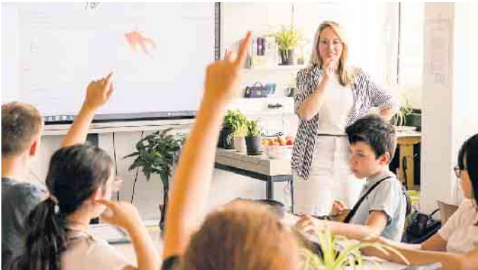
Digitale Technik ermöglicht spannenden Unterricht in der Gesamtschule.

stürchen“ weist auch der Instagram-Adventkalender der fcggs am 13. Dezember auf den neuen Webauftritt hin und verbindet das Ganze mit einem kleinen Gewinnspiel. Beantwortet werden soll die Frage: Welches Jubiläum feiern die Freien Christlichen Schulen im Jahr 2025? Aus allen richtigen, bis zum 19. Dezember eingegangenen Rückmeldungen (über Instagram oder über eines der Kontaktformulare auf der Website) wird am 20. Dezember, dem letzten Schultag vor den Weihnachtsferien, der Gewinner/die Gewinnerin ausgelost. Der Erstplatzierte erhält einen Wertgutschein über die Anmeldegebühr in Höhe von 50 Euro. Damit entfällt die obligatorische Anmeldegebühr bei der Anmeldung eines Kindes an einer unserer Schulen. Der 2. Gewinner erhält eine hoch-