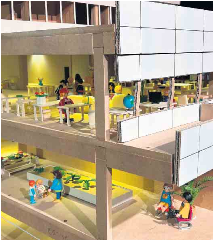
Auf jeder Etage gibt es etwas neues zu entdecken.

Ähnliches sagte auch Bürgermeister Rosemann, der sich dennoch über die Initiative der drei Absolventen freute, denn schließlich müsse man in der aktuellen Situation in viele verschiedene Richtungen Denken. Dabei helfe die Idee der Absolventen. (pho)