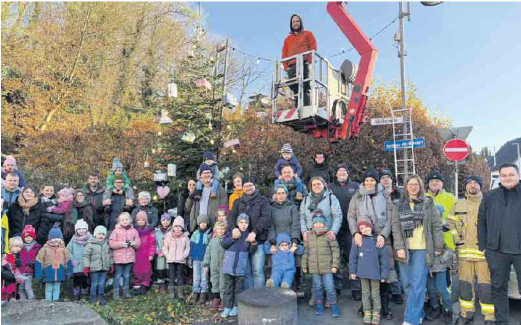
Gemeinsam geschmückt: Die Kinder der KiTa „Pauline“ mit ihren Eltern sowie der Abordnung der Wolsdorfer Löschgruppe III und den bewirtenden Junggesellen der „Eintracht“ vor dem Dorf-Weihnachtsbaum von Alt-Wolsdorf

Unterstützung für diese vorweihnachtliche Aktion erfuhr der JGV Alt-Wolsdorf dankenswerterweise auch in diesem Jahr wieder von der Stadt Siegburg, die den für diese alljährlich sehr schöne Advent-Aktion benötigten Hublift zur Verfügung stellte, und von der Wolsdorfer Löschgruppe III der Freiwilligen Feuerwehr, die diesen personalmäßig besetzte und bediente: Vom Hublift aus wurden zunächst die Lichterkette angebracht und sodann in luftiger Höhe die oberen Regionen des Tannenbaums geschmückt, während die Kinder den in der KiTa selbst gebastelten Baumschmuck zu stimmungsvoll erklingender Weihnachtsmusik gemeinsam mit ih-