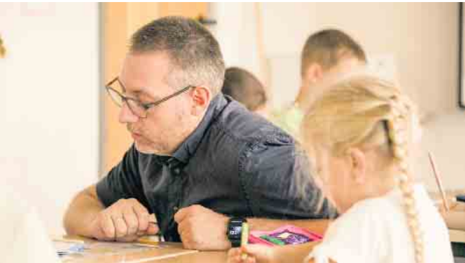
Kleine Klassen, gute Ausstattung und individuelle Betreuung in der Grundschule.

Frische Farben, erweiterte Inhalte und viele neuen Informationen