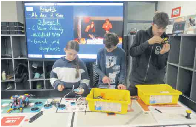
Völlig vertieft.