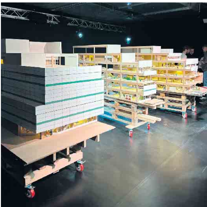
Über 1000 Arbeitsstunden steckten die drei in ihr Modell - gearbeitet wurde mit Holz und Pappe.