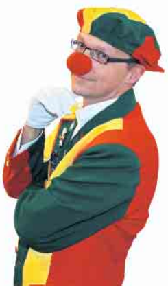
Als „Goldenes Herzträger 2025“ ist „Dä Tupples vum Land“ am Start.