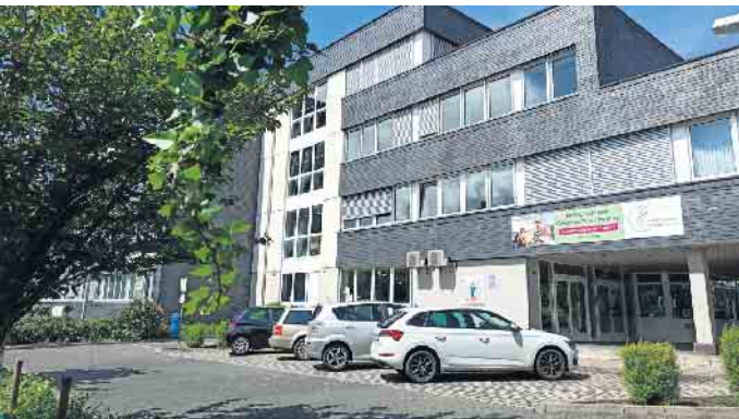
Seit fast 15 Jahren an diesem Standort - Das Schulgebäude an der Frankfurter Str. 86 in Siegburg.

len mit ihren Stärken und Begabungen als Lehrkraft oder Mitarbeitende ergänzen möchten. Der Verein Christlicher Schulen Rhein-Sieg e. V. betreibt im Schulzentrum an der Frankfurter Straße 86 in Siegburg eine private Grundschule sowie eine private Gesamtschule, einschließlich gymnasialer Oberstufe. Im Jahr 2025 feiern die Schulen ihr 15-jähriges Bestehen an diesem Standort.