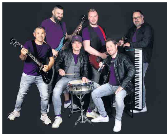
Mit Kölschen Hymnen und einem Schuss Rock'n'Roll sorgen die „Kelz Boys“ für 111 Prozent Partyalarm.

Eintrittspreis 24 Euro (Angebot für närrische Sparfüchse: Vier Eintrittskarten zum Preis von drei). Farbenfrohe Kostümierungen erwünscht. Keine Abendkasse. Kartenbestellungen bei KG-Geschäftsstelle, Mendener Str. 74, 53840 Troisdorf, Tel. 02241/ 79668 bzw. E-Mail: toennisberger@magenta.de . Infos unter: www.dietoennisberger.de