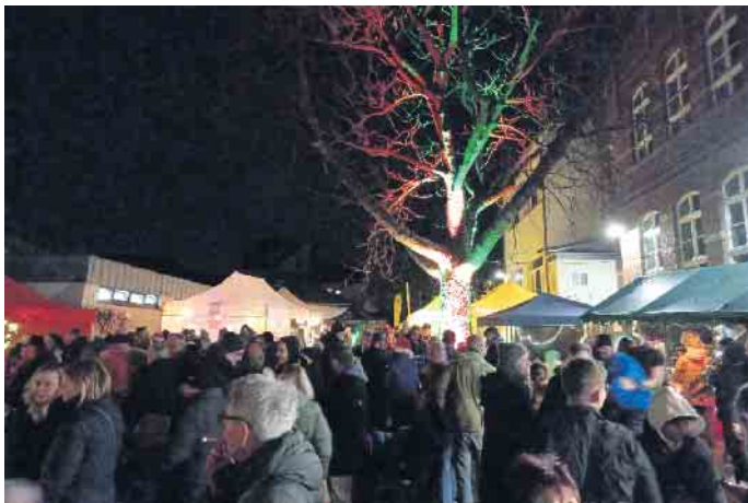
Adventsmarkt am Abend

markt, der von der Interessengemeinschaft der Wolsdorfer Vereine 1966 e. V. veranstaltet wurde. Dieser Adventsmarkt erfreute wieder Jung und Alt mit seiner weihnachtlichen Atmosphäre. Privatanbieter, Vereine und Einrichtungen aus dem Stadtteil Wolsdorf boten an ihren Ständen Weihnachtsdekoration und -karten, Selbstgebasteltes, Gebäck, aber