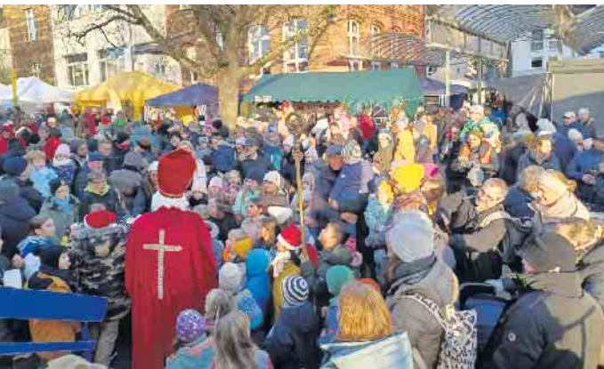
Der Nikolaus ist da

te und die passenden Worte fand, aus. Die Interessengemeinschaft der Wolsdorfer Vereine 1966 e. V. kann auf einen gut besuchten Adventsmarkt, der insbesondere am Samstagabend mit der Atmosphäre die Besucher in seinen Bann zog, zurückblicken. Allen, die zum Gelingen des 20. Wolsdorfer Adventsmarktes beigetragen haben, sei an dieser Stelle gedankt.