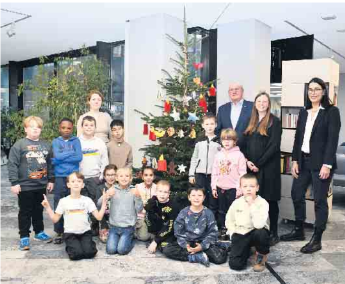
Landrat Sebastian Schuster und Kreisdirektorin Svenja Udelhoven zusammen mit einigen der Schülerinnen und Schülern sowie Lehrerinnen der Rudolf-Dreikurs-Schule.

Rhein-Sieg-Kreis (rl). „Wenn Ihr mit Eurem tollen, selbst gebastelten Weihnachtsschmuck zu uns ins Kreishaus kommt, dann ist Weihnachten“, freuen sich Landrat Sebastian Schuster und Kreisdirektorin Svenja Udelhoven. Kurz vor dem 1. Advent stand auch in diesem Jahr wieder der große Tannenbaum im Foyer des Siegerburger Kreishauses und wartete auf den bunten Baumschmuck der Schülerinnen und Schüler der kreiseigenen Rudolf-Dreikurs-Schule. Und die hatten sich wieder ganz besonders ins Zeug gelegt: Papierkerzen, Glocken, Sterne und Engel leuchteten um die Wette und machten die Tanne schnell zu einem richtigen Weihnachtsbaum. „Ihr bringt echte Weihnachtsstimmung in unsere Verwaltung; dafür danke ich Euch ganz herzlich“, so Landrat Sebastian Schuster.