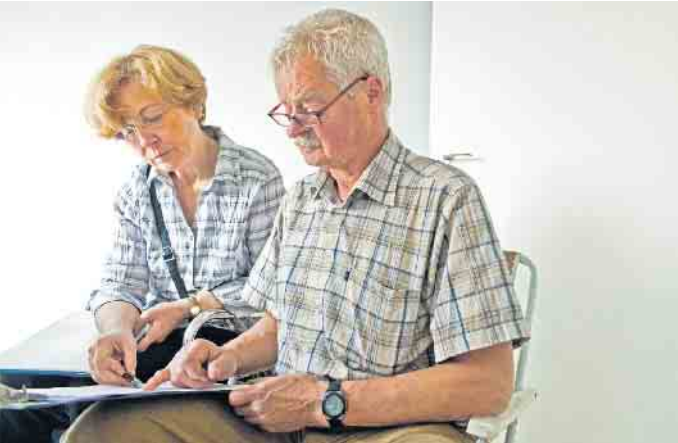
Angebote von Bauunternehmen für den Bau der eigenen vier Wände sollte man genau unter die Lupe nehmen, gegebenenfalls mit sachverständiger Unterstützung.

Bei der Wahl eines geeigneten Baupartners sollte man sehr sorgfältig vorgehen