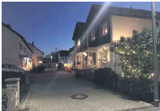
Adventsfenster auf dem Deichhaus aus dem vergangenen Jahr

sind den aktuellen Bedingungen angepasst. Man setzt auf Energiesparlampen und zur Müllvermeidung auf die eigene (mitgebrachte) Tasse. Die Termine, an denen Aktionen stattfinden, an denen die einzelnen Fenster besonders schön geschmückt sind, finden sich auf der Homepage der BG-Deichhaus unter www.bg-deichhaus.de , unter deren Facebook-Auftritt und im Schaukasten bei der Kita Deichhaus Küken. Alle Nachbarn und Freunde, nicht nur Vereinsmitglieder, sind herzlich zu den verschiedenen Aktionen eingeladen.