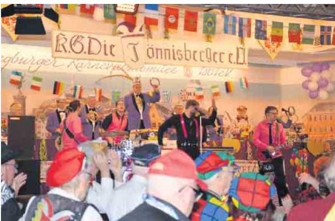
Mega-Stimmung ist auf der Tönnisberger-Prunksitzung garantiert.

Eintritt 22 Euro (Sparangebot: Vier Tickets nehmen - nur drei bezahlen!) Kartenbestellungen: KG-Geschäftsstelle, Mendener Str. 74, 53840 Troisdorf, Tel. 02241/ 79668 bzw. E-Mail: