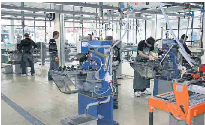
Ausbildung in der Flachglasindustrie.

Eine Alternative: Verfahrensmechaniker Glastechnik Etwas andere Schwerpunkte setzt der ebenfalls spannende Ausbildungsberuf als „Verfahrensmechaniker Glastechnik“ in der Flachglasindustrie. Hier erlernt man die Bedienung von Anlagen zum Glas schneiden sowie für die Formung, für die Veredelung und für die Bedruckung von Glas. Dazu gehören auch der Umgang mit Computerprogrammen, die mit den für die Glasbearbeitung notwendigen Daten versorgt werden müssen und die Qualitätskontrolle. „Diese Ausbildung dauert