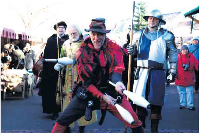
Beim Marktrundgang gab es schon tolle Showeinlagen.

tung ein intensiver Prozess sei, der jedoch durch die positive Rückmeldung belohnt werde. Die Veranstalter zeigten sich zufrieden mit dem gelungenen Auftakt und kündigten an, dass das Programm in den kommenden Wochen fortgeführt werde. (MAB)