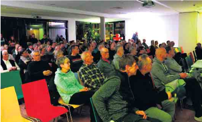
Viele Gästen haben sich den Vortrag angehört.

ich mein Leben nach einem Schicksalsschlag neu ausrichtete - und was jede*r davon lernen kann “. Wüst, 58 Jahre alt, 1967 in Köln geboren, begann bereits mit zehn Jahren mit dem Radsport. Nach dem Abitur gehörte er zur Sportförder-