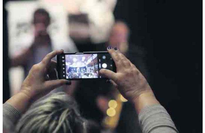
Es wurden zahlreiche Fotos und Videos gemacht, tolle Momente muss man festhalten.

zwischen Musik, Tanz und traditionellen Elementen. Viele Besucher erklärten, dass sie gerade diese Mischung als besonders gelungen empfanden, da sie den Abend abwechslungsreich gestaltete. Der Verein hob hervor, dass jede Gruppe einen wichtigen Beitrag zur Veranstaltung leistete und damit die Arbeit vieler ehrenamtlicher Helfer sichtbar wurde. Die Atmosphäre in der Gaststätte war über weite Strecken ausgelassen. Gäste sangen, tanzten und schunkelten, während die Auftritte ohne längere Pausen ineinander übergingen. Die Stimmung zeigte, welche Bedeutung