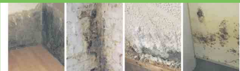
Defekte Horizontalsperre Querdurchfeuchtung Ausblühungen Schimmelbefall

In der gefüllten Aula entstand eine besondere Atmosphäre: konzentriert, still, aufmerksam. Bilder, Filmausschnitte und Ton verbanden sich mit Fechners eindringlichen Erzählungen zu einer Erkundung der Vergangenheit, die nicht nur informierte, sondern berührte. Viele Schülerinnen und Schüler beschrieben im Anschluss, dass sie einen neuen Zugang zu den Ereignissen des Holocaust gefunden hätten - direkt über das Schicksal einer einzelnen Familie, die aus der Anonymität der Geschichte hervorgehoben wurde. Klein