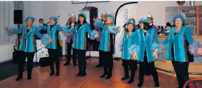
Damenkarnevalsgesellschaft Vergissmeinnicht und der KG Tönnisberger