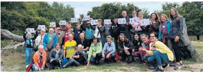
Teilnehmende der „Bundesweiten Woche des bürgerschaftlichen Engagements“ im vergangenen September.

Am 4. Dezember um 20 Uhr im Atelier „Kunst-Werk“, Gartenstr. 10, 53773 Hennef