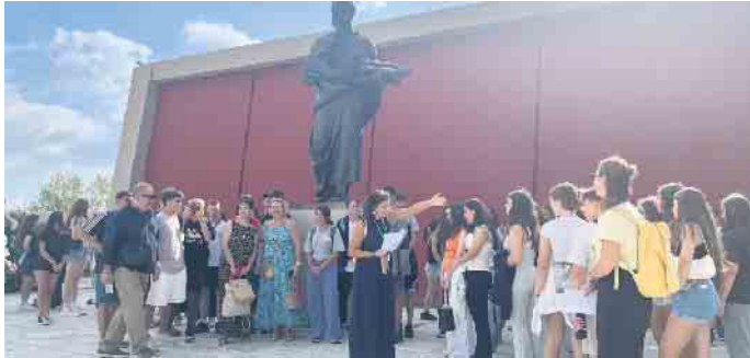
In Teilgruppen gab es verschiedene Aktivitäten.

innen und Schülern gelang eine reibungslose Umsetzung mit dem Ziel: „It’s better together - Celebrating what unites us“, dem diesjährigen eTwinning-Jahresmotto. In international gemischten Gruppen beschäftigten sich die Jugendlichen mit Fragen der eigenen kulturellen und ethnischen Identität sowie mit aktuellen gesellschaftlichen Herausforderungen wie Intoleranz und Rassismus. Die Arbeitsphasen waren intensiv, aber zugleich getragen von einer herzlichen und freundlichen Atmosphäre. Viele Teilnehmende nutzten die Zeit, um Ideen für eine Fortsetzung der Kooperation voraussichtlich im Bereich Nachhaltigkeit zu entwickeln. Parallel zum Pflanzen eines Korbinians-Applebaums in Siegburg wurde an der Partnerschule in Thessaloniki ein Olivenbaum