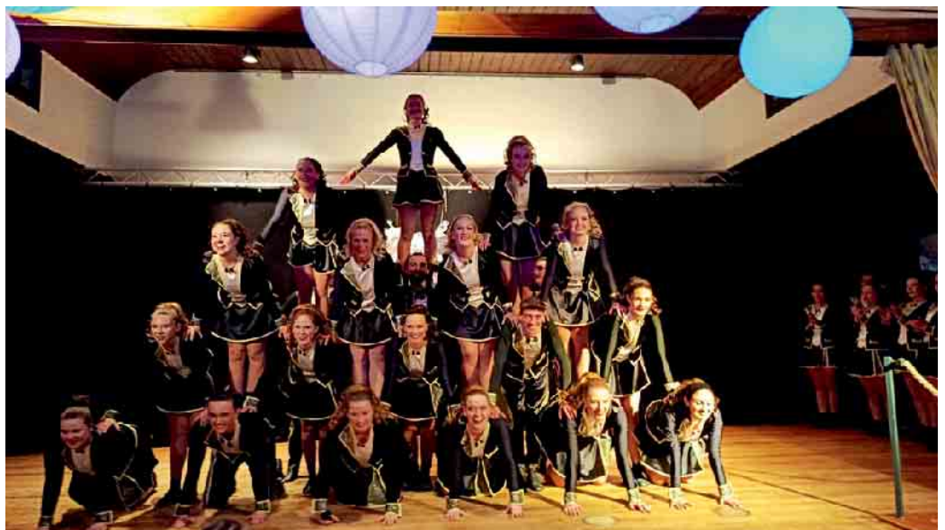
Gruppenbild einer der Tanzgruppen der Husaren

Die Zusammenarbeit zwischen Moderation und Leitung wurde von Gästen positiv wahrgenommen, da sie für einen reibungslosen Ablauf sorgte. Die Besucher erlebten einen Abend, der sowohl traditionelle Elemente als auch moderne Akzente vereinte. Damit bestätigte die Veranstaltung die Bedeutung des Karnevals als kulturellen Treffpunkt, an dem verschiedene Generationen zusammenkommen. (MAB)