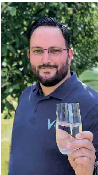
Markus Ernst, geprüfter Mineralwassersommelier.

www.mineralwasser.com/genuss-rezepte . (akz-o)