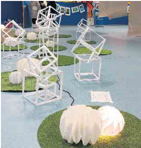
Lampendesign aus Papier

Woche lautete kurz zusammengefasst: Wir dürfen heute nicht auf Kosten anderer und auf Kosten von morgen leben.