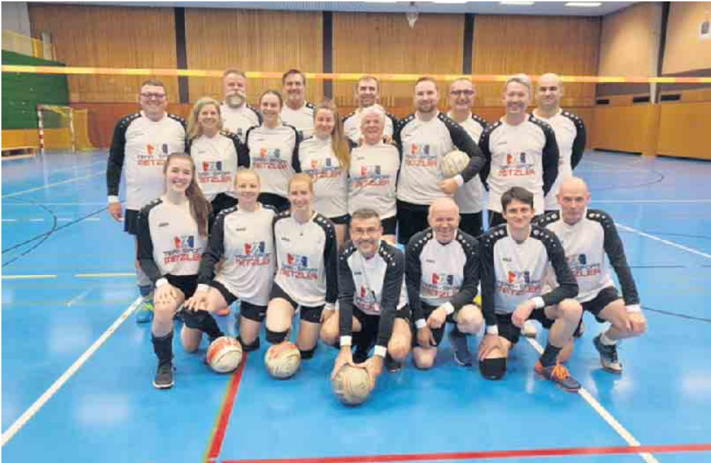
Teamsport Metzler ist alter und neuer Trikotsponsor der Faustballer-Abteilung des STV.