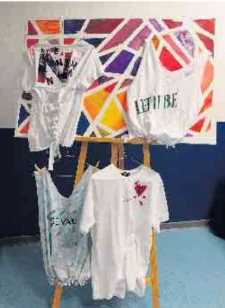
Aus Alt mach Neu

Ergebnisse des Schülerprojekts an der Städtischen Gesamtschule Am Michaelsberg Siegburg