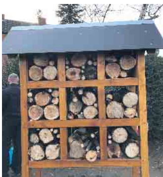
Das neue Hotel ist fast bezugsfertig.