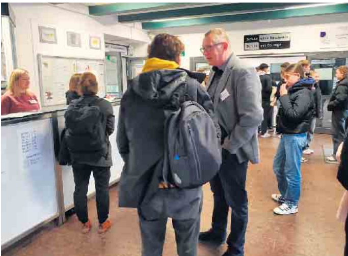
Interessante Gespräche im Foyer