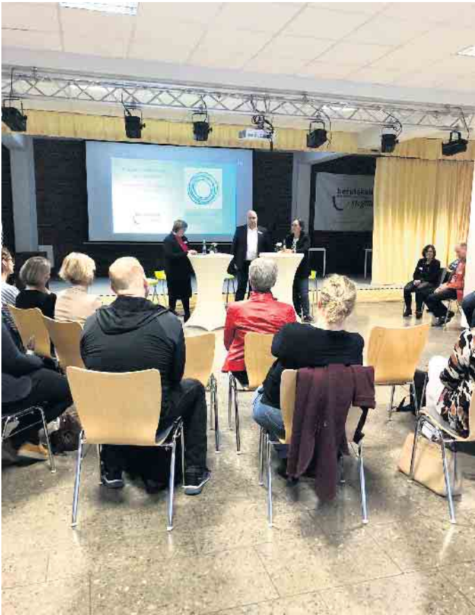
Offene Gesprächsrunde bei der Netzwerkveranstaltung

Vertreter:innen von Schule, Unternehmen, Institutionen und Hochschule tauschen sich über die Zukunft von Schule und Ausbildung am Berufskolleg des Rhein-Sieg-Kreises Siegburg aus