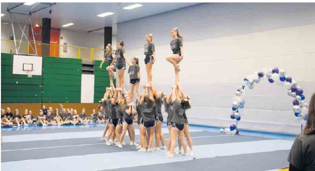
Die Saints verblüfften mit spektakulären Choreografien.

Zudem bieten die Saints am 23. Dezember die Betreuungsaktion „Wir warten aufs Christkind“ an. Während Eltern ihre letzten Weihnachtseinkäufe erledigen, können Kinder gemeinsam mit den Saints spielen und sich austoben - dafür wird eine abenteuerliche Geräte-landschaft aufgebaut. Die Aktion kostet 10 Euro pro Kind pro Zeitfenster. Das erste Zeitfenster läuft von 11 bis 13 Uhr und das zweite Zeitfenster von 13:30 bis 16 Uhr. Anmeldungen werden unter info@saints-cheerleader.de entgegengenommen. Die Saints Cheerleader zeigen also nicht nur auf der Bühne ihr Können, sondern steigern mit solchen Gemeinschaftsaktionen die Vorfreude auf Weihnachten und den Winterurlaub. (pho)