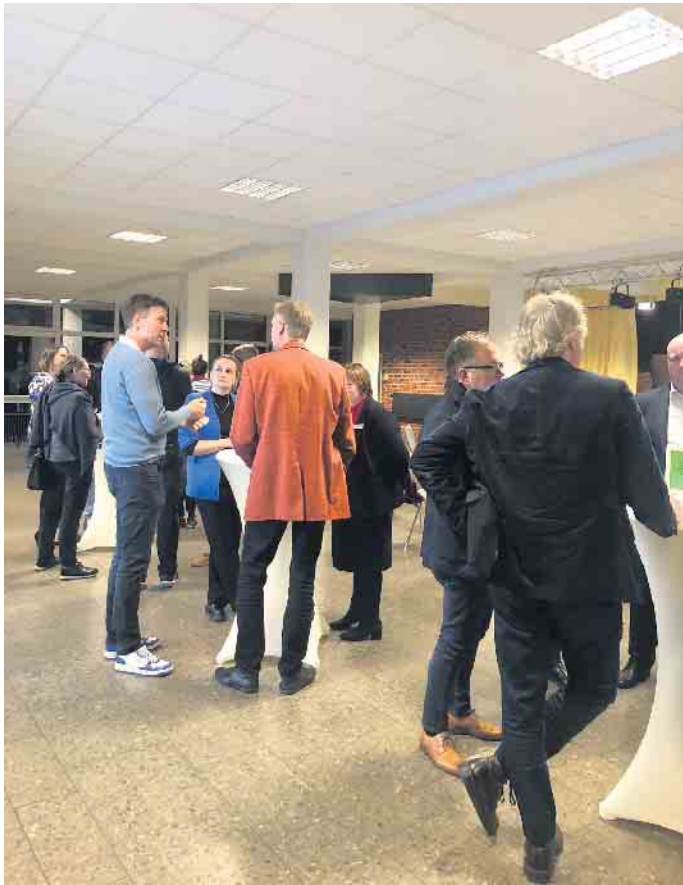
Teilnehmerinnen und Teilnehmer im Austausch

der des Zukunftsnetzwerks auf die Fahne geschrieben haben. Anfang des Monats fand das Jahrestreffen des Zukunftsnetzwerks am Berufskolleg des Rhein-Sieg-Kreises in Siegburg statt. Vertreter:innen aus Unternehmen, Institutionen wie der IHK, Arbeitsagentur oder Handwerkskammer, Hochschulen und Stadtverwaltung trafen in der Aula der Schule auf Mitglieder des Kollegiums des Berufskollegs. Im Rahmen der Netzwerktreffen soll der Austausch über Schule und Ausbildung intensiviert werden, um so eine passgenauere Ausrichtung des Berufsschulunterrichts zu ermöglichen. Gerade im Bereich Berufsorientierung, der am Berufskolleg einen hohen Stellenwert einnimmt, sollen die Anliegen der Ausbildungsbetriebe aufgenommen und Entwicklungen gemeinsam angesto-