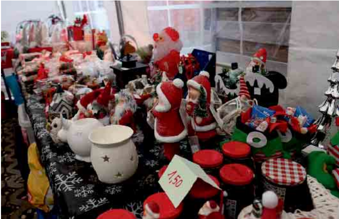
Wundervolle schöne Accessoires und Marmelade gab es zu kaufen.

Fünf Jahre gelebte Tradition: Engagierte Helferinnen und Helfer gestalten stimmungsvollen Verkauf