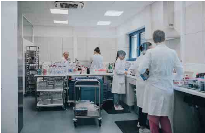
Im Institut Romeis werden Mineralwässer regelmäßig auf Herz und Nieren überprüft.

schied zu anderen Wasserarten: Mineralwasser ist ein Naturprodukt, das praktisch nicht verändert werden darf. „Nur unbeständige Stoffe wie Eisen oder Mangan dürfen entfernt werden, ansonsten bleibt alles wie es ist, sogar die Mineralisation muss im Rahmen natürlicher Schwankungen konstant bleiben“, so Schmittnägel. Diese natürliche Reinheit ist kein Zufall: Bevor ein Wasser als „Natürliches Mineralwasser“ verkauft werden darf, durchläuft es ein auf-