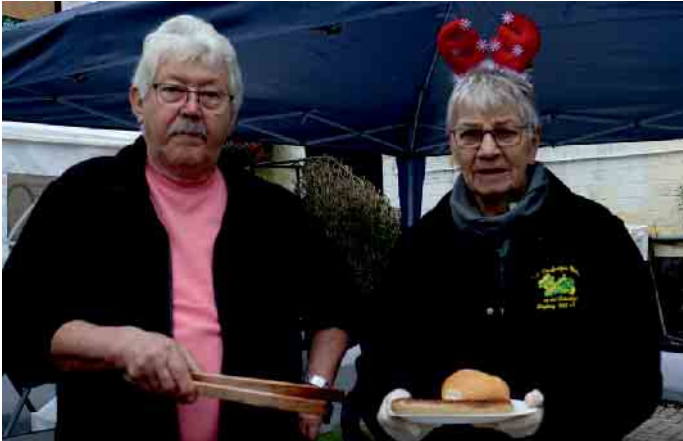
Leckere Grillwürstchen mit einem Brötchen gab es auch.

Möglichkeit schaffen wollte, handgefertigte Produkte aus der Nachbarschaft zu präsentieren und gleichzeitig die Gemeinschaft zu stärken. Der organisatorische Kern blieb bis heute unverändert: Alle Beteiligten arbeiten ehrenamtlich. Die Gäste zeigten sich beeindruckt von der Vielfalt der Waren, die von Schmuck über Kerzen bis hin zu Marmeladen und Likören reichte. Viele der Helferinnen und Helfer beschreiben die Vorbereitung als intensiv, aber lohnend. Sie betonen, dass die Zusammenarbeit über die Jahre gewachsen sei und die Veranstaltung inzwischen ein fester Treffpunkt für viele Familien ist. Vor Ort herrschte durchgehend eine herzliche, beinahe familiäre Atmosphäre. Der Duft von frisch