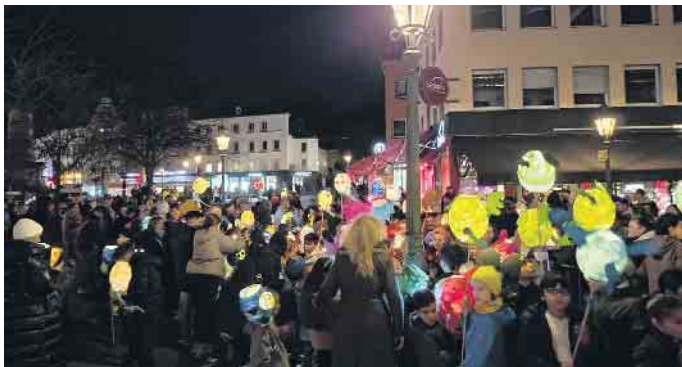
Ein Farbenmeer aus Laternen, wunderschön anzusehen

Der Martinszug selbst startete am frühen Abend, als die Dämmerung einsetzte. Zahlreiche Schulen und Kindergärten aus dem gesamten Stadtgebiet beteiligten sich, und überall leuchteten Laternen in den unterschiedlichsten Formen und Farben - von klassischen Papierlaternen bis zu aufwendig gestalteten Lichterfiguren. Überall war zu hören, wie Kinder mit kräftigen Stimmen Martinslieder sangen. Begleitet wurden sie von Musikgruppen und Spielmannszügen, die den Zug rhythmisch untermalten. Die VMS Medientechnik Wilfried Schmickler sorgte auf dem Marktplatz für die passende Beschallung. Die Atmosphäre in der Innenstadt war ausgelassen und friedlich. Viele Familien nutzten die Gelegenheit, um sich entlang der Strecke zu versammeln und den Zug zu bestaunen. Lichter spiegelten sich in den Schaufenstern, der Duft von heißem Kakao und Waffeln lag in der Luft, und immer wieder war das Staunen der Kinder zu hören,