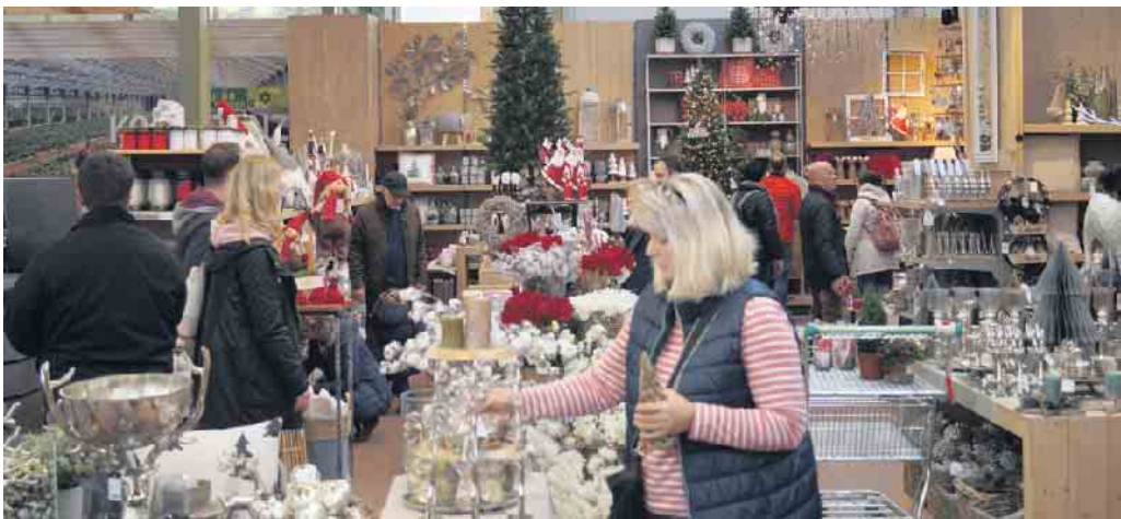
Konzentrierte Suche nach Weihnachtsdekoration

Allen, die sich für die festliche Zeit noch inspirieren lassen wollen, kann man einen Besuch sehr ans Herz legen.