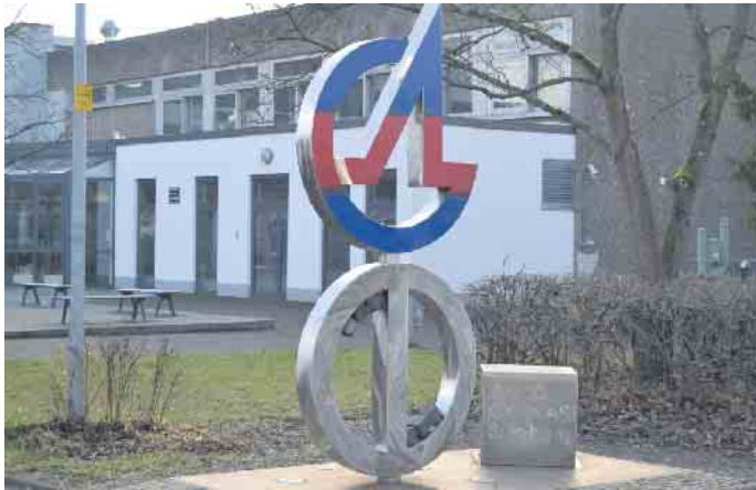
Willkommen am Anno-Gymnasium

das Anno-Gymnasium am Tag der offenen Tür allen interessierten Kindern und Eltern vor. Die zentralen (inhaltsgleichen) Informationsveranstaltungen beginnen 8.45 Uhr und 12 Uhr. Ab 18.15 Uhr kann man sich Besucherkarten für Unterrichtsbesuche in den fünften und sechsten Klassen oder für Hausführungen holen. Darüber hinaus gibt es im ganzen Haus zahlreiche Präsentationen, Gesprächsangebote, Experimente, eine Kinderbetreuung für kleinere Geschwisterkinder und eine Cafeteria. Genauere Informationen kann man auf der Homepage des Anno-Gymnasiums bekommen. Termine für Beratungsgespräche unter 02241/ 1026700.