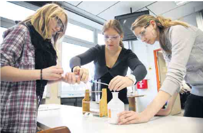
Ganztag am Anno: Naturwissenschaftliche AG „Foto: Anno-Gymnasium, Archiv“