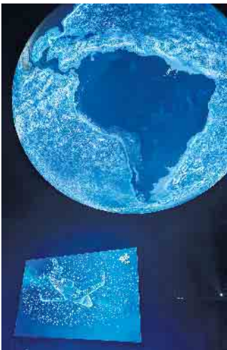
Die Animation des blauen Planeten auf der 20 m großen Kugel