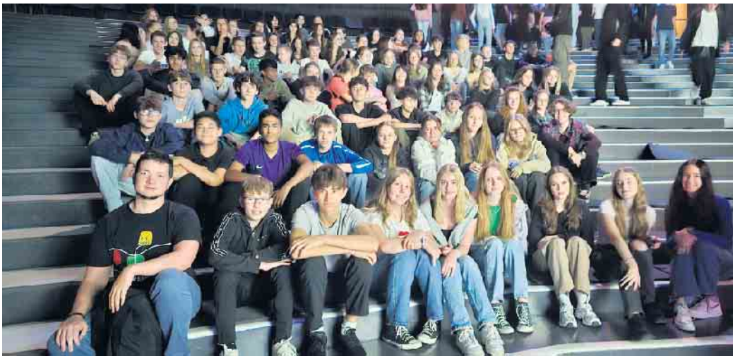
Die 10. Klassen des Anno-Gymnasiums im Gasometer

Die gesamte zehnte Jahrgangsstufe des Anno-Gymnasiums durfte eine faszinierende Reise ins Universum erleben. Der Ausflug führte sie zum Gasometer Oberhausen mit einer beeindruckenden 20 Meter großen Kugel, die mit Animationen basierend auf echten Satellitendaten beleuchtet wird und unseren Blauen Planeten aus dem Weltraum präsentiert. Besonders aufregend war der Tag durch die Anwesenheit des deutschen ESA-Astronauten Gerhard Thiele, der von seinem Flug ins All und dem einzigartigen Blick auf die Erde berichtete. Die Veranstaltung, organisiert vom Deutschen Zentrum für Luft- und Raumfahrt (DLR), ist ein Beitrag zum „Wissenschaftsjahr 2023 - Unser Universum“. Im Bühnenprogramm stellten Schülerinnen und Schüler ihre