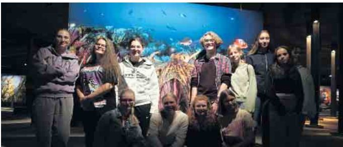
Schülerinnen in der Ausstellung „Das zerbrechliche Paradies“

Aktivitäten vor, die sie im Rahmen der DLR-Schulprojekte zum Wissenschaftsjahr durchgeführt haben. Dabei ging es um Beobachtungen mit Sonnen-