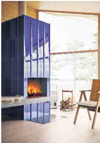
Ein moderner Kachelofen ist für Käufer oder Mieter inzwischen oft ein Grund, um sich für eine bestimmte Immobilie zu entscheiden.

Immer beliebter sind intelligente Vernetzungen von Kaminen und Kachelöfen mit anderen Wärmesystemen, wie zum Beispiel der Zentralheizung oder einer Solaranlage: Die Hybridsysteme arbeiten zuverlässig zusammen und sorgen für einen zukunfts-sicheren Energiemix. Welche Möglichkeiten realisiert werden können, weiß der Ofen- und Luftheizungsbauer. (djd)