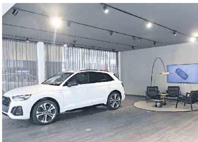
Der Übergabebereich für das neue AUDI Fahrzeug