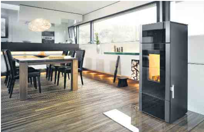
Kaminöfen mit moderner Technik sind eine Wertsteigerung für die Immobilie.

Die Zukunftsenergie Holz wertet Wohnungen und Häuser auf