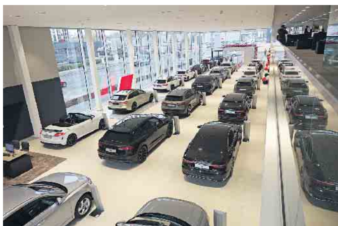
Die großzügige Ausstellungsfläche im Bonner AUDI Zentrum rückt die neuen AUDI Modelle ins rechte Licht.