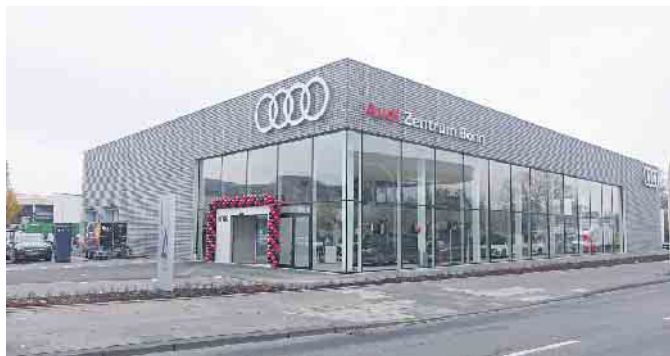
Straßenansicht des neuen AUDI Zentrums an der Bornheimer Str. 222 in Bonn

Das Traditionsunternehmen Fleischhauer-Franz hat am 17. November sein neues, dreigeschossiges AUDI Zentrum am Standort Bonn in der Bornheimer Str. 222 eröffnet.