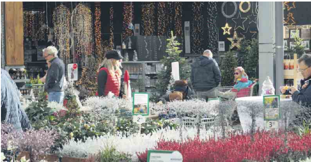
Im Hintergrund die Lichterketten