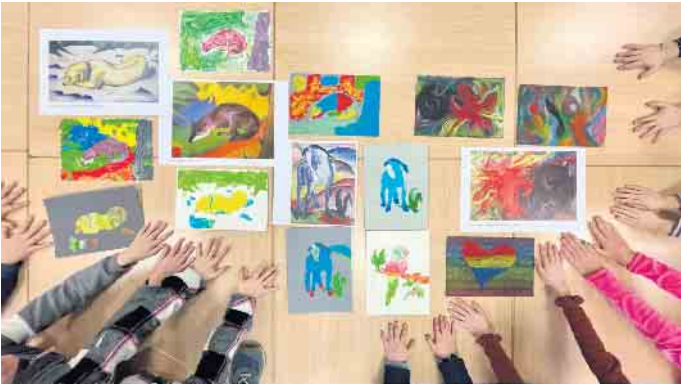
Schnupperkurs „Farblab“ vom letzten Jahr

Die Grundschulzeit für alle Kinder der vierten Klassen neigt sich dem Ende zu und so steht bald die wichtige Entscheidung an, an welcher weiterführenden Schule man sich anmelden möchte oder sollte. Um Hilfe für die Entscheidung zu geben, stellt sich