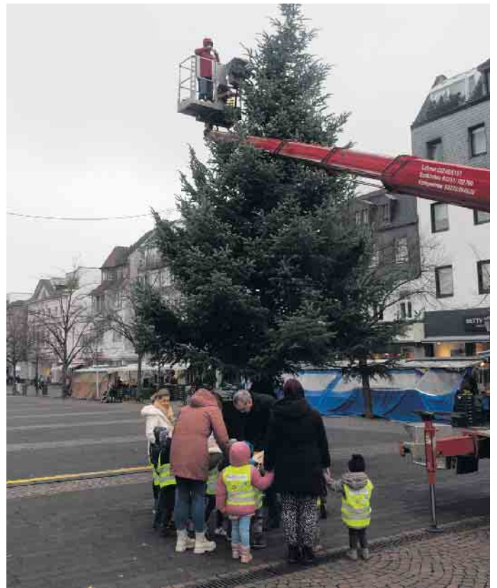
Kinder der Kita St. Servatius schmücken den Baum am Siegburger Markt

mit faszinierten Blicken. Als Stärkung verteilte der Bürgermeister Stefan Rosemann Mandarinen, um sicherzustellen, dass alle genug Energie für das fröhliche Schmücken hatten. Der Weihnachtsbaum auf dem Kreisverkehr der Wellenstraße erhielt ebenfalls eine zauberhaft weihnachtliche Verzierung, diesmal durch die kreativen Hände der Kinder der Hans Alfred Keller Schule. Mit großer Begeisterung schmückten sie den Baum mit selbstgebastelten Weihnachtssternen in allen erdenklichen Farben und Größen. Aufgrund des starken Verkehrs durften immer nur zwei Kinder gleichzeitig am Werk sein - Sicherheit geht schließlich vor. Auch hier wurden Mandarinen verteilt, und der Bürgermeister ließ es sich nicht nehmen, den Kindern tatkräftig beim Schmücken zu helfen. Die liebevoll gestalteten Dekorationen der Kinder verleihen den Bäumen eine Ausstrahlung, die die Stadt Siegburg in vorweihnachtliche Stimmung versetzt. (pho)