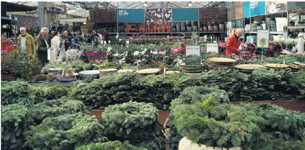
Tannengrün soweit das Auge reicht

Wer nicht beim Glühwein versackt war, kam nun an Christbaumkugeln vorbei und konnte aus allen erdenklichen Farben seine Lieblingsauswahl treffen.