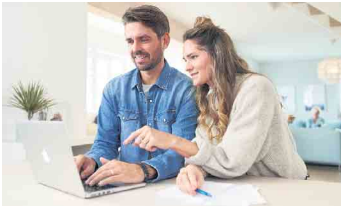
Nachrechnen lohnt sich: Zur Verbesserung der Eigenkapitaldecke gibt es verschiedene Möglichkeiten.