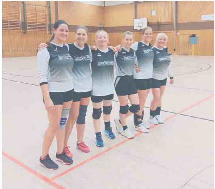
Die Faustballerinnen des STV liegen nach zwei Spieltagen auf dem 4. Platz in der Verbandsliga.

Die Faustballe des STV liegen nach dem zweiten Spieltag in der Landesliga auf dem sechsten Platz. Dabei wäre gegen den Leichlinger TV3 mehr drin gewesen als die letztlich unglückliche Drei-Satz-Niederlage. Aber im entscheidenden Moment fehlt dem Team noch die Konstanz. So konnte sich Leichlingen den dritten Satz und damit den Sieg holen. Gegen den verlustpunktfreien Tabellenführer Ohligser TV2 hielten die Faustballe des STV zwar gut mit, doch trotz mannschaftlich geschlossener Leistung konnte die Zwei-Satz-Niederlage nicht abgewendet werden. Dennoch zeigt sich deutlich, dass das Team derzeit hinter den Möglichkeiten zurückbleibt, was für die kommenden Spieltage optimistisch stimmt.