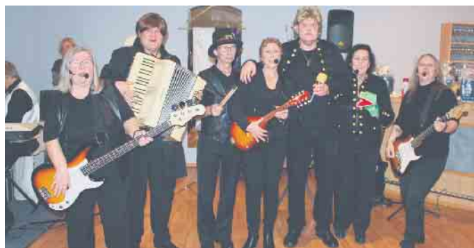
Für Riesengaudi sorgte ebenso die Tönnisberger Showgruppe