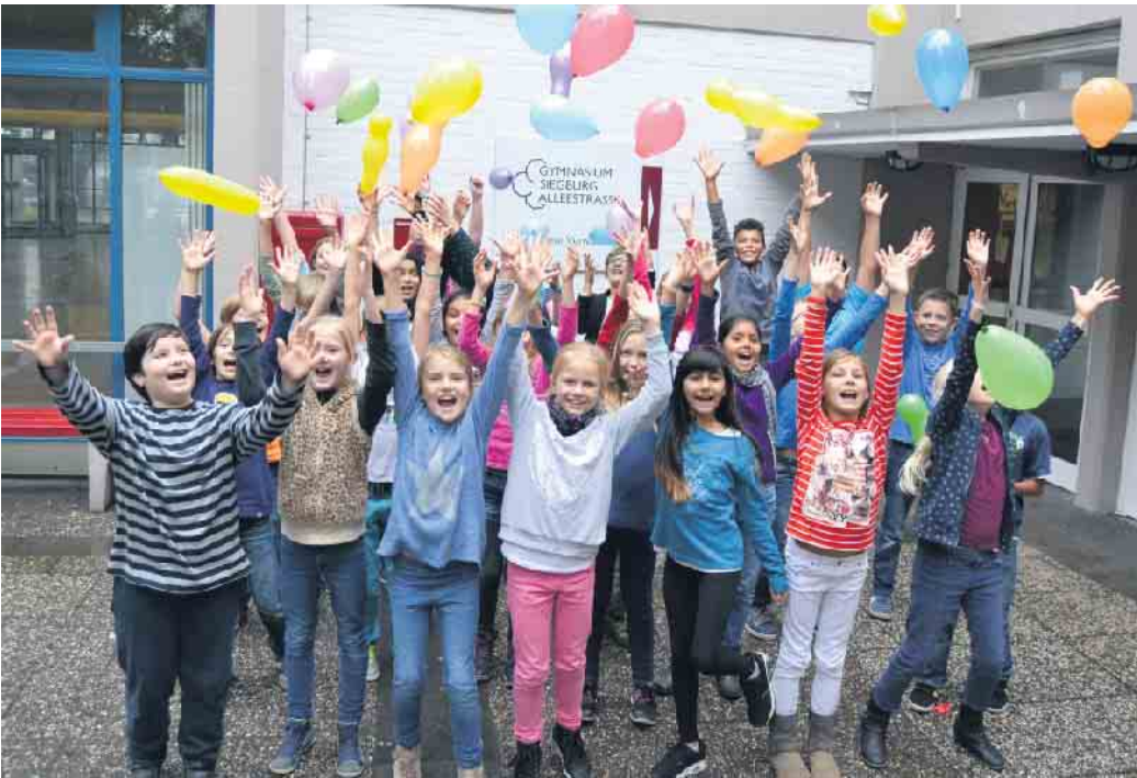
Das GSA freut sich darauf, Sie und euch kennenzulernen

Am Gymnasium Siegburg Alleestraße gibt es am Samstag ein buntes Programm für Groß und Klein