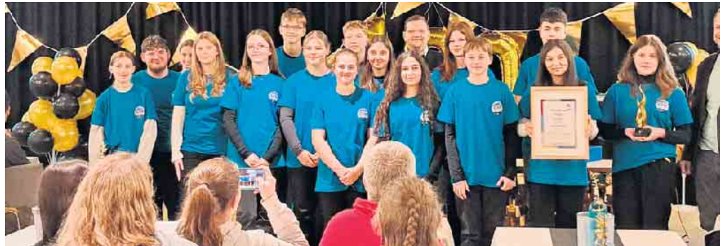
Auszeichnung des Schulsanitätsteams der Gesamtschule am Michaelsberg mit dem „JRK-Fackelpreis“