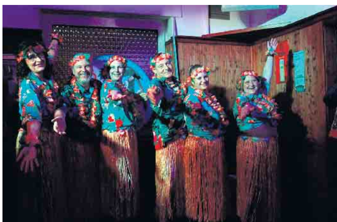
Auftritt des traditionellen Fünde-Ballett

Die Atmosphäre in der Kneipe war von Beginn an lebendig und herzlich. Gäste, Vereine und Aktive feierten in vertrauter Runde, sangen gemeinsam und schunkelten im Takt der Musik. Viele Besucherinnen und Besucher betonten, dass die Stimmung genau