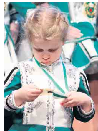
Die kleine Tänzerin freut sich über ihren tollen Orden.

Mit viel Vorfreude, Leidenschaft und einem klaren Bekenntnis zur Tradition gehen die Husaren Grün-Weiß in die neue Session. Der Auftakt hat gezeigt, dass die Liebe zum Karneval in Troisdorf ungebrochen ist - und dass die grün-weiße Husarenfamilie mit Herzblut und Lebensfreude bereit ist für eine unvergessliche fünfte Jahreszeit. (MAB)