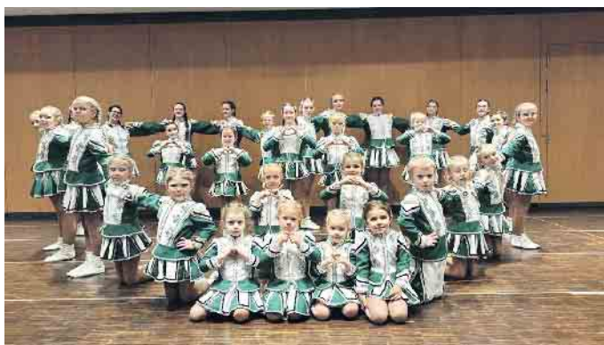
Herzliches Gruppenfoto des Kinder- und Junioren-Tanzcorps