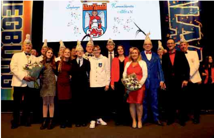
Kinderprinzenpaar, Prinzenpaar mit Ihrem Gefolge, das Karnevalskomitee des Kinderprinzenpaares der letzten Session und dem Bürgermeister

Neue Tollitäten begeistern Siegburg - Prinzenpaare starten mit Herz und Humor in die Session