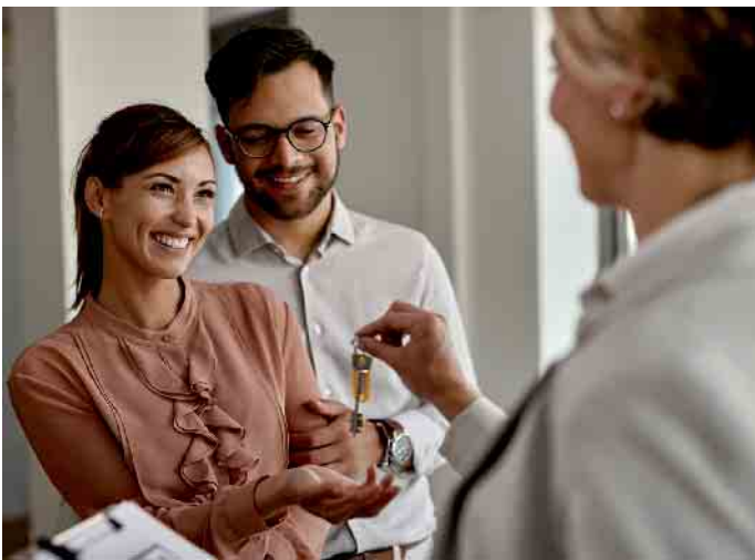
Der Kauf eines Hauses ist für die meisten Menschen eine wichtige Lebensentscheidung. Bei aller Freude aufs neue Zuhause sollte man sich dennoch Zeit nehmen, den Kaufvertrag gründlich zu prüfen.

Viele Käufer sind überrascht, dass sie trotz Vertragsunterzeichnung und Kaufpreiszahlung nicht sofort Eigentümer des Hauses werden. Juristisch entscheidend ist die Auflassung, also die Einigung zwischen Käufer und Verkäufer über den Eigentumsübergang, die vom Notar erklärt und im Grundbuch vollzogen wird. Erst danach gehört die Immobilie offiziell dem neuen Eigentümer. Der Besitzübergang, also das Recht, die Immobilie tatsächlich zu nutzen, wird meist separat im Vertrag geregelt und an die Kaufpreiszahlung gekoppelt. (DJD).