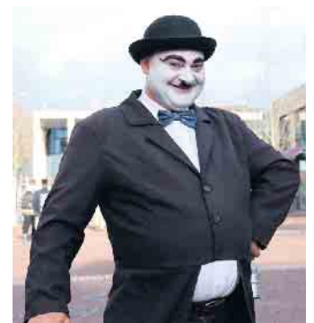
Ein Herr im Pantomime-Kostüm war in Siegburg unterwegs.

Der Mann im Pantomime-Kostüm wurde so zum Sinnbild dieses Tages: ein Einzeller, der die Freude