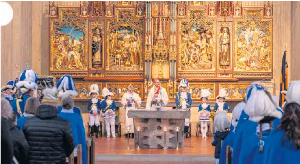
„Kumm, mer jonn en de Kirch!“: Auch in diesem Jahr starten die Funken Blau-Weiss mit einem Mundartgottesdienst in der Kirche St. Anno in die neue Karnevalssession, bevor sie im Rhein Sieg Forum ihren „Großen Regimentsappell“ feiern.