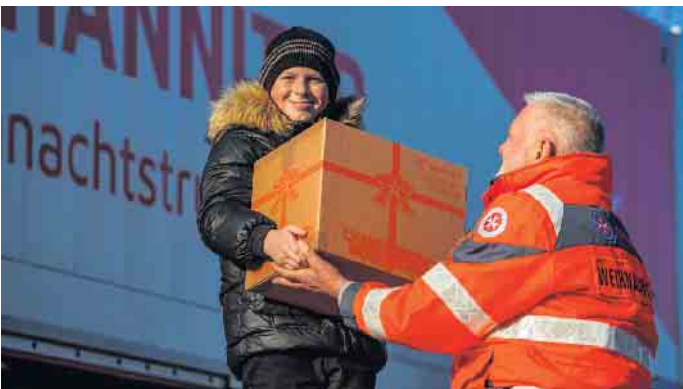
Auch in diesem Jahr sammeln die Johanniter wieder Päckchen für den Weihnachtstrucker.

Lohmar, Much, Sankt Augustin, Siegburg und Swisttal/Odendorf abgegeben werden. Die genaue Adresse und Abgabezeiten finden Interessenten unter diesem Link: qr.johanniter.de/weihnachtstrucker_abgabe Es ist wichtig, sich auch in diesem Jahr an die Packliste zu halten, damit keine Probleme am Zoll entstehen. Packliste Weihnachtstrucker-Päckchen: Ein Geschenk für Kinder (z. B. Malblock, Malstifte), 1 kg Zucker, 3 kg Mehl, 1 kg Reis, 1 kg Nudeln, 2 Liter Speiseöl in Plastikflaschen, 2 Packungen Multivitamin-Brausetabletten, 2 Packungen Kekse, 4 Tafeln Schokolade, 2 feste Seifen, 2 Zahnbürsten und 2 Tuben Zahnpasta.