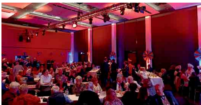
Der Kleine Saal war sehr gut besucht.

Tradition entspricht. Für viele Anwesende war die Vorstellung der Prinzenpaare der emotionale Höhepunkt des Abends.