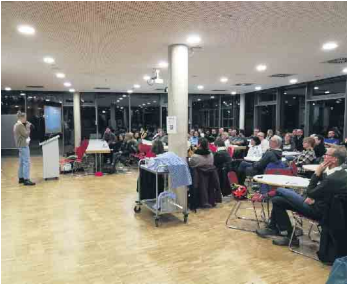
Mehr als 60 interessierte Eltern

Beleidigungen, Hasskommentare, politischer Extremismus und Verschwörungstheorien: In jeder dieser Kategorien berichten etwa die Hälfte aller Schülerinnen und Schüler, dass sie