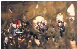
Der Konzertchor Rhein-Sieg während des Beethoven-Konzerts im Dezember 2022.