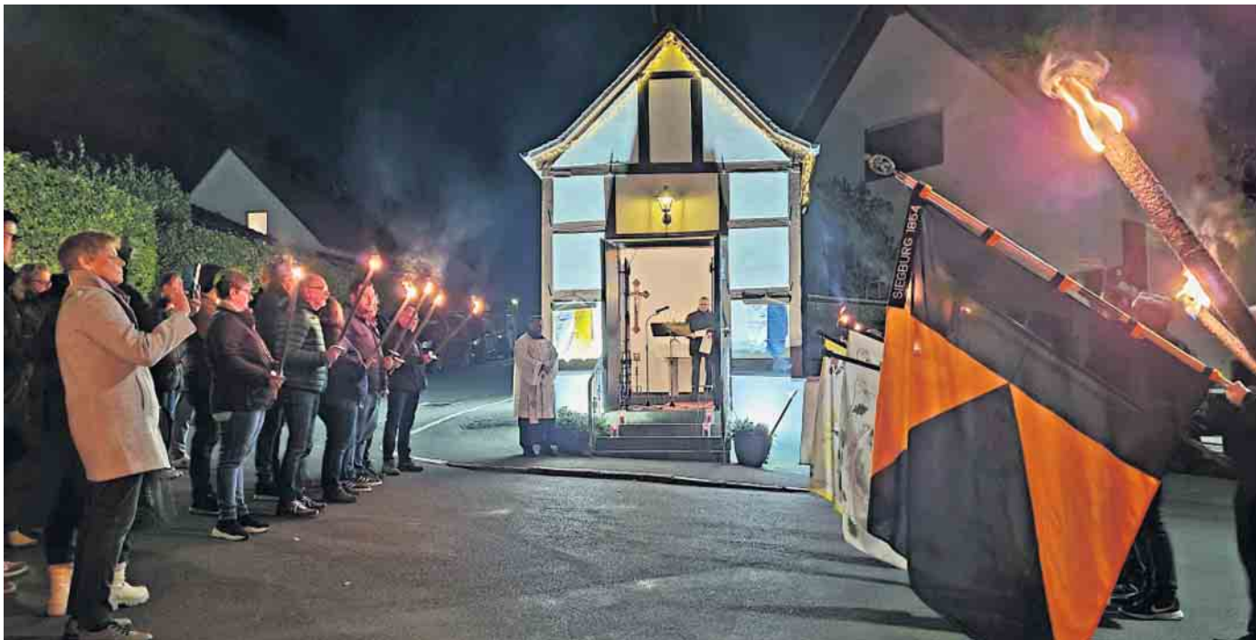
Feier an der Hubertuskapelle