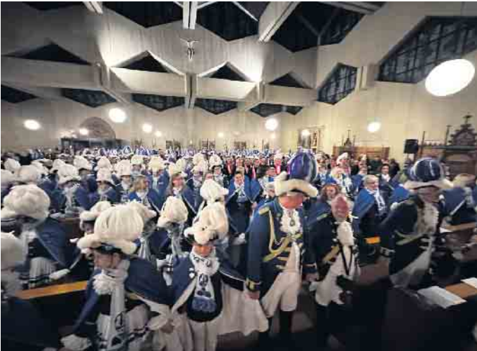
Zum Friedensgruß die Hände gereicht: Zum Auftakt der Session feierte die „Funke-Famillich“ in Sankt Anno ihre „Kirch op kölsch“.

Mit Laternenzug und „Halleluja“ der Funkenjugend