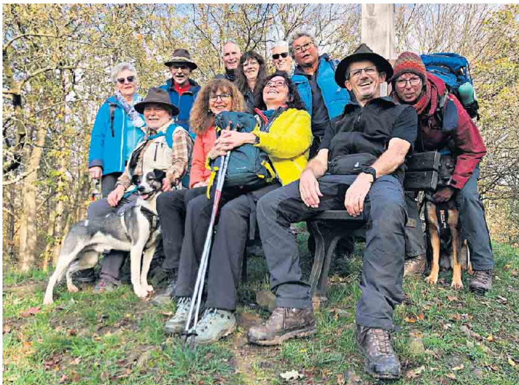
Die Wandergruppe I des PSV Siegburg e. V. beim Gipfelfoto auf der Koppe im Siebengebirge.

Wandergruppe I des Polizeisportvereins Siegburg e. V. wieder auf Sonntagstour