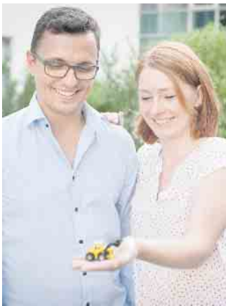
Für den Bau des eigenen Zuhauses kommt es auf eine solide Eigenkapitalbasis an.

Ältere haben tendenziell mehr Ersparnisse Es spricht nichts dagegen, auch später eine Immobilie zu kaufen oder zu bauen. Der große Vorteil ist, dass älteren Darlehensnehmern tendenziell mehr Ersparnisse zur Verfügung stehen, die sie als Eigenkapital in die Finanzierung einbringen können - dadurch vergünstigt sich der Zinssatz. Allerdings fordern viele Banken eine höhere Tilgung als bei jungen Kunden, damit der Kredit zügig zurückgeführt wird. „Kreditinstitute achten darauf, dass die Käufer auch nach Ende der vereinbarten Zinsbindung in der Lage sind, die Monatsraten zu zahlen“, so Stefan Vogelsang. „Wenn sie dann eine Rente statt des bisher-