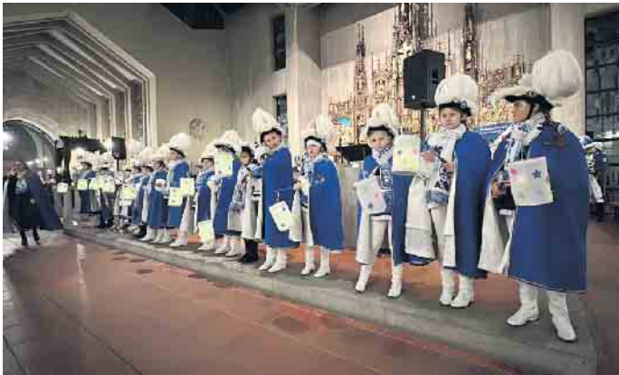
„Ich geh’ mit meiner Laterne“: Beim kölschen „Fessjoddesdeens“ auf Sankt Martin zog die Jugendtanzgruppe der Funken auch mit bunten Laternen durch das Gotteshaus.