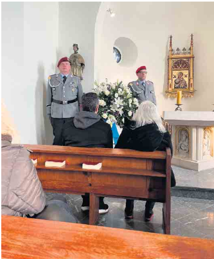
Ehrenwache in der Nepomuk Kapelle auf dem Alten Friedhof in Siegburg.