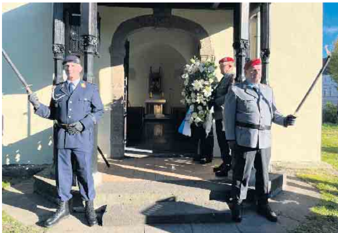
Ehrenwache vor der Nepomuk Kapelle auf dem Alten Friedhof in Siegburg.

deutschen Soldaten des Ersten Weltkriegs vor. Die erste Gedenkstunde fand am 5. März 1922 im Reichstag in Berlin statt. Erstmals wurde der Volkstrauertag dann am 1. März 1925 begangen. Für Reservisten ist dieser Tag der, an dem sie ihren gefallen Kameraden und den Opfern von Gewalt und Vertreibung gedenken, aber auch zeigen, wofür sie stehen. Recht und Freiheit zu beschützen war der Auftrag im akti-