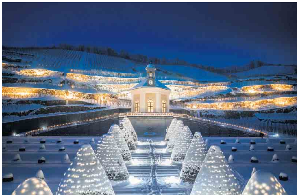
Europas erstes Erlebnisweingut leuchtet im Winter im Lichterglanz.

Die Winzer von Schloss Wackerbarth begannen sofort, diese vergessene Tradition wieder aufleben zu lassen. Behutsam passten sie die alte Rezeptur an den heutigen Geschmack an. Aus ausgewähltem sächsischen Weißwein, Traubensaft und fein würzenden Zutaten schufen sie ein feinfruchtiges Wintergetränk