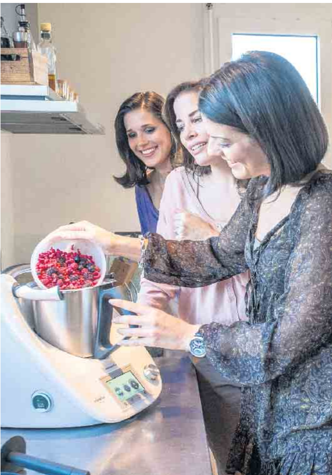
So wird kaufen zum Erlebnis: Bei Produktpräsentationen zu Hause kann man in Ruhe alles ausprobieren.

Wohnzimmer werden zur Verkaufsbühne, die Vertriebspartner können ihre Tätigkeit somit noch flexibler ausüben. Unter www.direktvertrieb.de gibt es mehr Details und die Möglichkeit, sich über die verschiedenen Einstiegschancen zu informieren. Auch bei der Gewinnung von Mitarbeitern sowie deren Schulung hat die virtuelle Welt an Bedeutung gewonnen. Ein weiterer Trend: Nachhaltigkeit wird immer wichtiger für die Branche. In der aktuellen Marktstudie geben 91 Prozent der befragten Unternehmen an, sich bereits mit diesem Thema zu beschäftigen, von den Produkten selbst bis hin zur nachhaltigen Optimierung von Verpackungen. (djd)