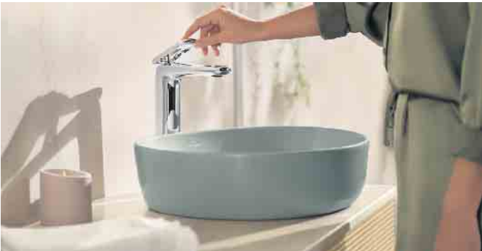
Einhebelmischer am Waschtisch oder in der Dusche eignen sich gut zum Energiesparen , da hier die gewünschte Temperatur zügiger eingestellt werden kann als mit Zweigriffarmaturen.

Nicht nur der eigentliche Wasserverbrauch, sondern auch die energieaufwendige Wassererwärmung für Dusche & Co schlägt in jedem Haushalt nicht nur kostenmäßig, sondern auch in der Nachhaltigkeits-Bilanz merklich zu Buche.