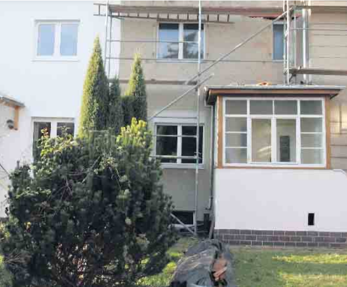
Ältere, günstige Häuser können auf den ersten Blick verlockend für Immobilieninteressenten sein. Ein genauer zweiter Blick auf Bausubstanz und Renovierungsbedarf ist aber wichtig.

Renovierungs- und Modernisierungskosten nicht zu optimistisch schätzen