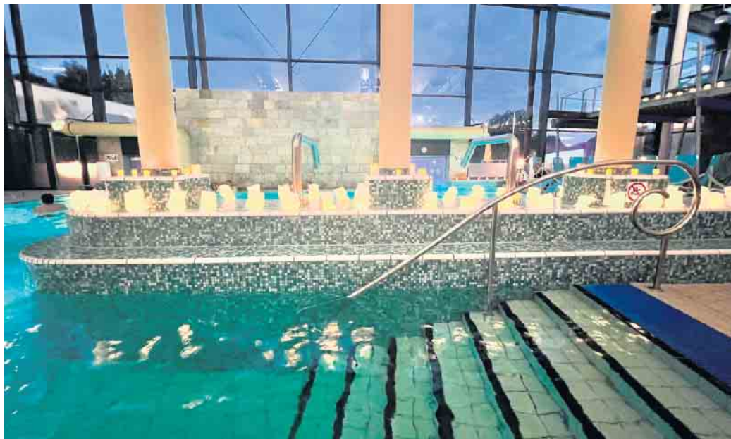
Romantische Atmosphäre im AGGUA: Das Entspannungsbecken erstrahlt im sanften Kerzenschein- pure Entspannung beim Candlelight-Schwimmen.

Candlelight-Abend mit Piano-Begleitung am 5. November