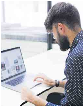
Eigene Qualifikationen, Berufserfahrungen und Stärken darf man online selbstbewusst darstellen.

le weitere Tipps für das digitale Eigenmarketing und die Jobsuche. Noch ein Tipp, der auf alle sozialen Plattformen zutrifft: Ein systematisches Aufräumen der eigenen Kontaktliste schafft Klarheit und sorgt dafür, dass man selbst relevantere Beiträge angezeigt bekommt. (djd)