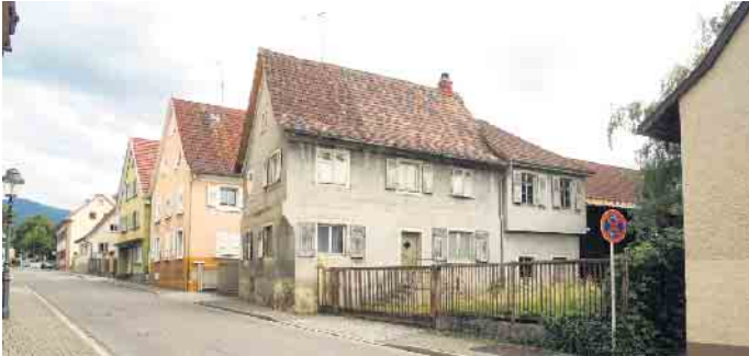
Wenn der Preis einer Immobilie fast zu schön ist, um wahr zu sein, sollte man den Renovierungsbedarf vorab mithilfe eines unabhängigen Sachverständigen prüfen.

Bei einer älteren Immobilie können im Zuge einer Renovierung und Modernisierung immer zusätzliche Probleme auftauchen, die auch ein Sachverständiger nicht sehen konnte.