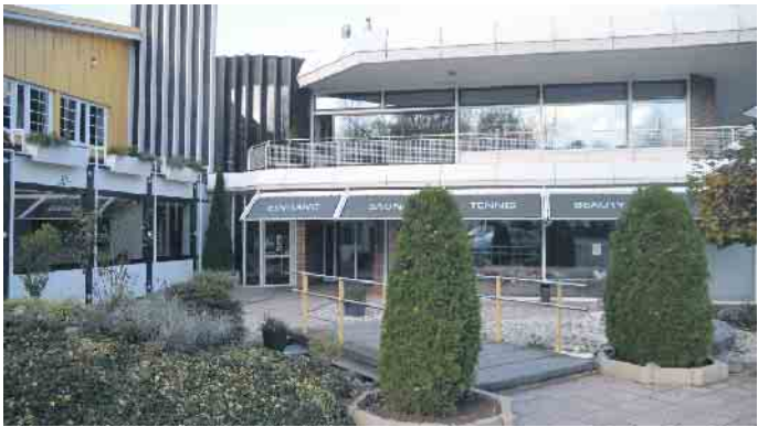
Der Saunapark Siebengebirge bietet viele Möglichkeiten, Ruhe und Entspannung zu genießen.