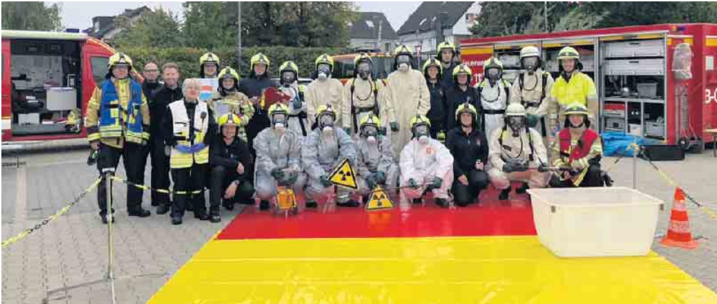
Nach über 40 Stunden Theorie und Praxis schlossen die 20 Teilnehmerinnen und Teilnehmer den Lehrgang erfolgreich ab.

Die Feuerwehr Troisdorf war Ausrichter des gerade zu Ende gegangenen Strahlenschutz-Lehrgangs, an dem insgesamt 20 Kameradinnen und Kameraden mit Erfolg teilgenommen haben. Abstand halten, Aufenthaltsdauer begrenzen, Abschirmung nutzen und, wenn möglich, abschalten. Das waren neben allerhand interessanten Themen die besonders wichtigen Einsatzgrundsätze. In über 40 Stunden Theorie und Praxis konnten die neuen Spezialkräfte (darunter auch sechs Frauen) aus Siegburg, Hennef, Sankt Augustin, Eitorf und Troisdorf verschiedene Messgeräte und deren Taktik nach Feuerwehr-