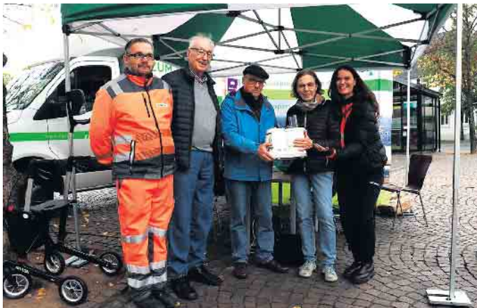
Die Küchenmaschine wurde wieder ans Laufen gebracht.

werden, leisten wir einen wichtigen Beitrag für Umwelt und Ressourcen.“ Die Resonanz auf den ersten Termin war so positiv, dass bereits jetzt überlegt wird, die Aktion auszubauen. Denkbar sind weitere Kooperationen mit Schulen, Vereinen oder lokalen Handwerksbetrieben. Die Veranstalter hoffen, dass sich der Reparatur-Tag zu einer festen Größe im Siegburger Veranstaltungskalender entwickelt. Für die Besucher stand am Ende vor allem ein Gedanke im Mittelpunkt: Reparieren lohnt sich. Nicht nur, weil es Geld spart, sondern weil es ein Zeichen setzt - gegen Verschwendung und für Verantwortung. Auf dem