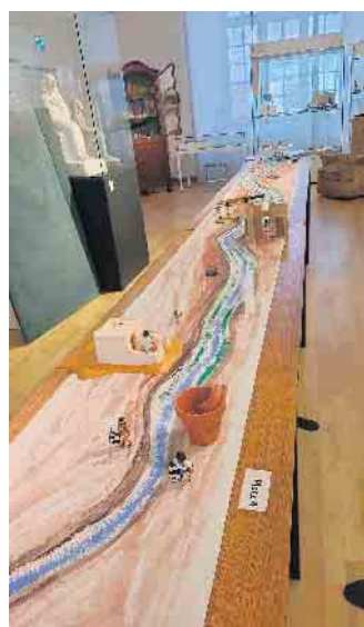
Stilisierter Verlauf des Nils

Jeden Freitag besteht die Möglichkeit, einen Nachmittag im Ägyptischen Museum zu verbringen. Es beginnt mit einer Führung, Einführung in die Hieroglyphen-Schrift, ausprobieren, was gebastelt und geschrieben werden kann, Vorbereitung der Kurse für den nächsten Tag, allgemeine Tätigkeiten und Informationen rund um das Museum. Termin: Jeden Freitag im November ab 15 Uhr , Dauer: Bis 18 Uhr, Kosten-