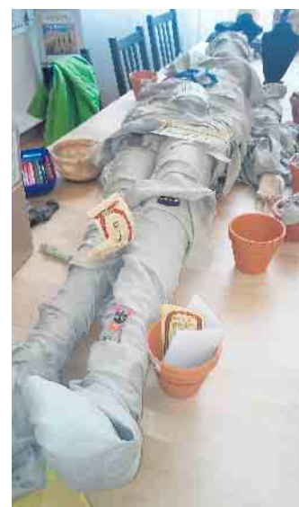
So wird aus einer Schaufensterpuppe eine Mumie.

beitrag 15 Euro pro Teilnehmer Veranstaltungsort für alle Kurse: Ägyptisches Museum der Universität Bonn