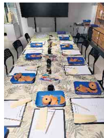
Seminarraum im Museum

Nähere Informationen unter der Homepage „Verein-Ägyptisches-Museum Bonn“. Das Museum ist barrierefrei. Hinweisen möchten wir noch auf das Angebot „ Geburtstag im Ägyptischen Museum “. Es steht ein dekorierter Raum für eine kleine Feier und Platz für ein mitzubringendes Büfett zur Verfügung. Ebenso gibt es einen spannenden Bastelnachmittag im Ägyptischen Museum.