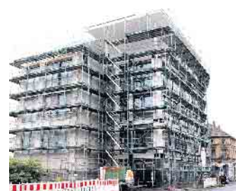
Rückansicht des Neubaus an der Alleestraße Ecke Wilhelmstraße

Medienvertreterinnen und -vertreter sind eingeladen, sich vor Ort ein Bild vom Baufortschritt zu machen. Führungen und Gespräche sind nach Absprache mit der Kreishandwerkerschaft möglich. Das neue Gebäude soll Anfang 2026 feierlich eröffnet werden. Dann will die Kreishandwerkerschaft ihren Mitgliedern, Partnern und Gästen einen modernen Ort präsentieren, an dem Tradition und Zukunft des Handwerks sichtbar verbunden werden. (MAB)