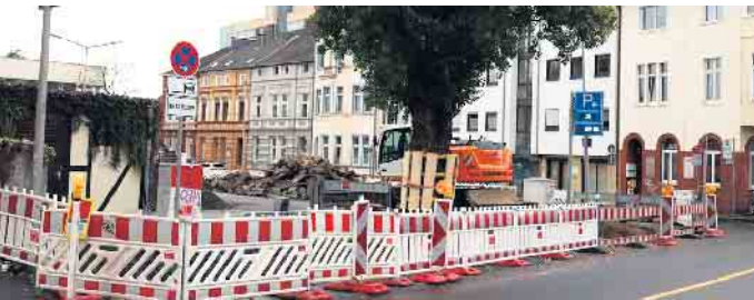
Ansicht der Bauarbeiten an der Heinrichsstraße

Siegburg startet in nächste Phase der Verkehrswende