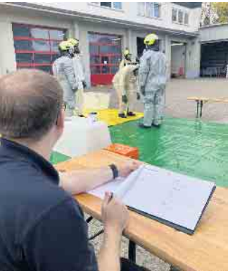
Nicht nur Dekontaminieren, auch das Protokollieren der Maßnahmen gehört zur Pflichtübung.

Feuerwehr-Frauen und -Männer in moderner Technik ausgebildet