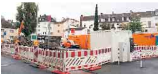
Ansicht vom Parkplatz der VHS

traktiver zu gestalten. „Wir schaffen Orte, an denen Mobilität funktioniert und sich Menschen gerne aufhalten“. Durch die Kombination verschiedener Angebote entsteht ein zeitgemäßes Verkehrssystem, das sowohl den Alltag der Pendler als auch die Lebensqualität der Stadt verbessert. Die Fertigstellung der Anlage an der Volkshochschule ist für Mitte November vorgesehen. Danach soll die Mobilstation offiziell eröffnet und in Betrieb genommen werden. Sie wird künftig ein zentraler Knotenpunkt für moderne, um-