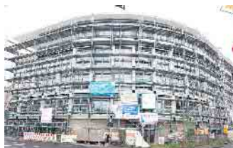
Vorderansicht des Neubaus an der Alleestraße in Siegburg

geschlossen, und in vielen Räumen hängen bereits die Decken. In den kommenden Wochen folgen Bodenarbeiten, die Fassadenverkleidung und der Innenausbau. Wenn alles planmäßig verläuft, sollen die Beschäftigten der Kreishandwerkerschaft Anfang 2026 in das neue Gebäude einziehen. Mit dem Neubau schafft die Kreishandwerkerschaft ein modernes Zentrum für Handwerk, Dienstleistung und Austausch. Auf rund 3.000 Quadratmetern Nutzfläche entstehen Arbeitsräume, Besprechungszonen und Flächen für Partnerunternehmen. Im Erdgeschoss werden die IKK Classic und die Signal Iduna Versicherung ihre Büros beziehen. Für das erste und Teile des zweiten Obergeschosses laufen derzeit Gespräche mit möglichen Mietern, bei denen eine baldige Entscheidung erwartet wird. Ein weiterer Gebäudeteil im zweiten Stock wird von der Steuerberatungsstelle der Kreishandwerkerschaft genutzt. Die Verwaltung selbst zieht in das gesamte dritte Obergeschoss. Ein besonderes Highlight des Neubaus entsteht im vierten Stock: